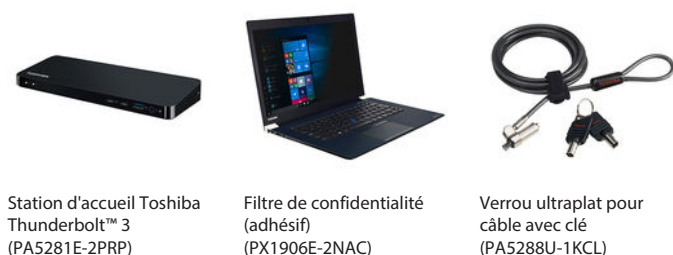
Station d'accueil Toshiba Thunderbolt™ 3 (PA5281E-2PRP)