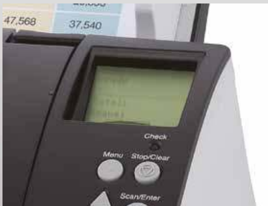
Panel de funcionamiento con pantalla de cristal líquido integrada

Los fi-7180, fi-7280, fi-7160 y fi-7260 incorporan funciones de administración central que los administradores de sistemas pueden utilizar para gestionar la instalación y funcionamiento de múltiples escáneres, monitorizar el estado de funcionamiento y actualizar los controladores y el software desde una única ubicación. Esta funcionalidad reduce drásticamente el coste y el trabajo requeridos en la configuración, funcionamiento y mantenimiento de un gran número de escáneres en una misma organización y también en la expansión de la red de escáneres a múltiples ubicaciones.