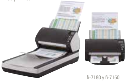
fi-7180 y fi-7160

fi-7160/fi-7260 – A4 vertical a 300 ppp 60 ppm / 120 ipm fi-7180/fi-7280 – A4 vertical a 300 ppp 80 ppm / 160ipm Digitalice lotes mezclados mediante el alimentador de 80 hojas