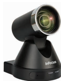
Caméra PTZ RealCam

Combo microphone et haut-parleurs Thunder (INA-TH150) : technologie d'élimination des bruits et de l'écho VoiceAware pour les salles de réunion de toutes les tailles