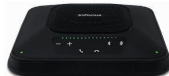
Combo microphone et haut-parleurs Thunder

Visiophone ConX (MVP100) : Visiophone de bureau facile à utiliser pour les communications vidéo à la demande depuis des endroits éloignés