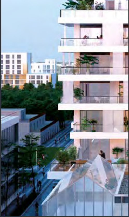
SENSATIONS URBAINES TOULOUSE (31)