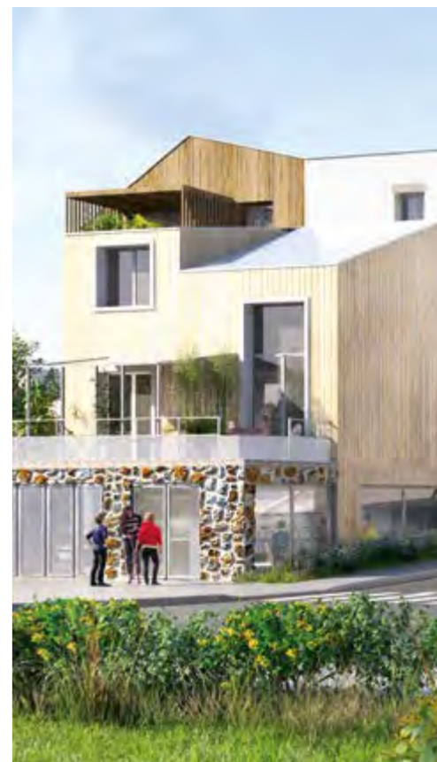
NOISY-LE-GRAND (93) ILOT E