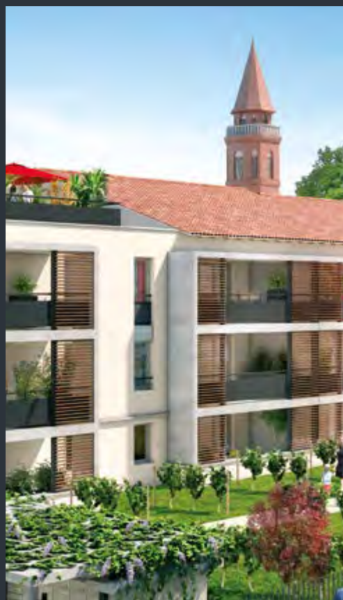
COEUR DE VILLE CASTANET-TOLOSAN (31)