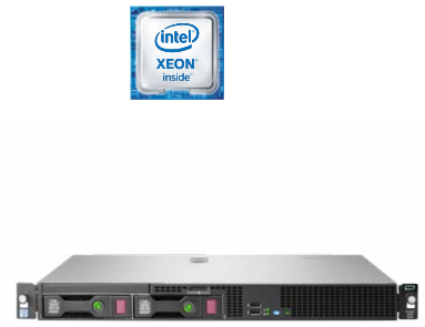
ProLiant DL20 Gen9