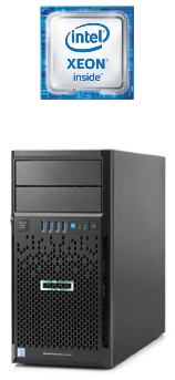
Proiant ML30 Gen9