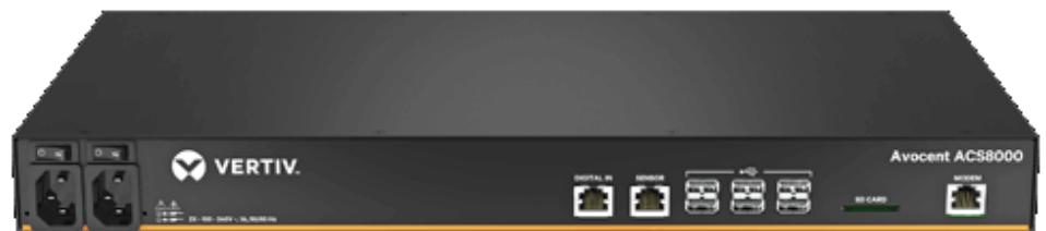
Avocent® ACS8000 Advanced Console Server

Avocent ACS 8000 Advanced Console Server シリーズは、新たに革新的なプラットフォームを採用し、ギガビットファイバーやUSB、センサーなど、重要な新しい通信機能を統合し、これまでの長年にわたる素晴らしい実績を今後とも継続させます。IT 管理者やネットワーク運用センタ (NOC) のスタッフはこれらの新規機能を利用することで、世界中どこからでも安全にリモートデータセンタ管理や IT 資産の帯域外管理を、これまで以上に拡充した内容で実行できるようになりました。拡大されたメモリ機能、アップデートされたLinuxオペレーティング・システムおよび DSView™ 管理ソフトウェアを搭載したデュアルコアARMプロセッサ・アーキテクチャにより、Avocent® ACS 8000 は最適化された性能とセキュリティ、信頼性を備えた高度の帯域外管理ソリューションを提供します。