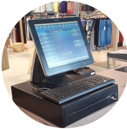
AU FIL DES MARQUES