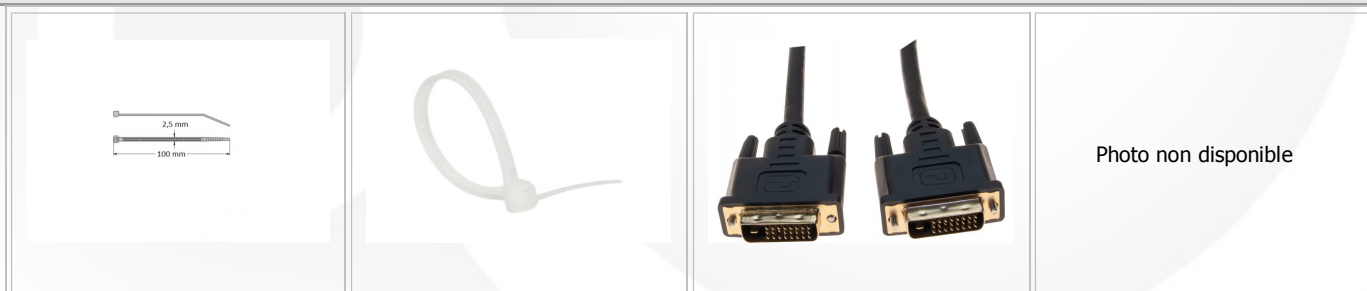
Photo non disponible