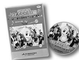
食農教育DVD 「のびのび育む コメルくん体操」

愛称「またきて菜」に決定 食農教育用DVD「私たちのまち“堺のみり”」を制作 東百舌鳥支所新事務所竣工 ALM委員会を母体とした、ALM・リスク管理委員会を設置 食農教育用DVD「私たちのまち“堺のみり”」の教師教材用マニュアル本（ワークシート付）を制作 関西広域連合が展開する「関西エコオフィス宣言事業所」に登録 コミュニティー誌「みんな見て菜」創刊 西陶器支所新事務所竣工 JA堺市イメージキャラクター「コメルくん」誕生 ハーベストの丘農産物直売所「またきて菜」来場者100万人達成 食農教育用DVD「のびのび育む コメルくん体操」を制作