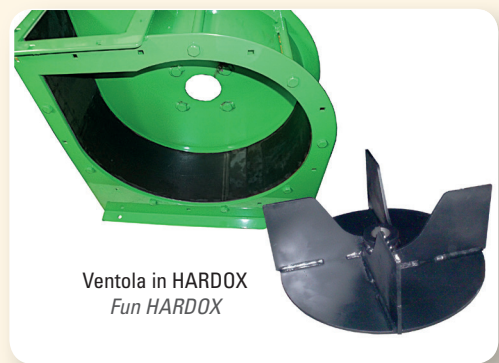
Ventola in HARDOX Fun HARDOX