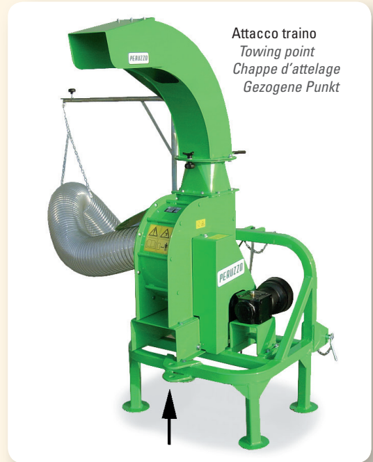
Attacco traino Towing point Chappe d'attelage Gezogene Punkt