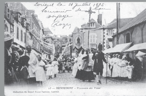
La procession du Vœu en 1905.

C'est au VI e siècle , avec le Gallois Gunthiern, que s'ouvre l'histoire chrétienne à Hennebont. La grotte qui lui aurait servi d'ermitage existe toujours. Non loin de là, au XII e siècle , une chapelle lui est ensuite dédiée. C'est à cette même époque qu'est construite la nef romane de l'église de Saint-Gilles-des-Champs (3). A la fin du XIII e siècle , alors que le duc de Bretagne fortifie la ville, sa femme, Blanche de Navarre, fonde l'abbaye Notre-Dame-de-Joye. Ce sont des moniales cisterciennes qui s'y installent donnant naissance à un pouvoir spirituel et féodal. Dans la Ville-Close, à l'emplacement de l'actuel lycée, le duc Jean IV fonde un couvent de Carmes fin XIV e siècle .