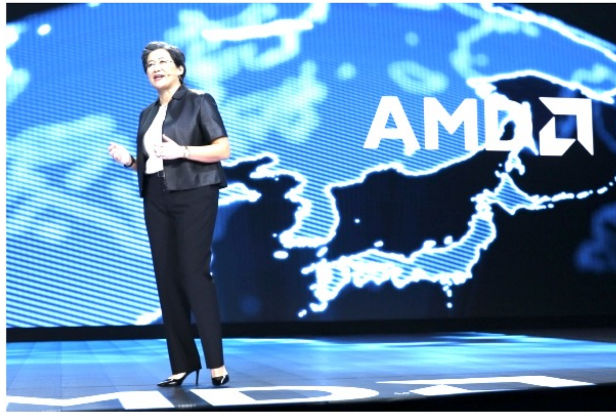
리사 수 AMD CEO (2021.09.28)