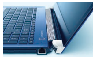
ユーザー側に少し起きているスピーカーグリル。音抜けもよい

新筐体に合わせて、オンキヨーと共同開発したステレオスピーカーを搭載。これに、音楽、映画などコンテンツに応じた臨場感が楽しめる高音質化アプリ「DTS Audio Processing」が加わったサウンドシステム「Dynamic Wide Sound」により、歪みの少ないクリアで安定したサウンドを再現します。また、スピーカーグリルは、グリル孔の形状と並びを工夫して音抜けのよさと上質感を演出。さらに、ユーザー側に少し起き上げるように設計されており、お気に入りの音楽を立体感のある高音質でお楽しみいただけます。