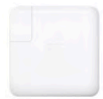
Adaptateur secteur USB-C 61 W