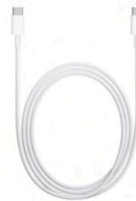
Câble de charge USB-C (2m)