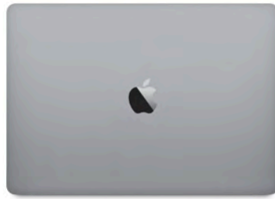
MacBook Pro 13"