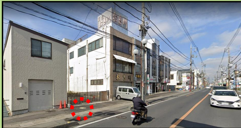
① オケちゃんマンホール (カラー)