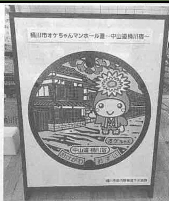
オケちゃんが描かれたマンホール

配布時間午前9時から午後4時まで。問い合わせは同館（048・778・3307）へ。