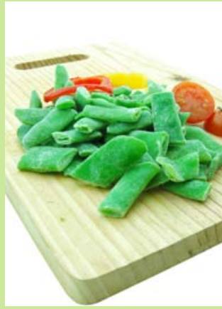
Judía Plana. 120 00101