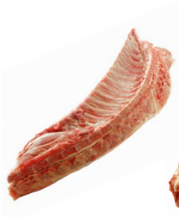
Chuletero Cerdo Tipo Hotel. 112 00102