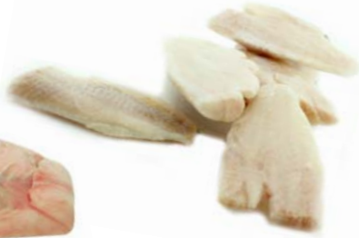
Cabracho Fte. S/Piel. 205 00481