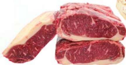
Entrecot Buey Bajo Selección Yerbas Bajas. 111 00451