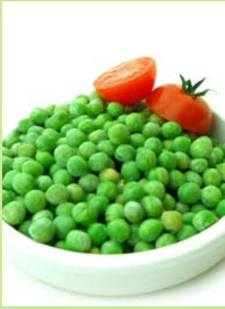
Guisantes. 120 00114