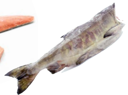
Salmón Entero S/C. 204 00104