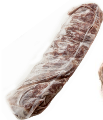
Entrecot Vacuno Iny. 301 00338