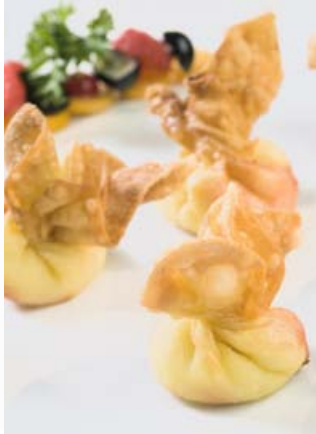
Bombas Queso con Frambuesa. 125 00908