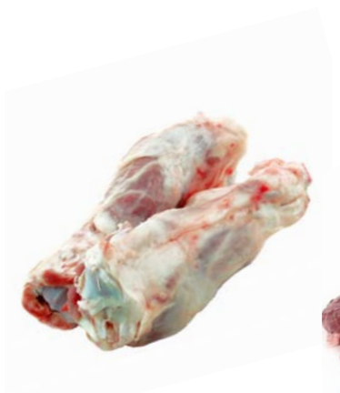
Codillos Cerdo. 112 00136