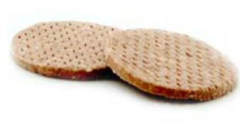
Hamburguesa Vacuno Shops. 232 00514