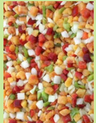
Base Sofrito. 120 00321