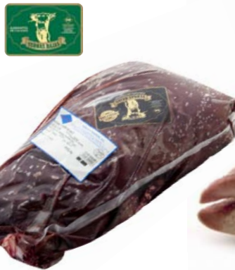
Hígado Ternera Blanca Yervas Bajas. 305 00228