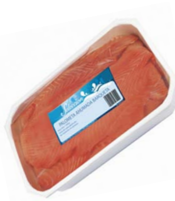
Palometa Ahumada. Tarrina 1 Kg. 125 00936