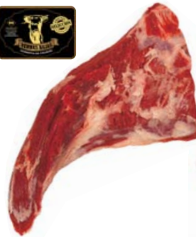
Picaña 'rabillo cadera' Añojo Yervas Bajas. 110 00350