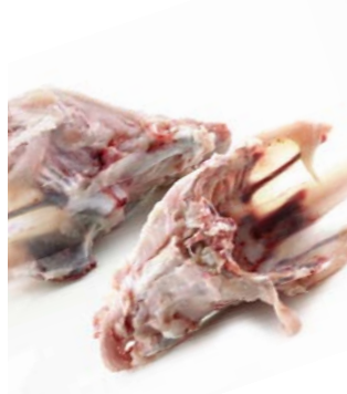
Carcasa Pollo Cong. 100 00103