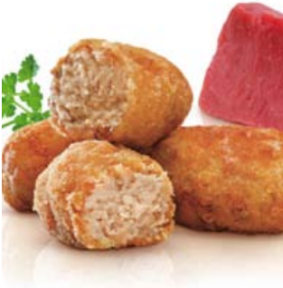
Croquetas Mesón Cocido: 231 00604 Jamón Ibérico: 231 00606 Setas y Boletus: 231 00608 Atún y Piquillo: 231 00626 Brandada Bacalao: 231 00602