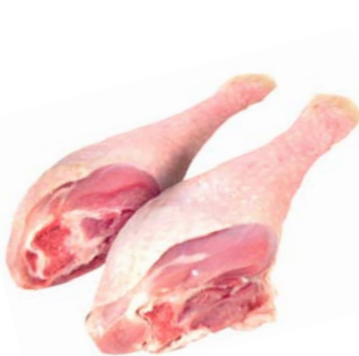
Jamoncito Pavo Cong. 100 00152