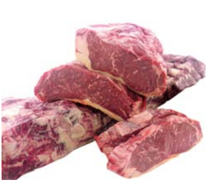
Entrecot Bajo Imp. 300 00175