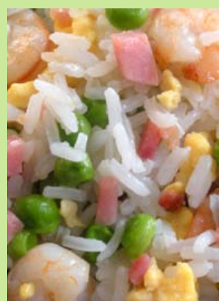
Arroz Tres Delicias. 120 00120