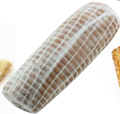
Roti Pavo. 232 00130 Roti Pavo Colectividad. 232 00330