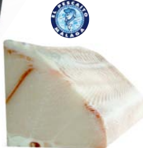
Cazón Lomo El Pescaíto. 203 00110