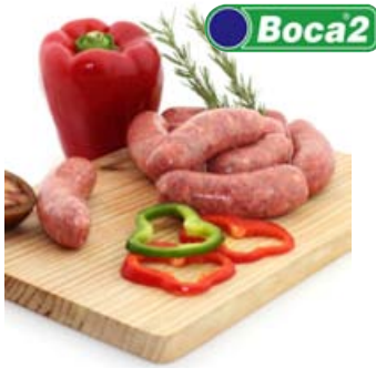
Chorizo Criollo Boca2. 113 00108