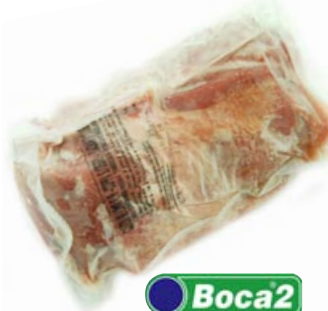
Cinta Lomo Filete Boca2. 302 00309