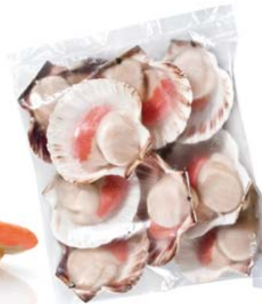
Vieira M/Concha 8/12. 133 00126