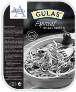
Gulas 250gr. 205 00633