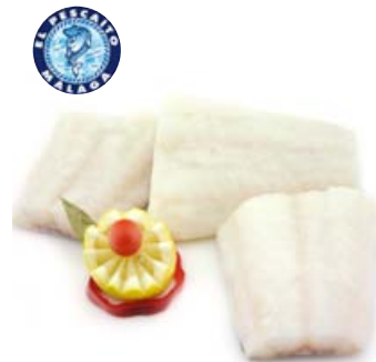
Bacalao Centro Supremo El Pescaito. 200 00161