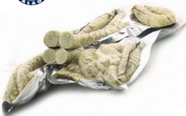
Hueva Merluza Cocida 'El Pescaito' 125 00889