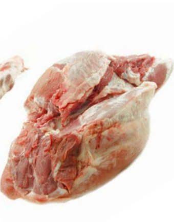
Jamón Cerdo Deshuesado, con los huesos. 112 00206