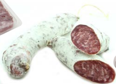
Salchichón de Málaga. 240 00352