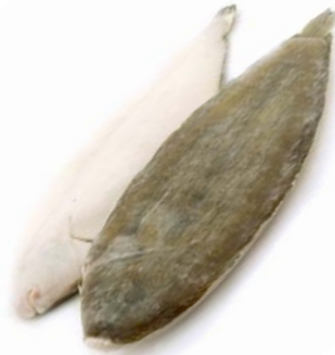
Lenguado Holandés N2: 170 00110 N3: 170 00108