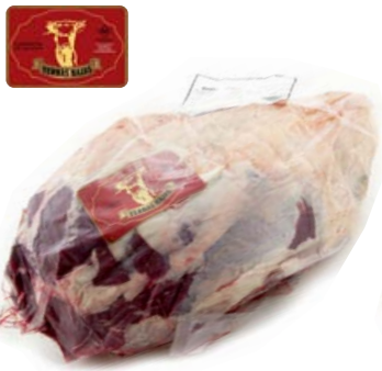
Babilla Vaca Gallega Yerbos Bajos. 111 00502