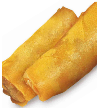
Rollitos Primavera. 231 00102