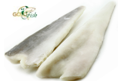
Bacalao Fte. Gold Fish. +1000: 200 00173. 500/1000: 200 00163