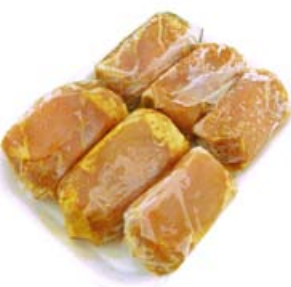
Churrasco Pollo Aliñado Boca2 230 00111