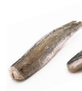
Merluza N4 Argent. 150 00123