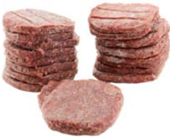
Hamburguesa Buey Brasas Yerbas Bajas. 230 00421