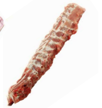
Costilla Corbata Cerdo. 112 00111