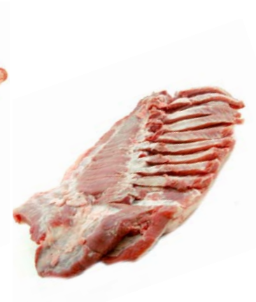
Panceta Simple Cerdo. 112 00129