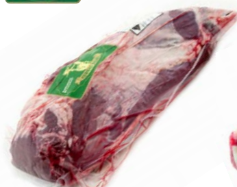
Contra Añojo Yervas Bajas. 110 00306