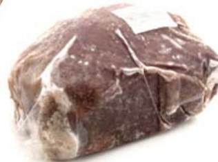
Babilla Vacuno Iny. 301 00502