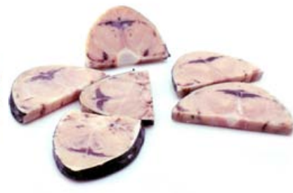
Pez Espada Fte. Segunda. 202 00118