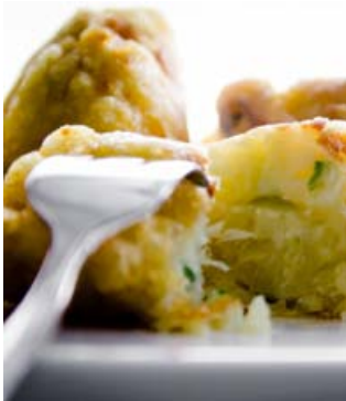
Buñuelo Bacalao. 232 00129