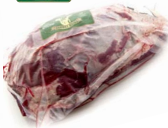
Babilla Añojo Yervas Bajas. 110 00304