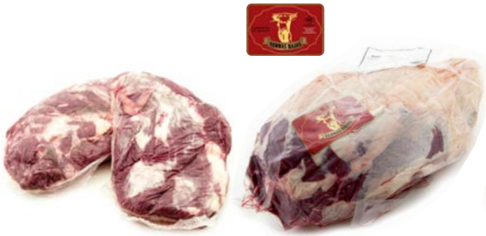
Tenera para Guiso. 110 00317