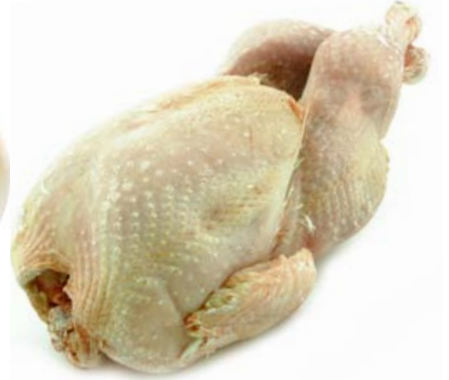
Pavo Canal Cong. 100 00115