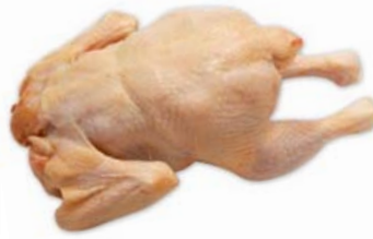
Gallina Pesada Fresca. 101 00231