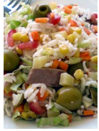
Ensalada Arroz. 120 00134