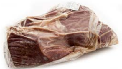
Contra Vacuno Iny. 301 00533