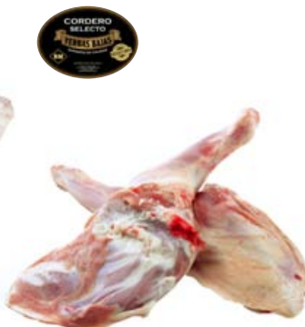
Paletilla Cordero Lechal Yervas Bajas. 114 00603