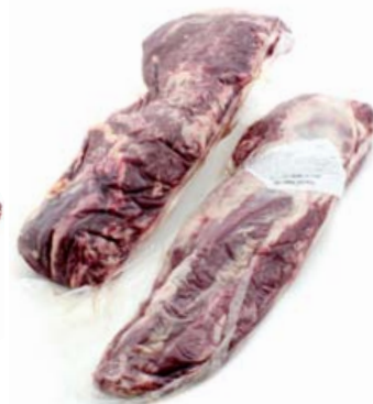
Solomillo Buey Imp. +2,3: 111 00338 +2,5: 111 00401 +2,7: 111 00452