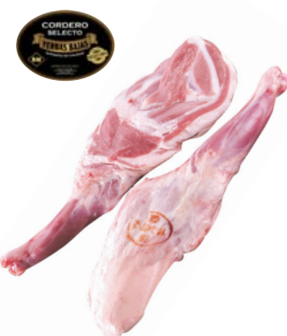
Paletilla Cordero Recental Yervas Bajas. 114 00703