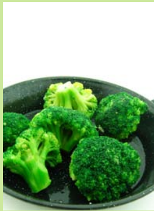
Brocolí. 120 00122