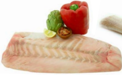
Perca Fte. 500/1000. 205 00186