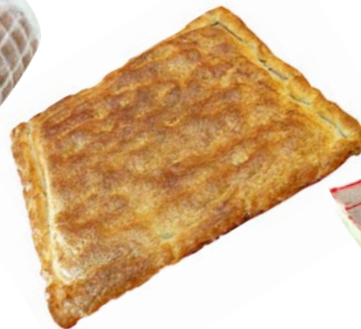
Empanada Atún. 235 00351