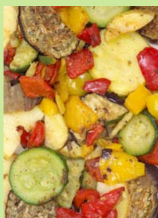
Braseado Campestre. 120 00320