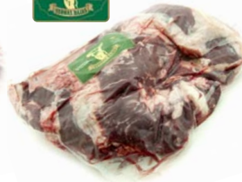
Cadera Añojo Yervas Bajas. 110 00305