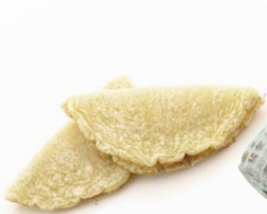
Tortilla Francesa. 233 00350