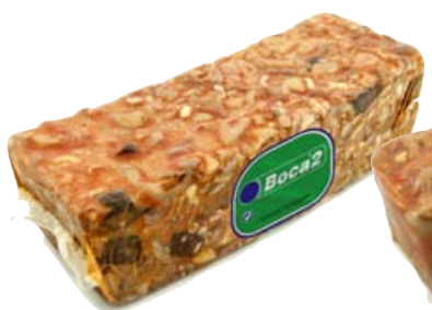
Callos Cerdo Barra Boca2. 240 00150