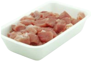
Magro Cerdo Trozo. 112 00106