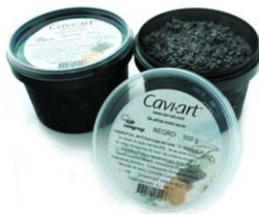
Sucedáneo Caviar Negro 'algas', 500 gr. 125 00925