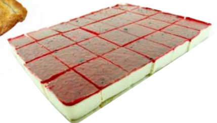
Tarta Queso y Arándanos. 238 00108