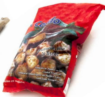
Rejo Cocido y Troceado. 172 00176