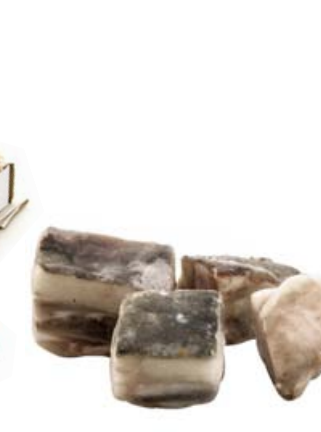
Rape Cabeza Cort. 152 00142