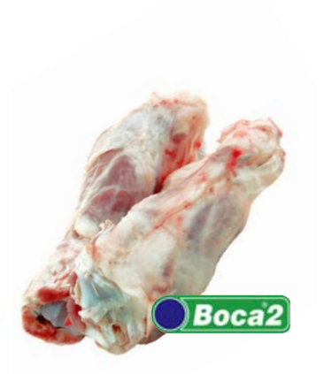
Codillo Cerdo Boca2. 302 00121