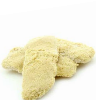
Pechuga Pollo Fte. Empanada. 232 00138