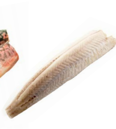
Rosada Deshuesada. 151 00107