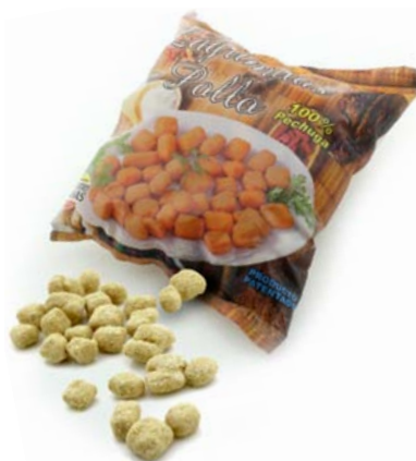
Lagrimitas de Pollo. 232 00192