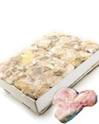
Rape Carrillada. 152 00152