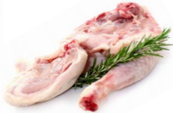
Muslo Pollo Fresco. 101 00165