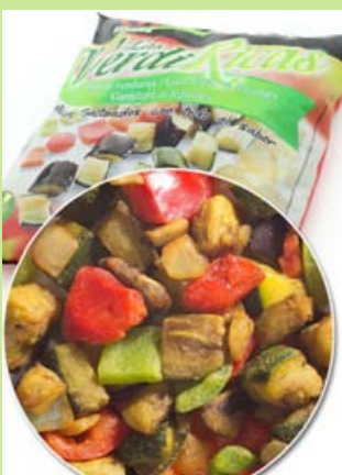
Pisto Verduras Prefritas. 120 00304