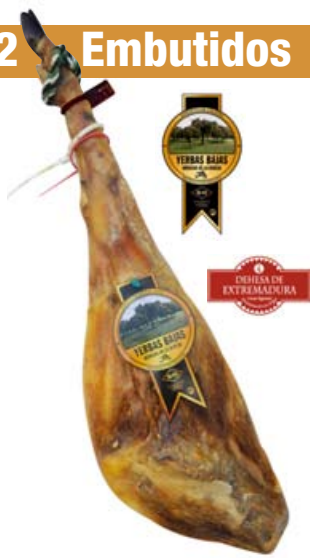
Jamón Bellota 100% Ibérico Yervas Bajas D.O. Extremadura. 240 00765