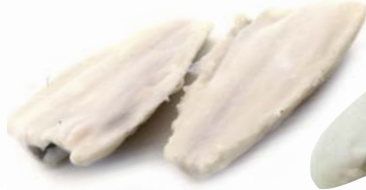
Platija Limpia A Bordo. 170 00177 RyM: 170 00169