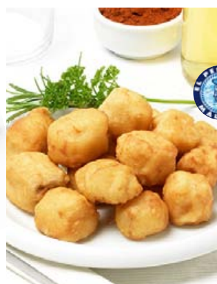
Adobo Enharinado 'El Pescaito'. 232 00439