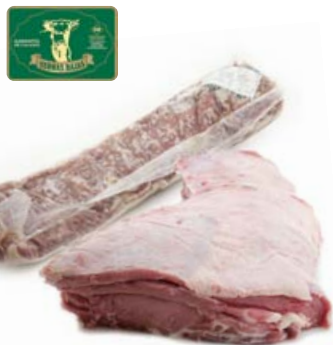
Entrecot Ternera Blanca Yervas Bajas. 305 00161