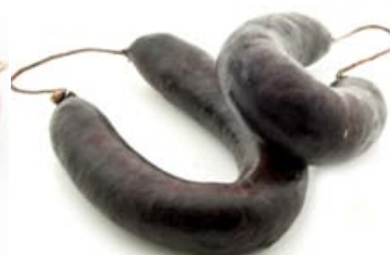
Morcilla Casera. 240 00138 Morcilla Cebolla. 240 00147