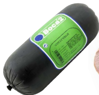
Mortadela Siciliana Boca2. 240 00158