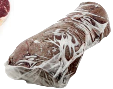
Hígado Añejo. 300 00118