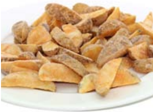
Patatas de Luxe. 234 00145