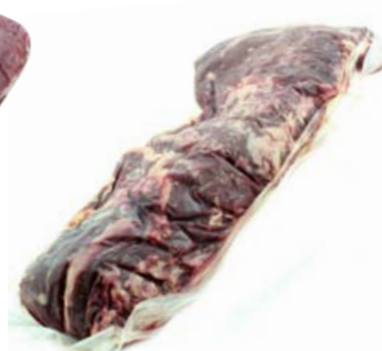
Solomillo Buey Imp. +2 kg. 301 00130 +2'3 kg. 301 00137 +2'7 kg. 301 00461