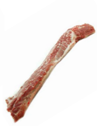
Cinta Lomo C/Cabeza. 112 00139