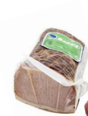
Lomo Sajonia Boca2. 240 00106