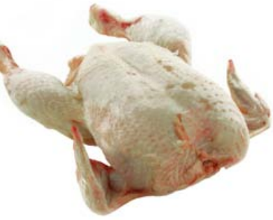
Pollo Cong. 100 00314