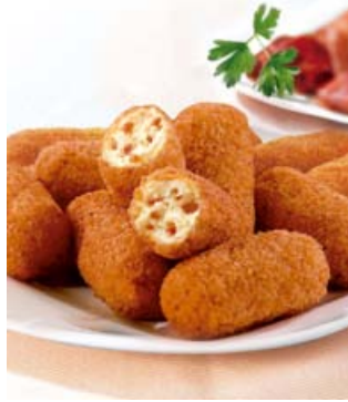
Croquetas Abuela Pollo: 231 00195 Jamón: 231 00194