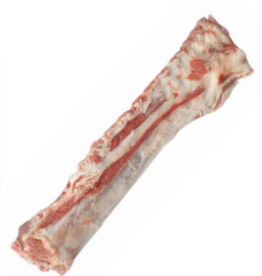
Chuletero 100% Ibérico. 303 00132