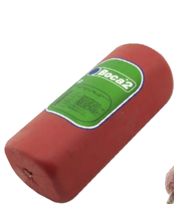
Chopped Pavo Boca2. 240 00153