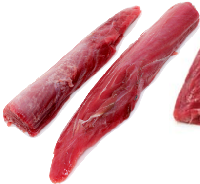
Morrillo de Atún. 710 00148