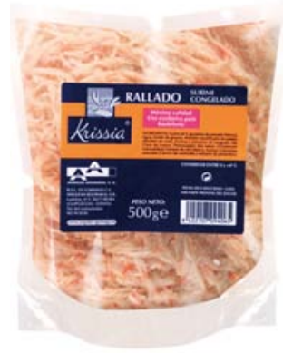
Rallado Krissia 500gr. 205 00634