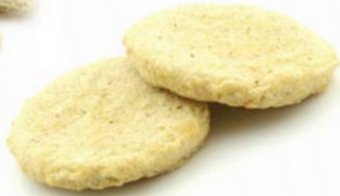
Filete Ruso. 232 00560