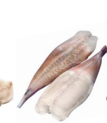
Rape Chino 200/300. 152 00160