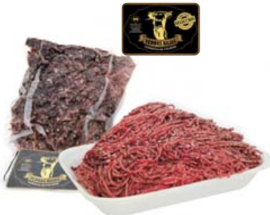
Picada Buey Madurado Yerbos Bajos 111 00100