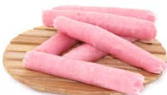
Salchicha Pollo Boca2 230 00109