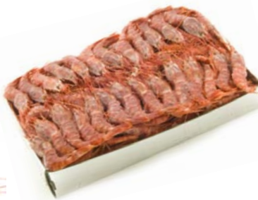
Camarón Rojo Salsas. 130 00110