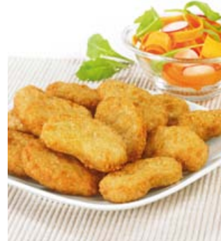
Nuggets Pollo Prielá. 231 00196 Nuggets Pollo Price: 231 00224