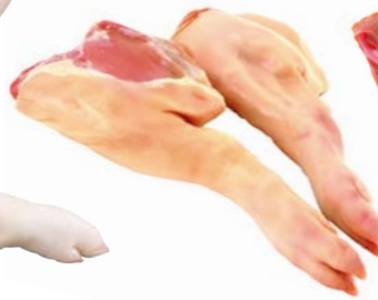
Pierna Cochinillo Yervas Bajas 302 00147