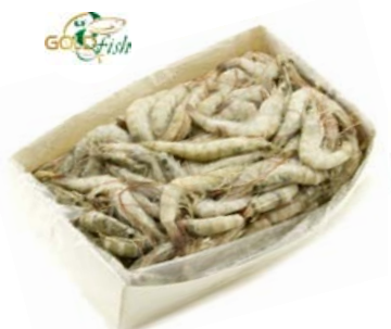
Langostino Gold Fish 2 Kg. 40/50: 131 00197. 50/60: 131 00198 60/70: 131 00190. 70/80: 131 00149