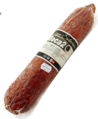
Chorizo Selección Boca2. 240 00107