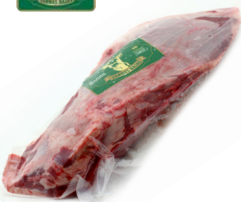
Redondo Añojo Yervas Bajas. 110 00307