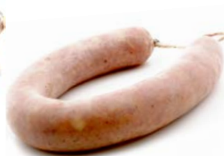
Butifarra RyM. 240 00185