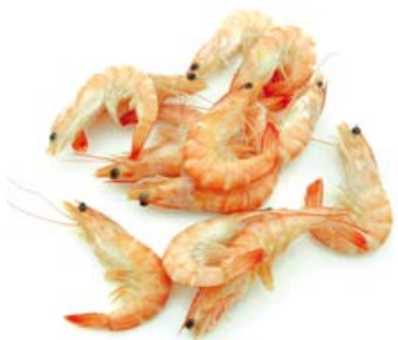
Langostinos Cocidos G 40/60: 131 00181 M 60/80: 131 00179