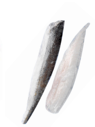
Merluza Fte. C/P Nacional 150 00232