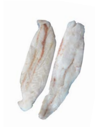
Merluza Fte. S/P 4/6. 150 00220