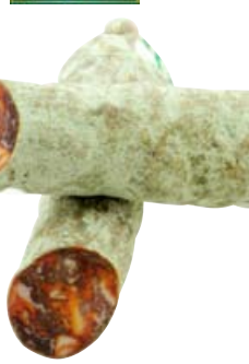
Chorizo 100% Ibérico Yervas Bajas. 240 00302