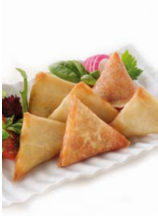
Samosa Cebolla Caramelizada y Avellanas. 125 00905