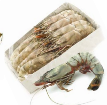
Langostino Yumbo B-0, 8-10 131 00120