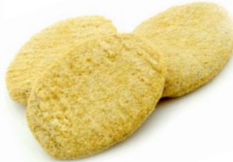
Empanado de Pollo. 232 00109 De Cerdo. 232 00106 Empanado de Ternera. 232 00308