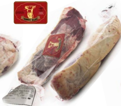
Redondo Vaca Gallega Yervas Bajas. 301 00537