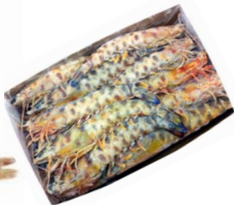
Langostino Tigre N°1 10/20 131 00148