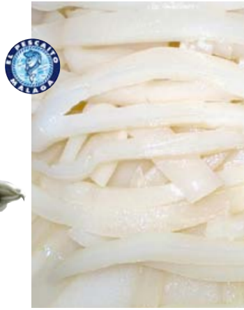
Jibia Tiras 'El Pescaíto'. 172 00189