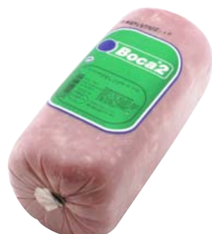
Fiambre Paleta 11x11 Boca2. 240 00131