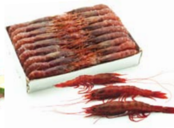
Carabinero 'Brillante' A Bordo B3: 131 00355 B5: 131 00193