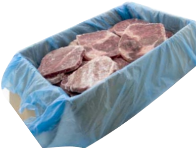
Ternera Bistec. 300 00179