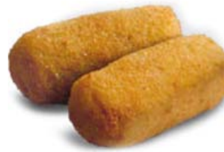
Croquetas Price Sabor Pollo: 231 00122 Jamón: 231 00322 Bacalao: 231 00615 Minicroquetas jamón: 231 00127