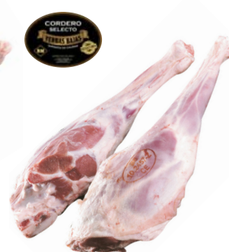
Pierna Cordero Recental Yervas Bajas. 114 00704