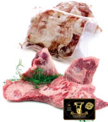
Secreto 100% Ibérico Selección Yervas Bajas. 303 00142