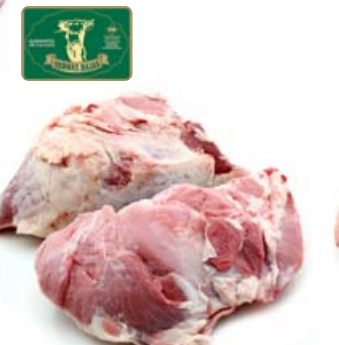
Tapa Ternera Blanca Yervas Bajas. 305 00156