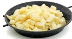
Patatas Bravas. 234 00108