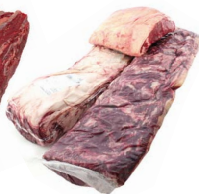
Entrecot Buey Bajo Imp. +6: 111 00404. +7: 111 00402 +8: 111 00300