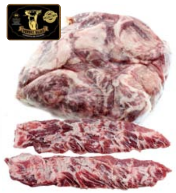
Pluma 100% Ibérica Selección Yervas Bajas. 303 00171