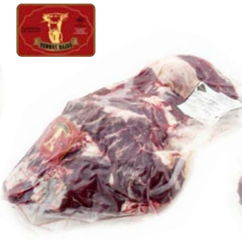
Cadera Vaca Gallega Yerbos Bajos 111 00503