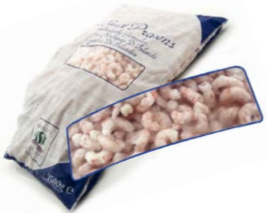
Gambas Peladas y Cocidas 150/250. 130 00108