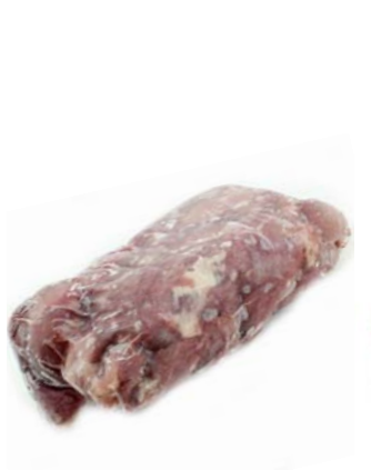
Solomillo Cerdo Puntas Limpias. 302 00200