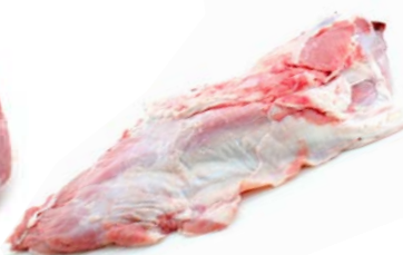
Contra Ternera Blanca. 110 00754