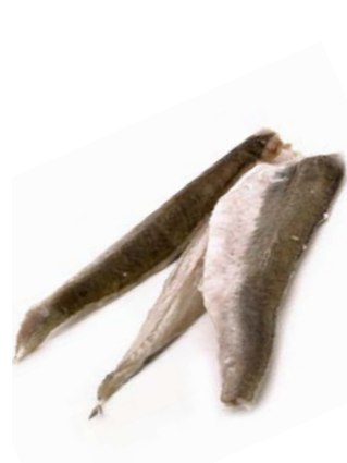
Merluza Fte. C/P N4. 150 00120