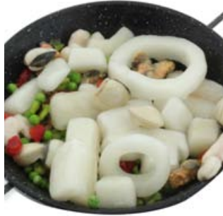
Preparado Paella con verduras. 120 00141