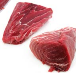
Mormo de Atún. 710 00141