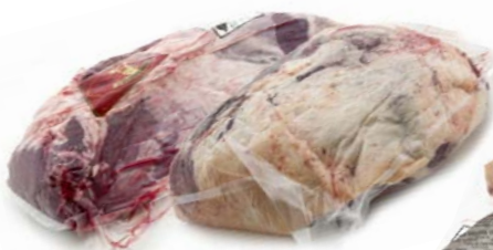
Tapa Vaca Gallega Yervas Bajas. 301 00536