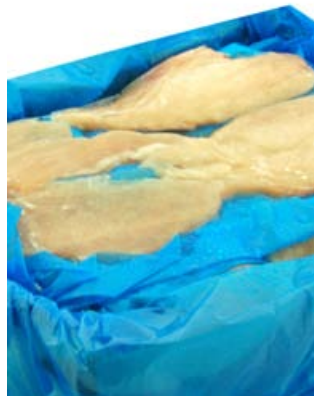
Pechuga Pollo Fte. Cong. 100 00151