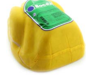
Pechuga Pavo Cocida Boca2. 240 00149