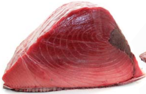
Lomo atún. 710 00146