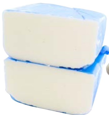
Manteca Ibérica Fundida. 240 00120