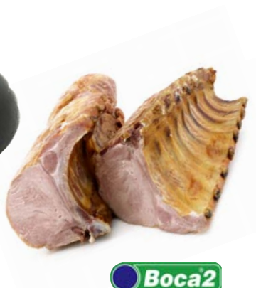
Chuleta Sajonia Ahumada Boca2. 240 00103