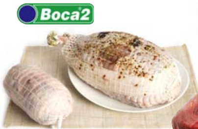
Pavo Relleno Boca2 113 00173