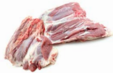
Jarrete Ternera Blanca Yervas Bajas. 305 00499