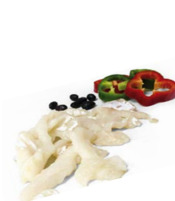
Bacalao Salado desmigado tiras. 125 00200