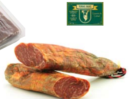
Lomo 100% Ibérico Yervas Bajas. 240 00101