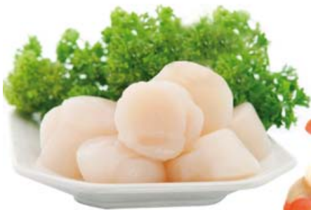
Vieira Carne Gourmet. 133 00828