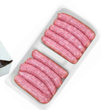
Salchicha Cerdo. 230 00380