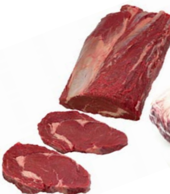
Entrecot Cuberoll 'Rib-Eye'. 110 00422