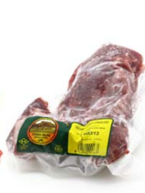
Solomillo 100% Ibérico 'La Dehesa'. 303 00623