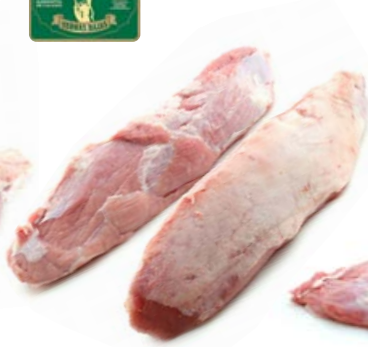
Redondo Ternera Blanca Yervas Bajas. 305 00231