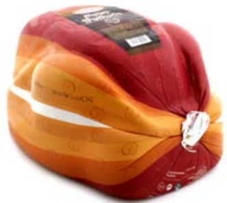
Pechuga Pavo Trufada. 240 00598