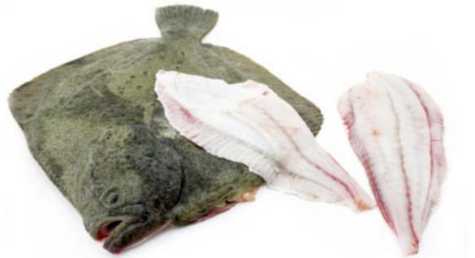
Rodaballo Salvaje en filetes