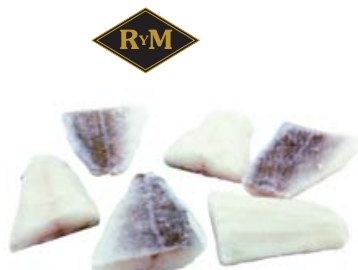
Bacalao Cola RyM. 200 00143