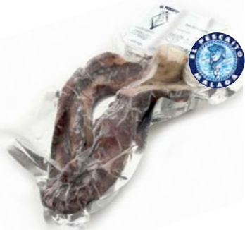
Pulpo Pata Cocida 'El Pescaíto'. 173 00377. Pulpo Cabezas Cocidas: 173 00378