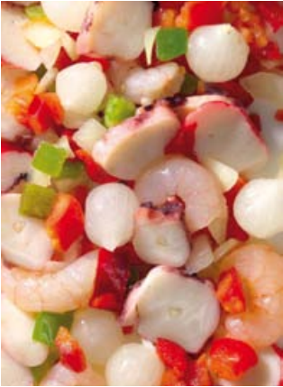
Salpicón Marisco. 120 00316