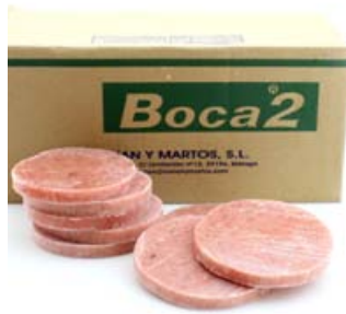
Hamburguesa Pollo 120 gr. Boca2 230 00505