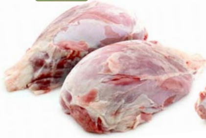
Babilla Ternera Blanca Yervas Bajas. 305 00230