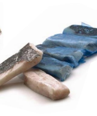
Merluza Lomo 200/300 C/P Namibia: 150 00514. 75/120: 150 00710