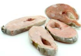
Salmón Rodajas. 204 00105