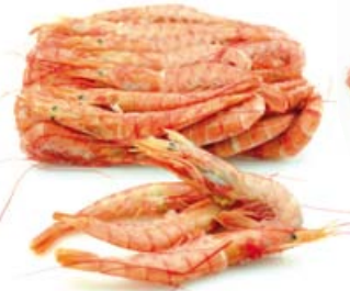
Gambón N2 20-30 A Bordo. 130 00192