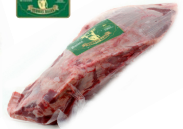
Redondo Añojo Yervas Bajas. 300 00144