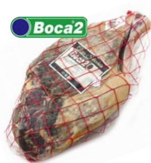
Jamón Serrano s/h Boca2. 240 00161