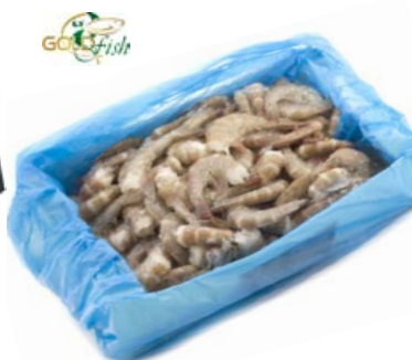
Colas Langostinos Gold Fish 26/30: 131 00230. 31/35: 131 00123. 36/40: 131 00103. 41/50: 131 00171. 51/60: 131 00174