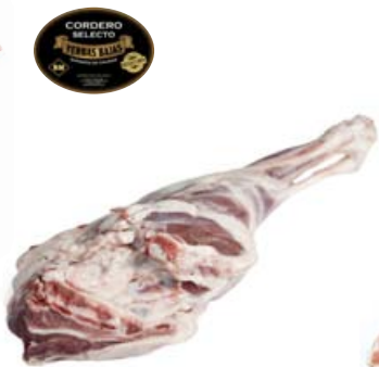
Pierna Cordero Lechal Yervas Bajas 114 00604