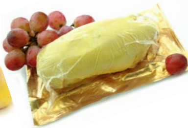
Foie Desvenado Extra Yervas Bajas. 125 00311