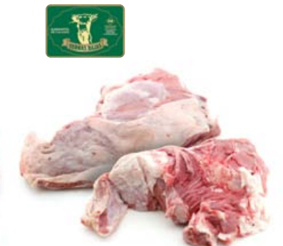
Cadera Ternera Blanca Yervas Bajas. 305 00229