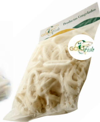
Anillas Gold Fish. 172 00128