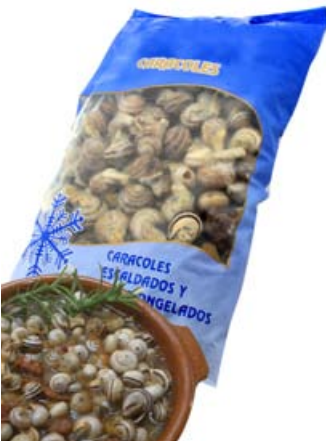
Caracol Precocido. 232 00139