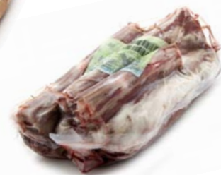
Rabos Añojo Extra. 300 00131