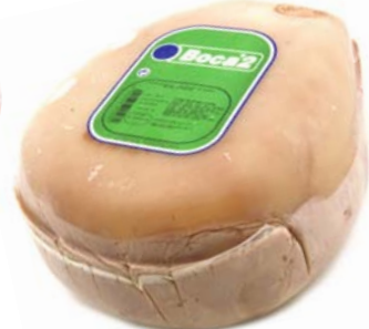
Jamón Cocido Extra Guitarra Boca2. 240 00175