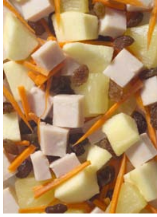
Ensalada Pollo. 120 00312