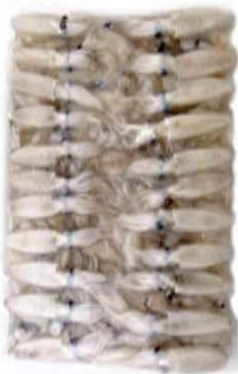
Puntilla China. 171 00138