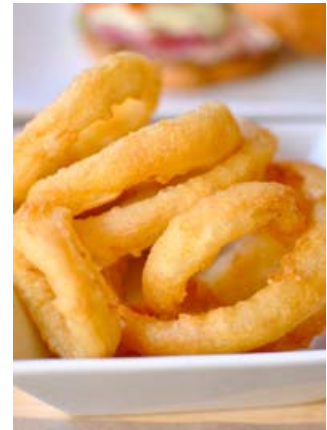
Aros de Cebolla. 231 00133