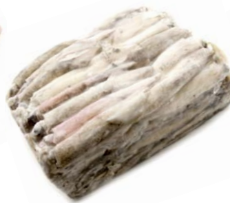
Calamar Patagónico N4L. 171 00111 Calamar California 11-13 cm. 171 00129 Calamar N°4 suelto RyM. 171 00146