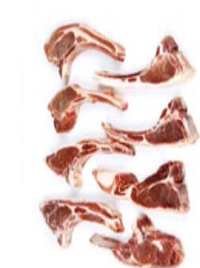
Chuleta de Ovino Extra. 304 00140