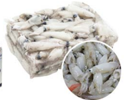
Puntilla Nacional. 171 00137