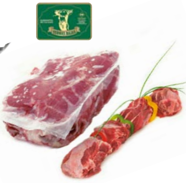
Carrillada 100% Ibérica Yervas Bajas 303 00114