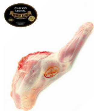
Paletilla Chivo Yervas Bajas 114 00680