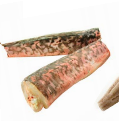
Rosada Namibia/Sudáfrica A Bordo.