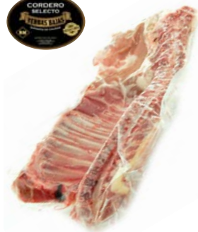
Carré Cordero Recental Yervas Bajas 304 00702