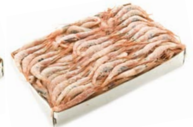
Cameron Real, Quisquilla. 130 00413