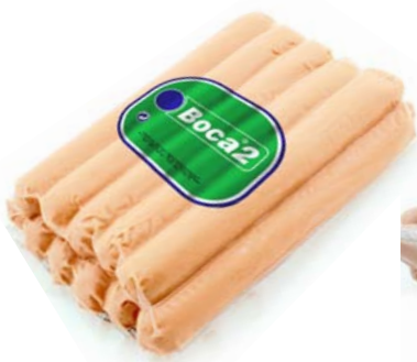
Salchicha Pollo y Pavo Boca2. 240 00762