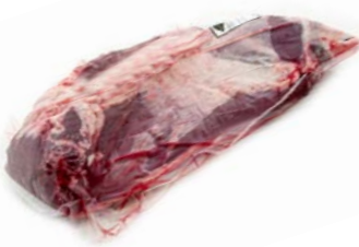
Contra Añojo. 300 00231