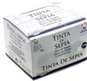
Tinta Calamar. 171 00172