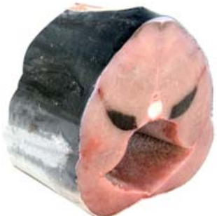
Marrajo Centro. 203 00237