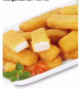
Varitas Merluza Prielá. 231 00253 Price. 231 00151