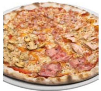
Pizza 4 Estaciones. 231 00700 Atún y Cebolla. 231 00704 Jamón y Champiñones. 231 00702 Margarita. 231 00703