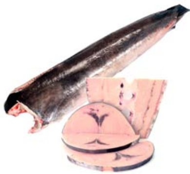
Pez Espada Entero. 202 00115