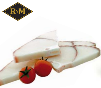
Cazón Fte. RyM. 203 00262 Cazón Fte. S/H RyM. 203 00298