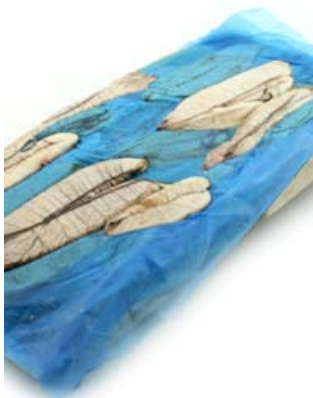
Bacalao Huevas. 200 00242