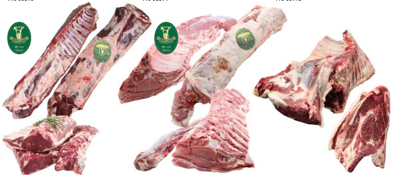
Lomo Ternera c/s Yervas Bajas 110 00815