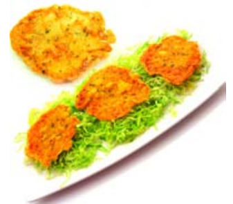
Tortillitas de Camarón 'El Pescaito' 232 00136