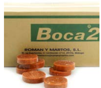
Hamburguesa Mini Chorizo Boca2 230 00511