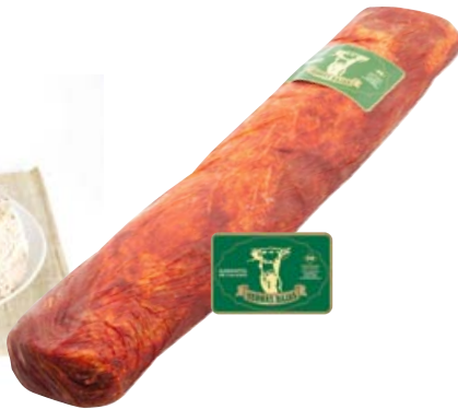
Lomo Adobado P. de la Vera Yervas Bajas. 113 00200