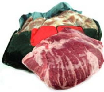
Presa Duroc. 303 00101