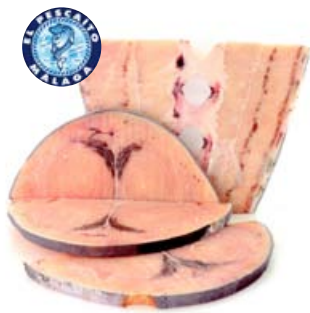
Pez Espada Centro Extra El Pescaíto. 202 00116