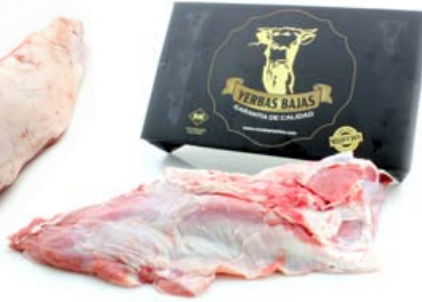
Contra Ternera Blanca Yervas Bajas. 305 00550