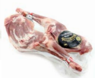
Paletilla Cordero Lechal Yervas Bajas 304 00100