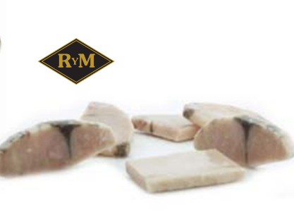
Pez Vela 200 00347