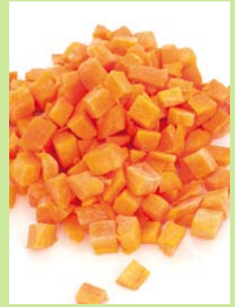
Zanahoria Dado. 120 00121