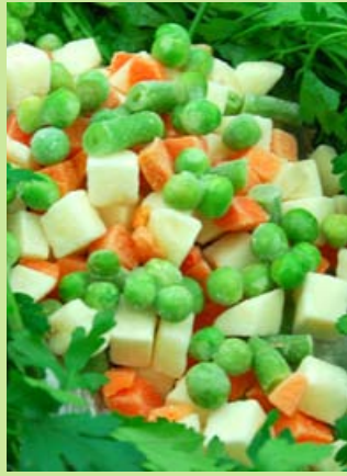
Ensaladilla. 120 00107