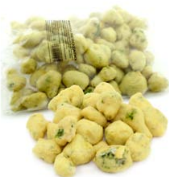
Brócoli Rebozado. 232 00220