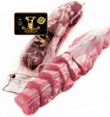
Solomillo Ternera Selección Yervas Bajas. 110 00331