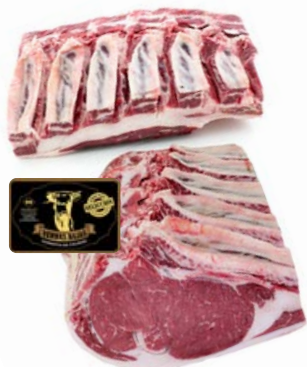
Entrecot Añojo Alto Selección Yerbas Bajas. 110 00802