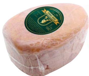
Jamón Cocido Yerbas Bajas. 240 00223