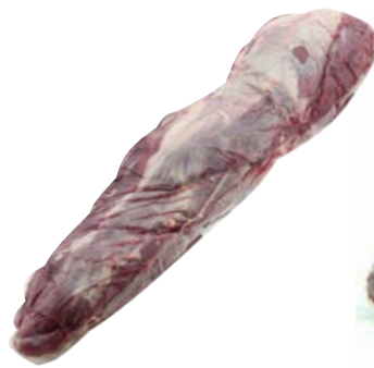
Solomillo Añojo Nac. 300 00505