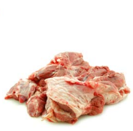
Paleta Cerdo Deshuesada, con los huesos. 112 00205