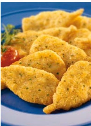
Bocarte Rebozado. 231 00117