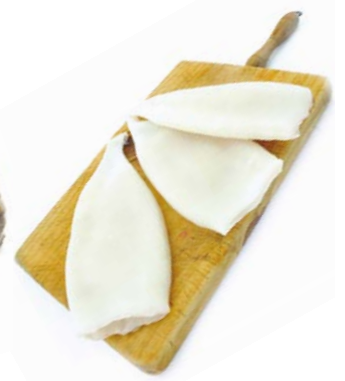
Pota Tubo Illex. 172 00122