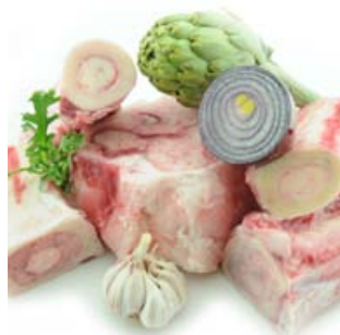
Huesos Ternera 'Tuétanos' cortados. 300 00650