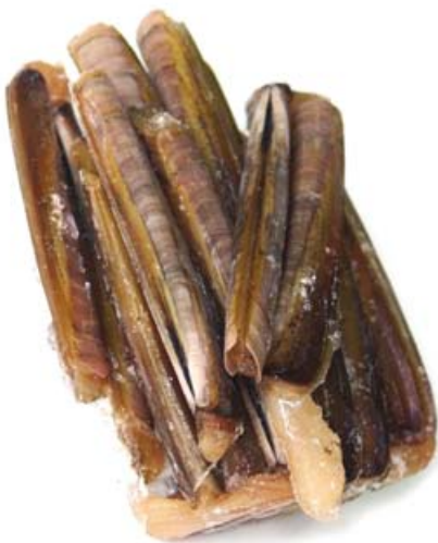
Navaja G: 133 00813