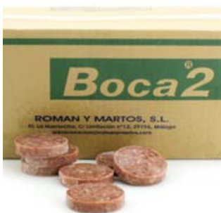
Hamburguesa Mini Ternera Boca2 230 00512