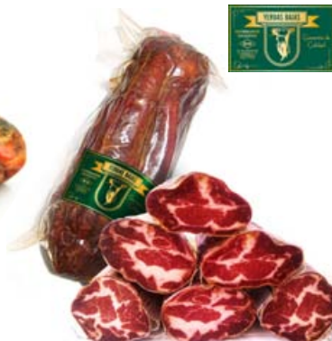
Lomito Embuchado Yervas Bajas. 240 00129