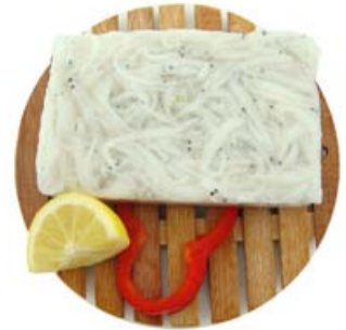
Chanquete 5/7, Pez Platino 205 00136