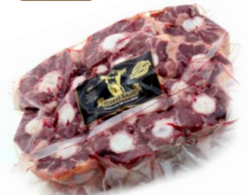
Rabo Añojo Cortado Yervas Bajas. 300 00432