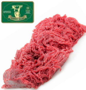
Picada Añejo Yerbos Bajos. 110 00309