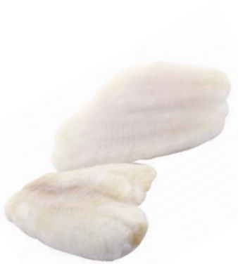
Halibut Fte. S/P 500/800. 205 00187