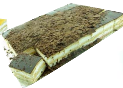
Tarta Selva Negra. 238 00112 Tarta 3 Chocolates. 238 00116