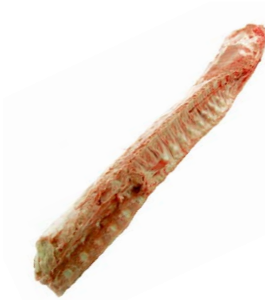
Chuletero Cerdo. 302 00117