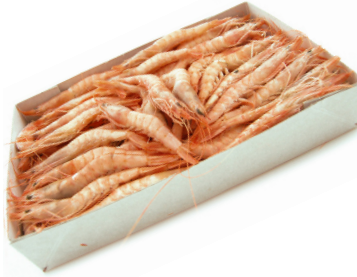
Gamba Griega N1, 60/90: 130 00291 N2, 90/120: 130 00292 N3, 120/150: 130 00293