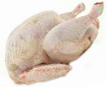
Pavo Fresco. 101 00116