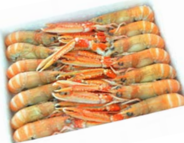
Cigalas N.O. 132 00310 N.00: 132 00156. N.1: 132 00158 N.2: 132 00407. N.3: 132 00311 N.4: 132 00154