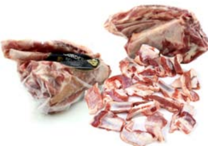
Cordero Estofado. 304 00176