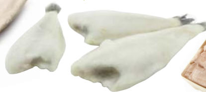
Peluda Limpia RyM. 170 00106