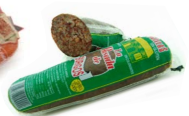
Morcilla de Arroz. 240 00715