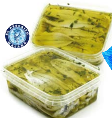
Boquerón en Vinagre 280 gr. 'El Pescaito' 125 00351