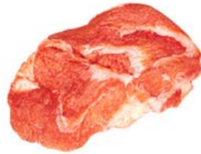
Carrillada Ternera Blanca Yervas Bajas. 305 00413