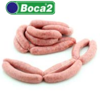
Salchicha Pollo Boca2 113 00120