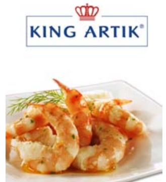
Colas Langostino al ajillo 125 gr. 205 00637