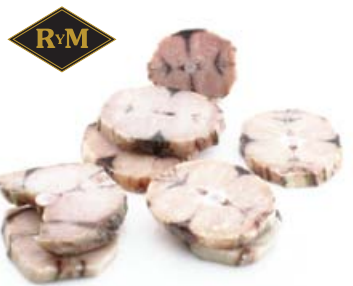
Emperador Fte. RyM. 203 00751