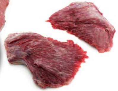
Carrillera Atún. 710 00145