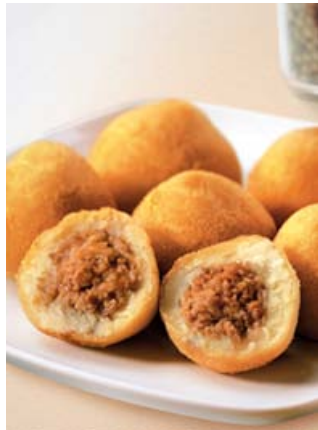
Patatas rellenas Prielá. 231 00193