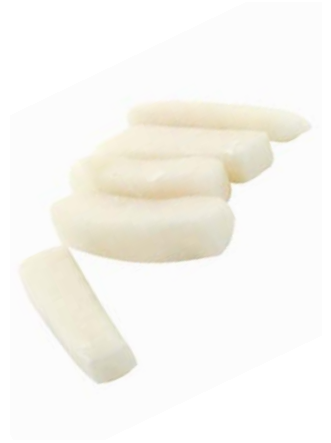
Choco Tira 'Potón'. 172 00136