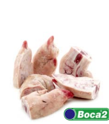
Mano Cerdo Cort. Boca2. 302 00314