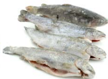
Trucha Limpia. 205 00103