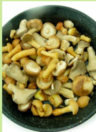
Cóctel Setas con Boletus. 120 00300