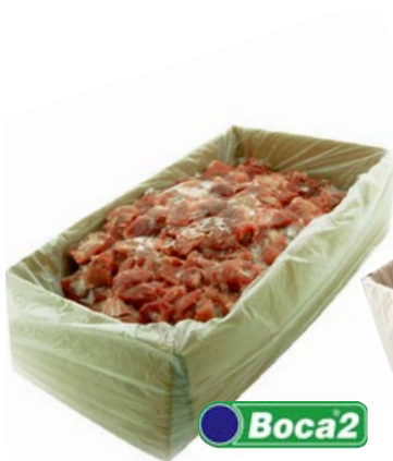
Magro Cerdo Boca2. 302 00406