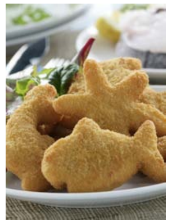
Figuritas Merluza. 231 00360