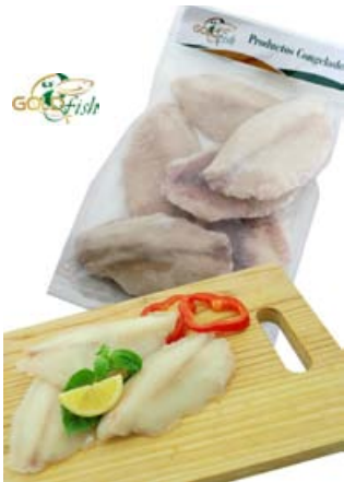
Tilapia Fte. Gold Fish. 5/7 oz: 205 00200. 3/5 oz: 205 00210