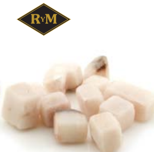
Cazón Taquito RyM. 203 00132