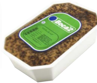
Patés Boca2 A la Pimienta: 240 00113 A las Finas Hierbas: 240 00116 De la Campaña: 240 00114