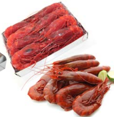
Carabinero 'Brillante' B-0 A Bordo: 131 00183 B-1 A Bordo: 131 00105