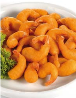
Gambas Rebozadas Prielá. 23100186 Gambas Rebozadas. 231 00124