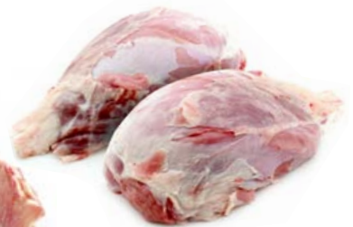
Babilla Ternera Blanca. 110 00780