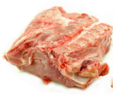
Cabezal Cerdo C/H. 112 00108