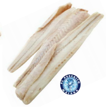
Rosada Fte. G Brillo 'El Pescaíto'. 151 00357