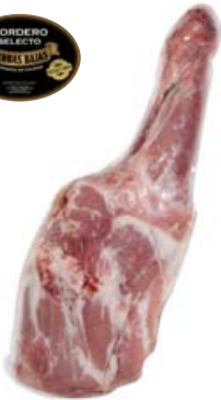
Paletilla Cordero Recental Yervas Bajas. 304 00241