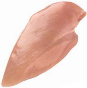
Pechuga Pollo Fresca. 101 00164