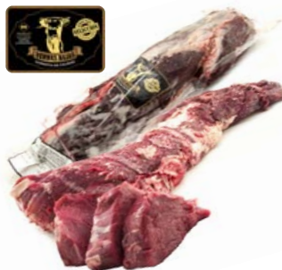
Solomillo Buey Selección Yerbas Bajas. 111 00400