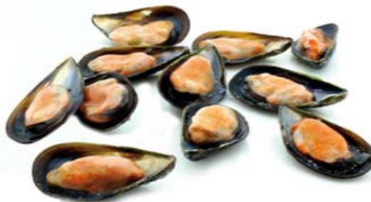
Mejillón m/concha 40/60 Súper. 133 00842