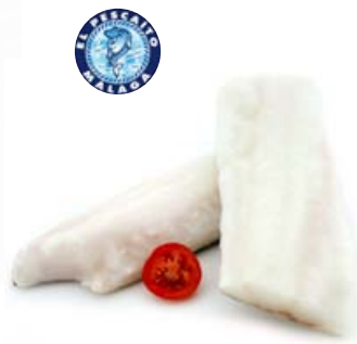
Bacalao Lomo Yumbo S/E El Pescaito. 200 00273