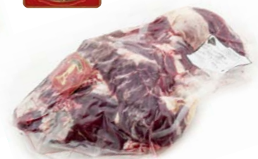
Cadera Vaca Gallega Yervas Bajas. 301 00535