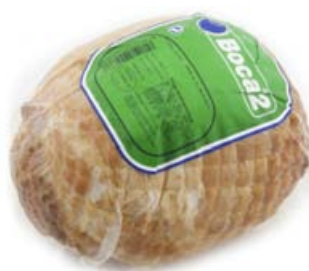
Pollo Relleno Extra Boca2. 240 00337