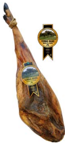
Jamón Bellota 100% Ibérico Yervas Bajas. 240 00255