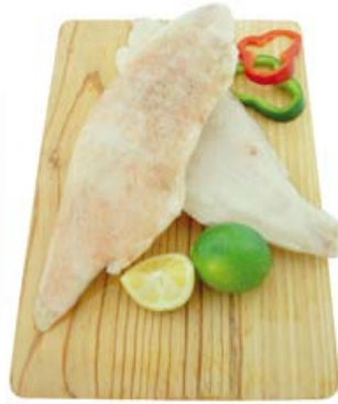
Gallineta Fte. 205 00263