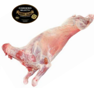
Cordero Recental Yervas Bajas 114 00700