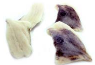
San Pedro Fte. +200. 205 00250