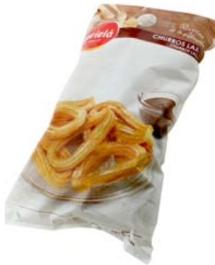
Churros Prielá. 231 00820 Churros 'Lazo'. 232 00120