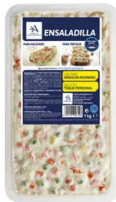
Ensaladilla 'Gourmet', Kg. 125 00850