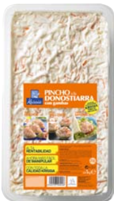
Pintxo Donostia, Kg. 125 00840