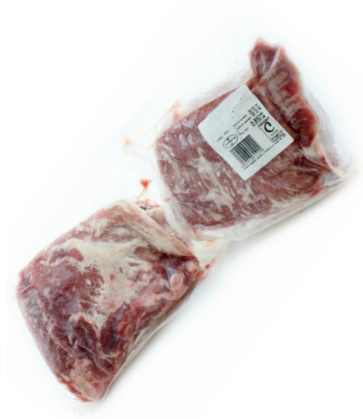
Secreto 100% Ibérico. 303 00242