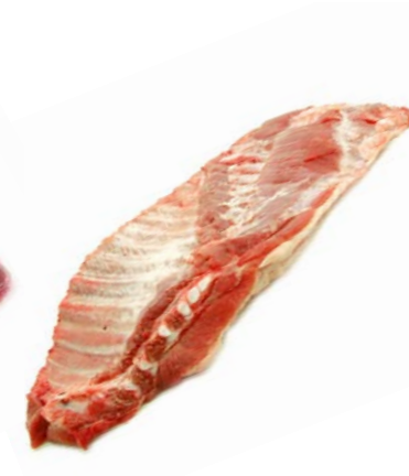
Costilla Cerdo c/Carne. 112 00109