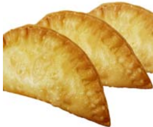
Empanadillas Price. 231 00123 Miniempanadillas. 231 00126