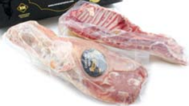
Carré Cordero Lechal Yervas Bajas 304 00168