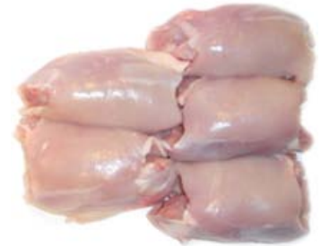
Churrasco Pollo Fresco. 101 00105