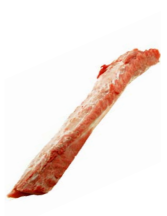
Cinta Lomo S/Cabeza. 112 00107