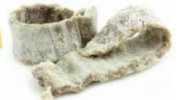
Costillas Saladas. 240 00506