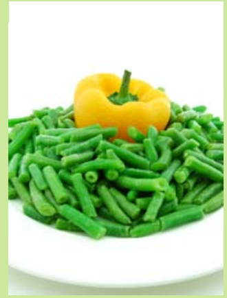
Judía Redonda. 120 00112