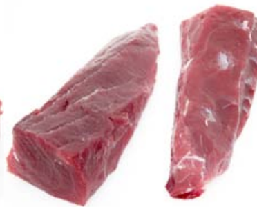
Solomillo de Atún. 710 00142