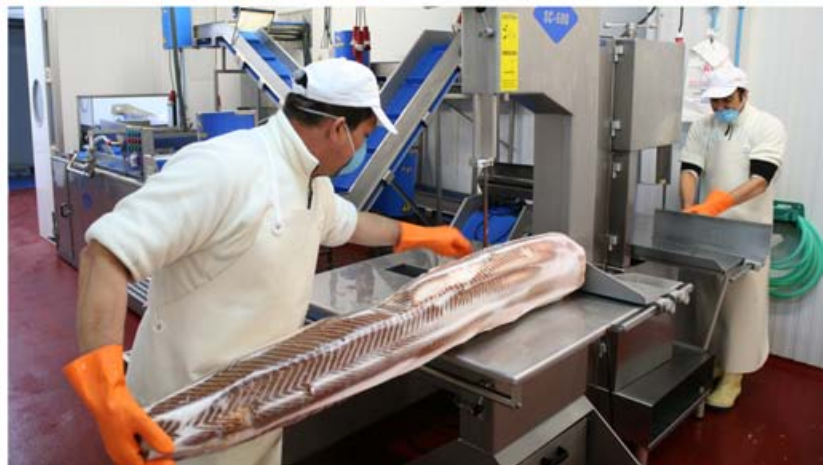
Distintas salas de elaboración de pescados frescos y congelados