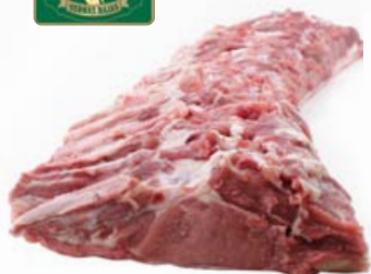
Entrecot Ternera Blanca. 110 00999