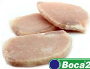
Cinta Lomo Cerdo Boca2. 302 00109