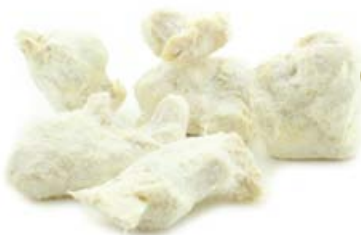
Huesos Añejos. 240 00501