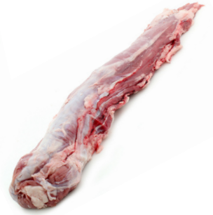
Solomillo Ternera Blanca. 110 00178