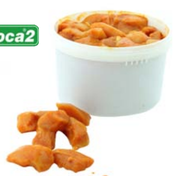
Pinchito Pollo Boca2 113 00230