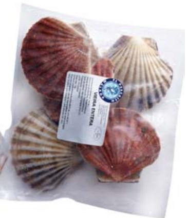
Vieira Entera. 133 00221