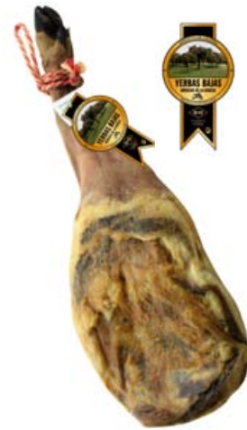
Paleta Bellota 100% Ibérica Yervas Bajas. 240 00203