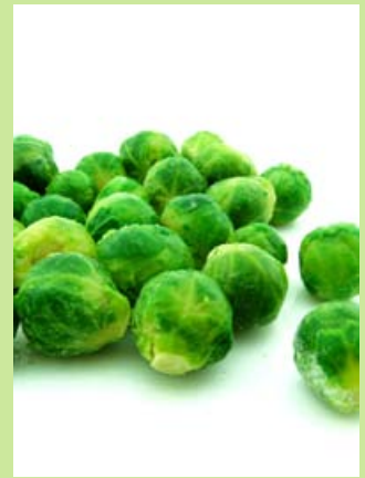
Coles Bruselas. 120 00125