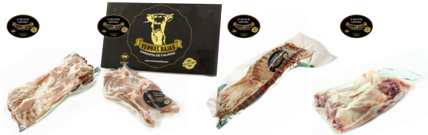
Pierna Chivo Yervas Bajas . 304 00609