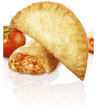
Empanadilla Mesón Atún: 231 00333