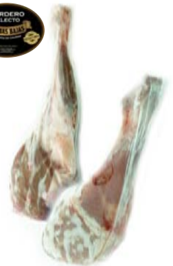
Pierna Cordero Recental Yervas Bajas. 304 00500