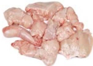
Molleja Cordero Lechal Yervas Bajas 304 00201