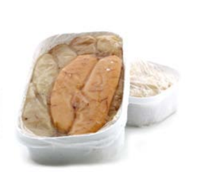
Merluza Namibia Hueva 0'500 150 00 515