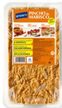
Pintxo Marisco 500 gr. 205 00630