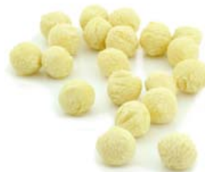
Patata Bocaditos. 234 00165