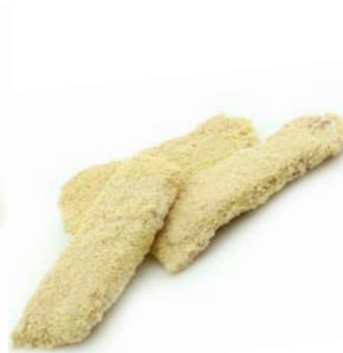
Pechuga Pollo rellena Jamón y Queso. 232 00185