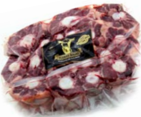
Rabo Añojo Yervas Bajas. 110 00120