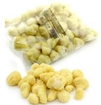
Coliflor Rebozada. 232 00221