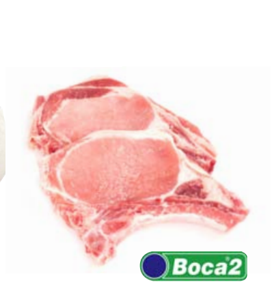
Chuletas Cerdo Boca2. 302 00317