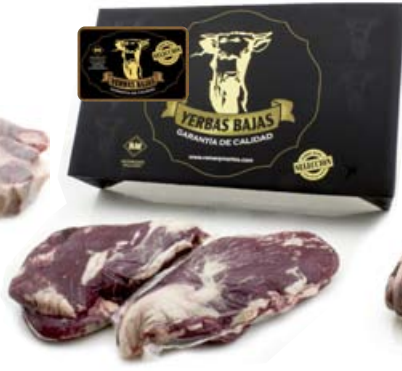
Vacío Añejo Yervas Bajas. 300 00303