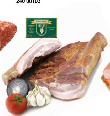
Bacon Natural Yervas Bajas 240 00123