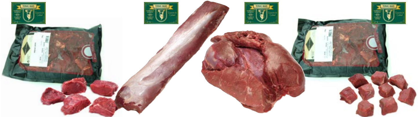
Ragout Ciervo Pulido Yerbas Bajas. 125 00105