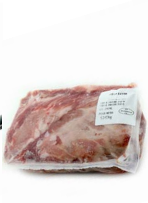
Presa 100% Ibérica. 303 00213