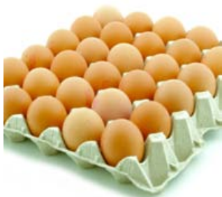
Huevos. 250 00101