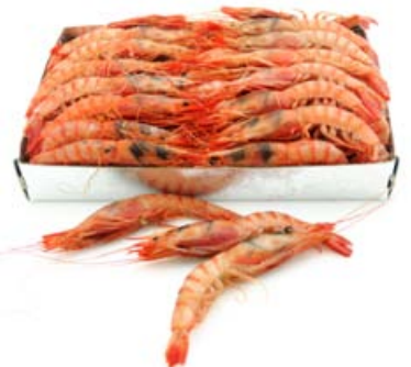
Alistado 'Gamba Roja' A Bordo 130 00239