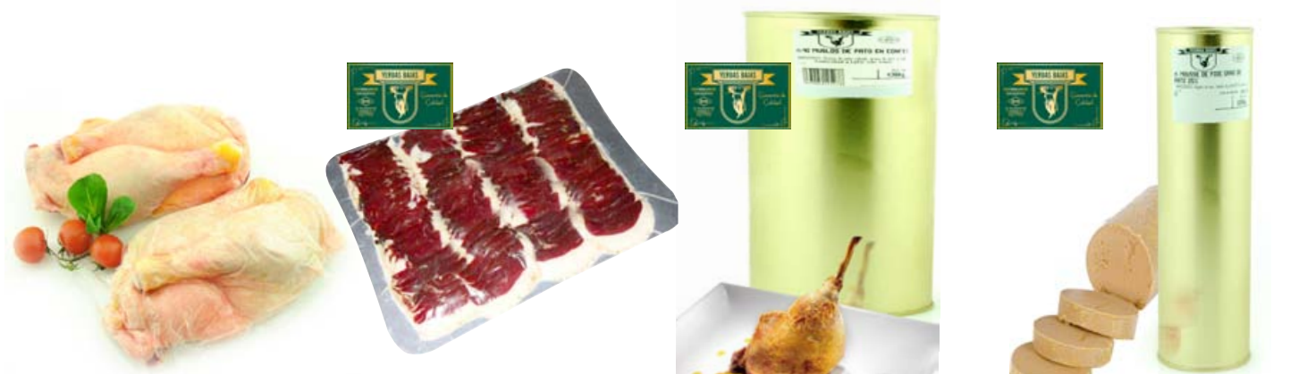
Muslos Pato. 125 00227