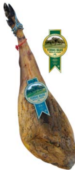
Jamón Cebo de Campo 100% Ibérico Yervas Bajas. 240 00162