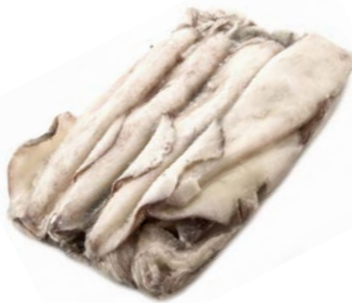
Calamar Indio U/3. 171 00101