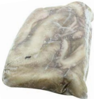
Pulpo Taco. T1 +4 kg: 173 00701 T2 3-4 kg: 173 00203 T3 2-3 kg: 173 00204 T4 1-2 kg: 173 00700