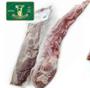
Solomillo Ternera Blanca Yervas Bajas. 305 00164