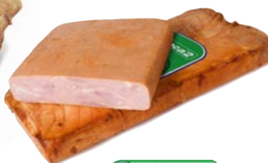
Bacon Molde Boca2. 240 00122