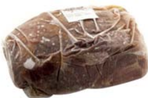
Tapa Vacuno Iny. 301 00507