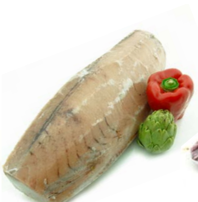
Atún Lomo A/V. 201 00155