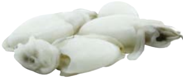
Choco Limpio 8/12: 172 00133 13/20: 172 00147