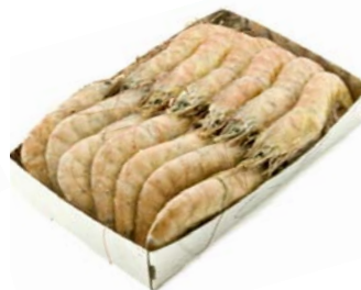
Langostino Blanco Salvaje A Bordo B-0 Especial: 131 00130 B-0: 131 00101 B-1: 131 00166