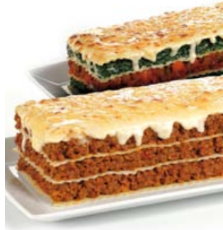
Lasaña 2 Kg. Carne. 231 00624 Lasaña 2 Kg. Verdura. 231 00625