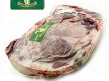
Tapa Añojo Yervas Bajas. 110 00303