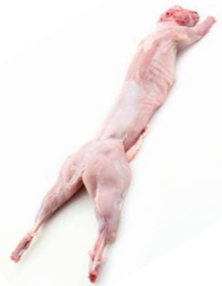
Conejo Fresco. 101 00114