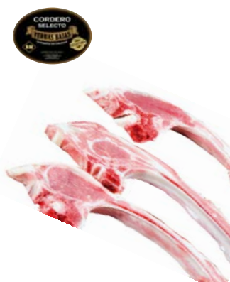
Chuletilla Cordero Lechal Yervas Bajas. 114 00650