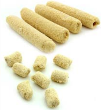
Flamenquín York y Queso. 232 00144. Mini Flamenquín. 232 00344