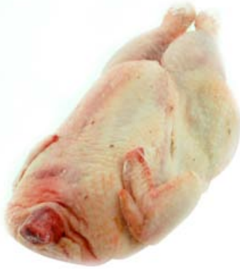
Gallina Pesada Cong. 100 00114