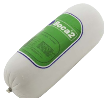
Chopped Extra Boca2. 240 00125