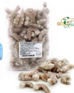
Langostino Pelado 41/50 IQF Gold Fish. 131 00140