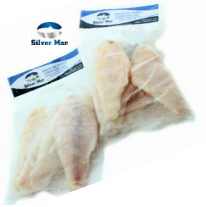
Panga Fte. IQF Silver Mar. 205 00234