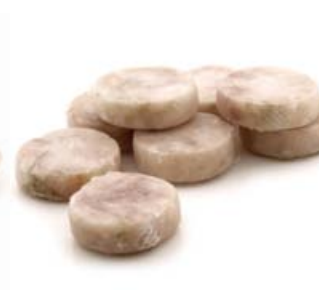
Merluza Embutida Cort. Rodajas. 150 00760