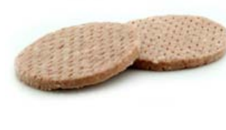
Hamburguesa Mixta. 232 00105