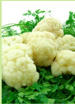
Coliflor. 120 00103