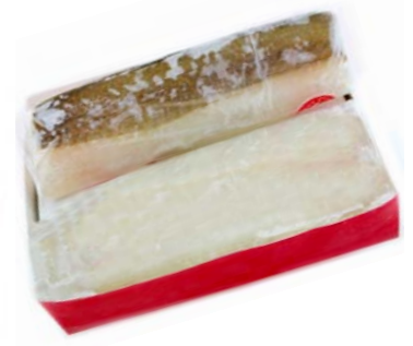
Bacalao Lomo Golden Extra +300. 200 00141