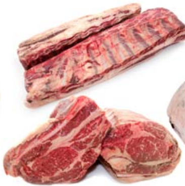
Chuletón Buey 8 cost. A/V. 111 00817