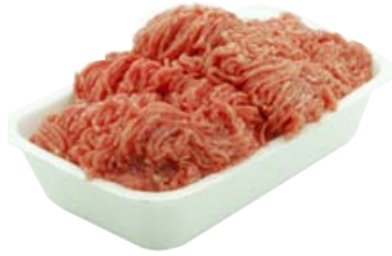
Picada Cerdo. 112 00125