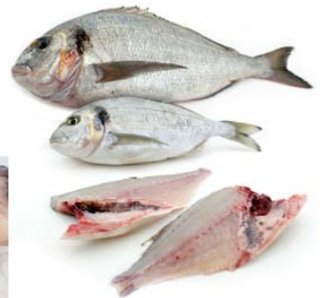
Dorada en filetes