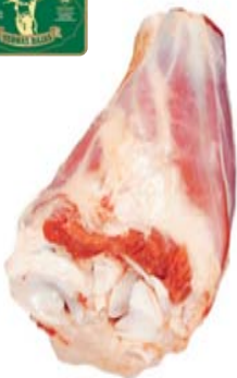
Osobuco Ternera Blanca Yervas Bajas. 305 00367