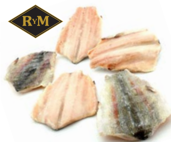
Trucha Fte. RyM. 205 00150