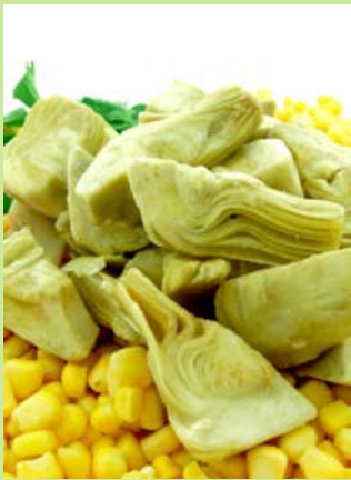
Alcachofa. 120 00102