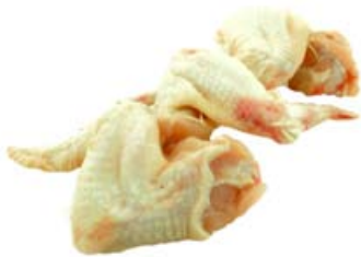
Alas Pollo Fresca. 101 00167