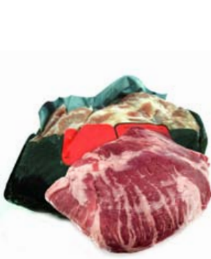
Presa Duroc. 303 00101