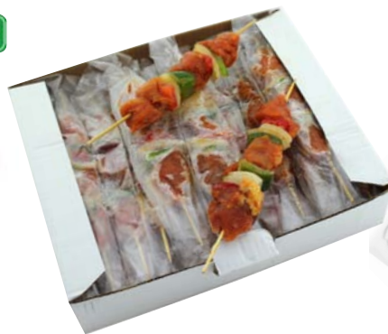
Brocheta Pollo. 232 00110