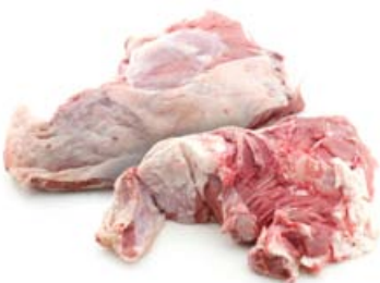
Cadera Ternera Blanca. 110 00782