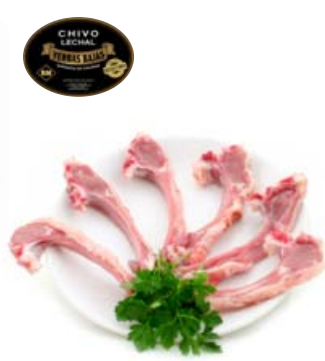
Chuletilla Chivo Yervas Bajas 114 00115