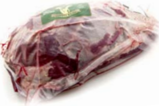
Babilla Añojo Yervas Bajas. 300 00159