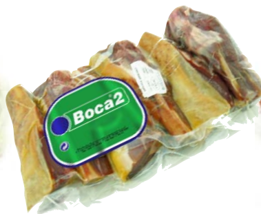
Codillo Jamón Bodega Boca2. 240 00802