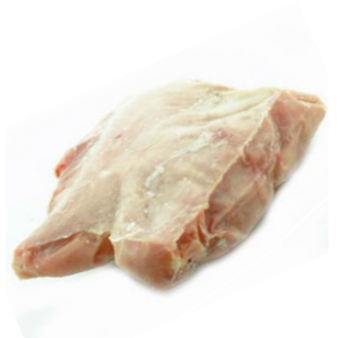
Pechuga Pavo Cong. 100 00149