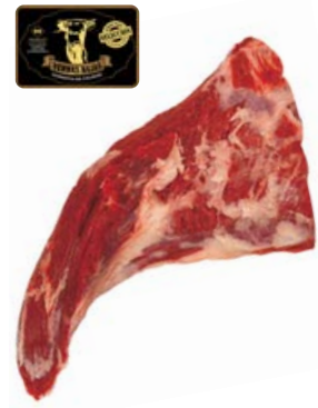
Picaña 'rabillo cadera' Añejo Yervas Bajas. 300 00121