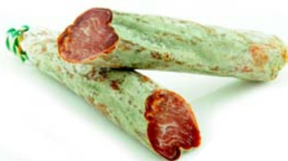
Lomo Cebo de Campo 100% Ibérico Yervas Bajas. 240 00263