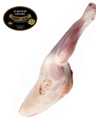
Pierna Chivo Yervas Bajas 114 00663