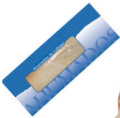
Bacalao Ahumado Plancha Precort. 1100/1500. 125 00927