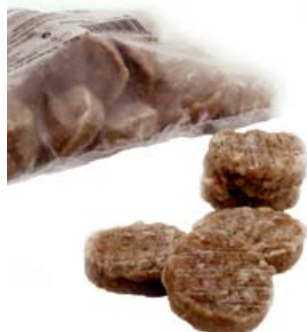
Hamburguesa Mini Cordero Boca2 230 00169