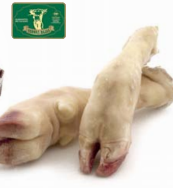
Pata Ternera Yervas Bajas. 300 00506