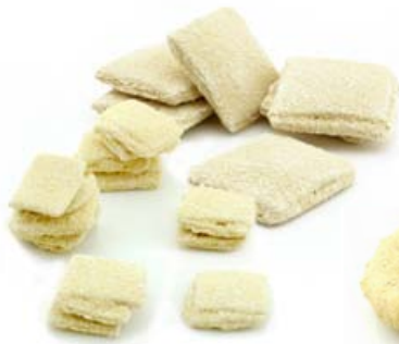
San Jacobo. 231 00125 Mini San Jacobo. 231 00244