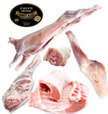
Chivo Lechal Yervas Bajas 114 00605