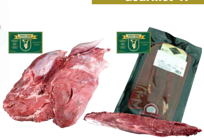
Pierna Ciervo s/h Pulida Yerbas Bajas. 125 00109