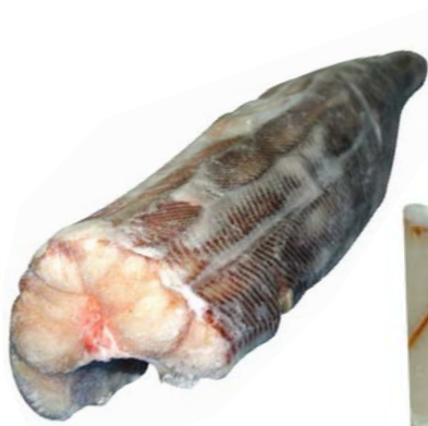
Cazón Entero S/P. 203 00102