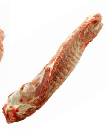
Chuletero Cerdo Estrecho. 112 00103