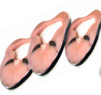
Marrajo Fte. 203 00302