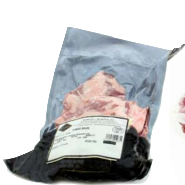
Abanico 100% Ibérico. 303 00212