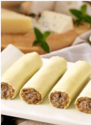
Canelón granel Carne Prielá. 231 00150