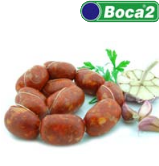
Chorizo Pincho Picante Boca2 113 00155