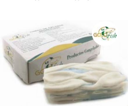
Pota Tubo Inter. Gold Fish. 172 00134