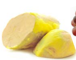
Foie Mi-Cuit Yervas Bajas. 125 00313