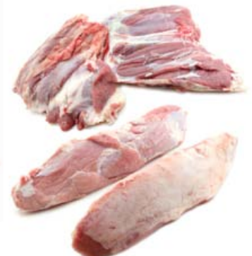
Jarrete Ternera Blanca. 110 00759. Redondo Ternera Blanca. 110 00781