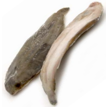
Lenguado Salvaje. 400/700 170 00161