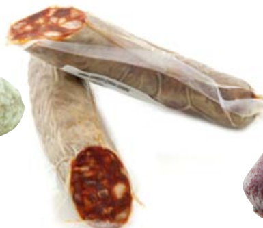
Chorizo 100% Ibérico Primera. 240 00605