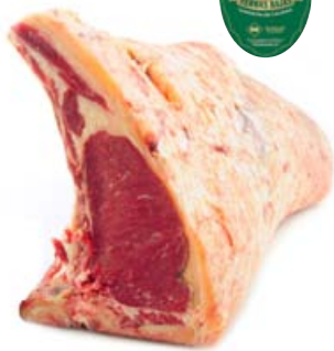
Chuletón Buey 8 Cost. Yerbas Bajas. 111 00450