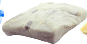
Tocino Ibérico Salado. 240 00502