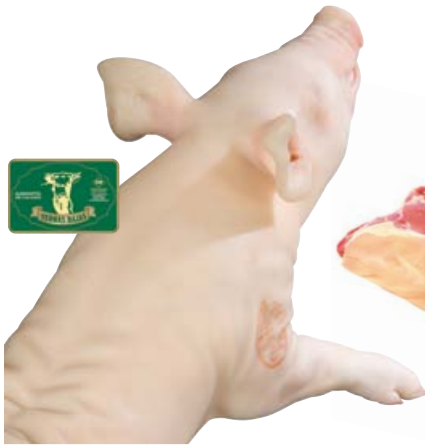
Cochinillo 4/5 kg. Yervas Bajas 302 00103. 5/6 kg.: 302 00183.