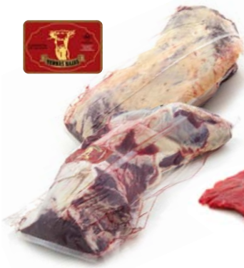
Contra Vaca Gallega Yerbos Bajos. 111 00410