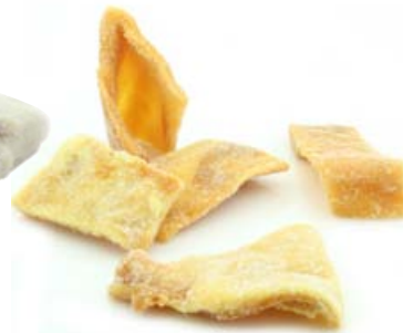
Corteza Añeja. 240 00500