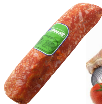
Lomo Adobado Plano Boca2. 240 00100