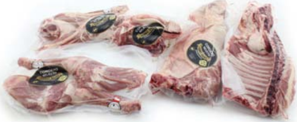
Cordero Lechal Yervas Bajas A/V. 304 00113