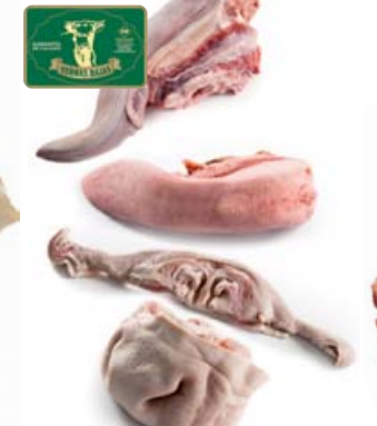
Lengua Ternera Yervas Bajas 300 00111 Morro de Ternera. 300 00810