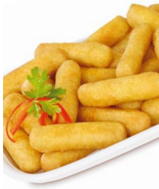
Palitos Merluza Price: 231 00114