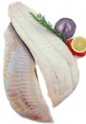
Fogonero Fte. Armario. 205 00185