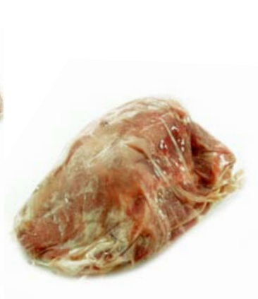
Cabezal Cerdo s/h Seco. 302 00202