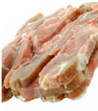
Chuleta Pavo Cong. 100 00170