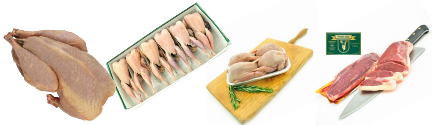
Faisán Extra. PV/Ud. 125 00117