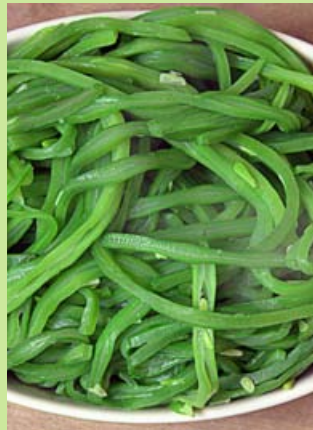
Judía Entera Redonda Fina. 120 00113