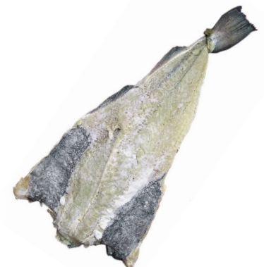
Bacalao Salado 30/40. 125 00201