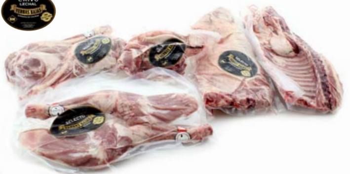
Chivo Lechal Yervas Bajas A/V. 304 00604