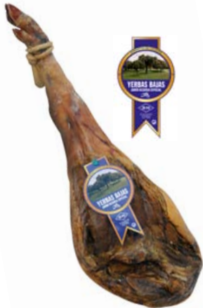
Jamón Reserva 20 Meses Yervas Bajas. 240 00128