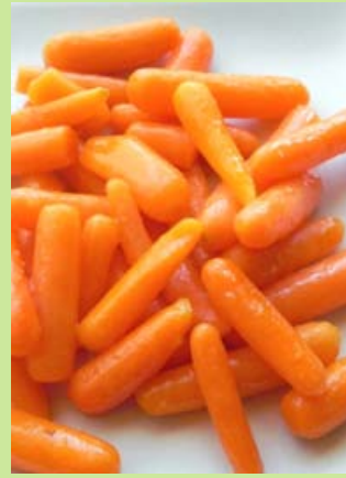
Zanahoria Baby. 120 00126