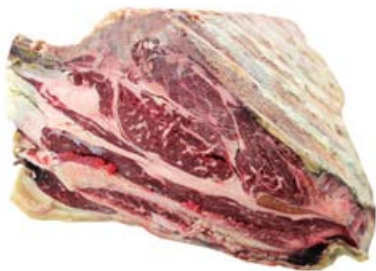
Chuletón Buey 8 Cost. Selección Yerbas Bajas. 111 00461