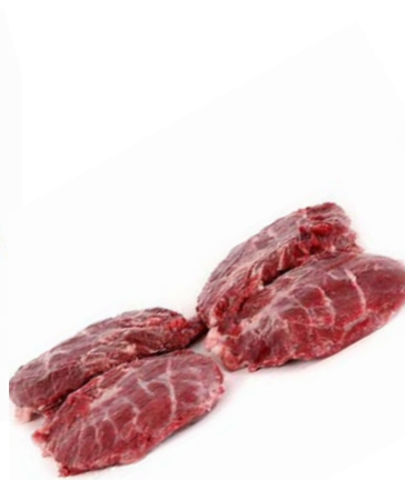
Carrillada Cerdo. 112 00133