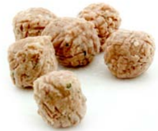
Albóndigas de Pollo. 232 00207 De Vacuno. 232 00407 Mixta. 232 00107