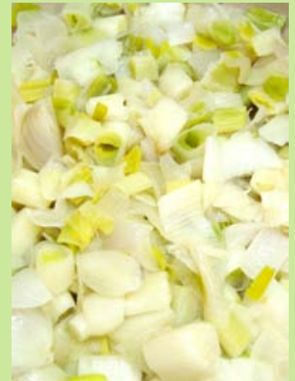
Puerro. 122 00160