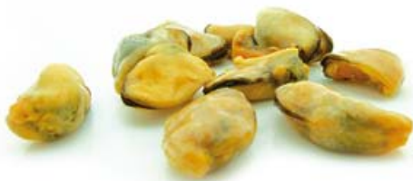
Mejillón Carne. M: 133 00847 G: 133 00845