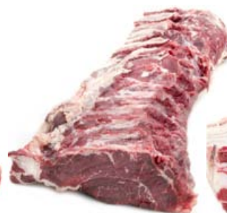
Entrecot Añojo. 110 00113