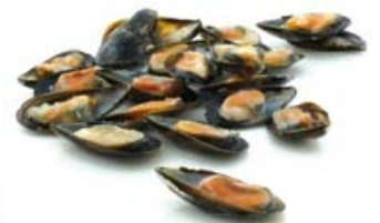
Mejillón m/concha 60/90. 133 00867