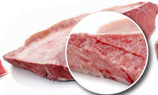
Ventresca de Atún. 710 00770