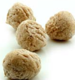
Albóndigas Pescado Azul Clavo 232 00260