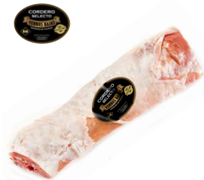
Carré Cordero Lechal Yervas Bajas 114 00602