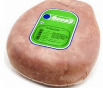
Paleta Cocida Ovalada Boca2. 240 00102