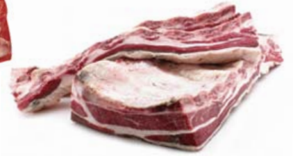
Costilla Ternera. 110 00316