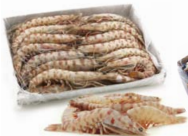
Langostino Tigre Túnez A Bordo N2: 131 00112 N4: 131 00168