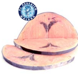
Pez Espada Fte. Extra El Pescaíto. 202 00176