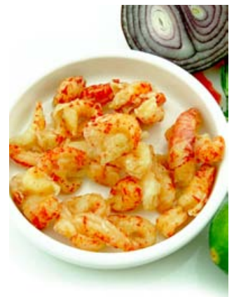
Txangurro, carne de centollo. 125 00140