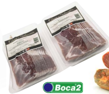
Paleta Serrana Loncheada 2x250 gr. Boca2. 240 00270