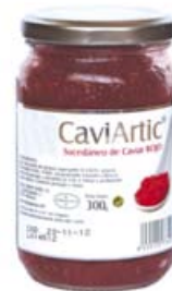
Sucedáneo Caviar Rojo, 300 gr. 125 00938