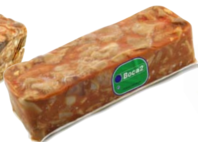
Callos Ternera Barra Boca2. 240 00157