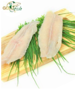
Panga Fte. IQF Gold Fish 205 00110