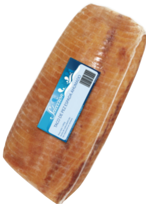
Pez Espada Ahumado Lomo 1000/1500. 125 00937