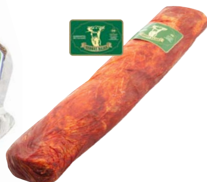
Lomo Adobado P. de la Vera Yervas Bajas. 113 00200