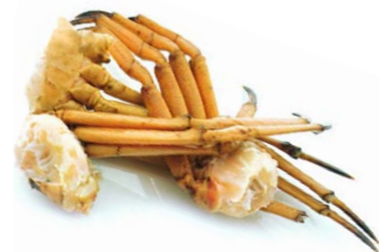
Pechos de Cangrejo