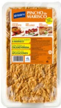
Pintxo Marisco 500 gr. 205 00630