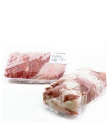
Secreto 100% Ibérico de Barriguera. 303 00107