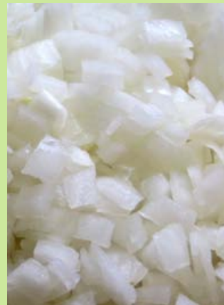
Cebolla Dados. 122 00123