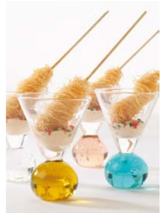
Brocheta Nido Langostinos. 125 00904