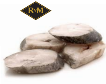
Merluza Rodaja N5 RyM. 150 00322