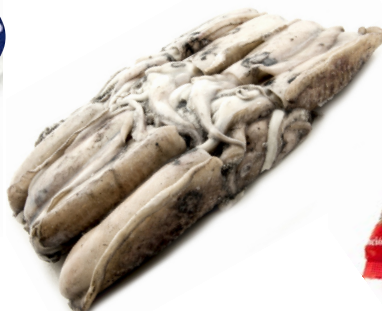
Choco Sucio. 172 00188