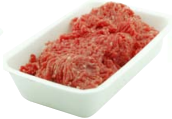
Picada Mixta. 112 00409