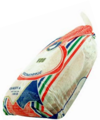
Pato Cong. 1'9/2'2 100 00121 1'8: 100 00221