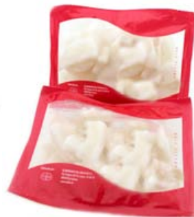
Bacalao Migas ISL. 200 00174