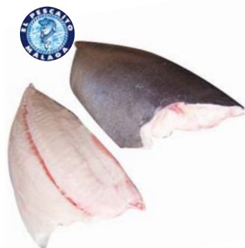
Negrta 'Cochinilla' 205 00180