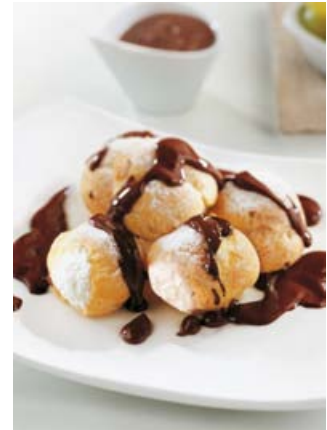
Profiterol nata. 231 00101