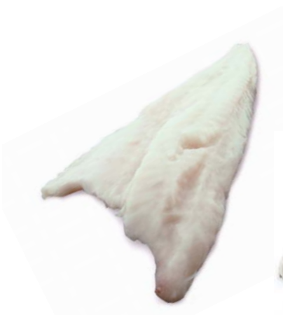
Bacalao Fte. ISL 1° Cong. +2.000 gr. 200 00369 +1.000 gr. 200 00269 500/1.000 gr. 200 00169