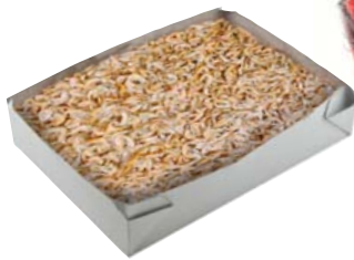
Cameron Cocido 'Tortillitas'. 130 00120