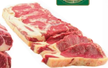
Entrecot Buey Bajo Yerbas Bajas 111 00513