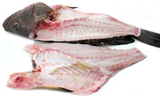
Mero en filetes