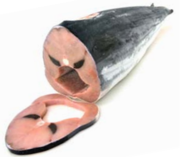
Marrajo Entero. 203 00107