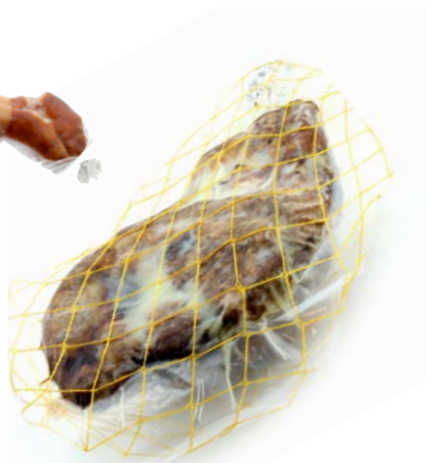
Paleta Cerdo Asada. 240 00142