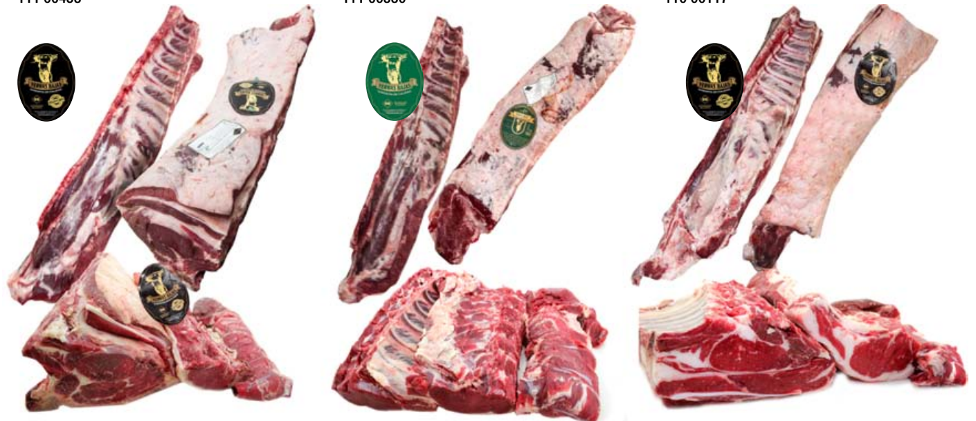
Lomo Añojo c/s Selección Yervas Bajas 110 00310