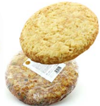
Tortilla de Patatas. 233 00217 Tortilla Calabacín. 233 00157