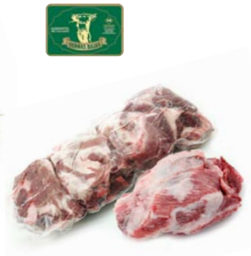
Mogote 100% Ibérico Yervas Bajas 303 00252