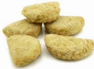
Cordon Bleu York y Queso. 232 00307