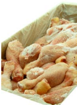
Jamoncitos Pollo Cong. 100 00159