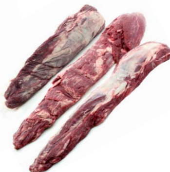
Solomillo Buey +3kg. Gourmet 111 00337