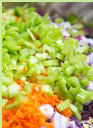
Sopa Verduras. 120 00124