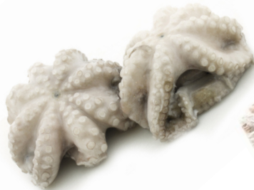
Pulpo Flor 6: 173 00461 7: 173 00561 8: 173 00661