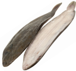
Lenguado Rubio. G 450/600: 170 00159. M 300/500: 170 00157 · P 250/400: 170 00158