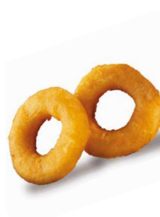
Caprichos Calamar. 231 00116