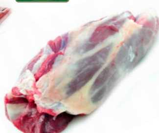
Jarrete Añojo Yervas Bajas. 110 00313