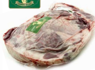
Tapa Añojo Yervas Bajas. 300 00153