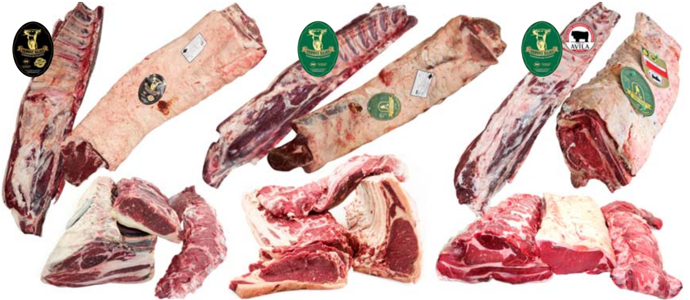
Lomo Buey c/s Selección Yervas Bajas 111 00453