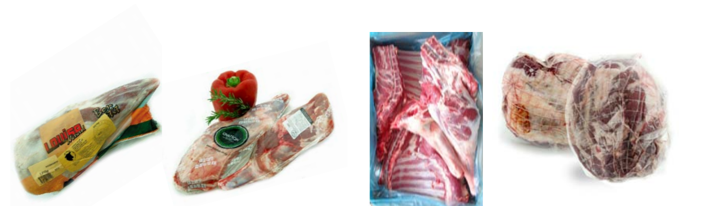
Pierna Cordero Imp. 304 00119