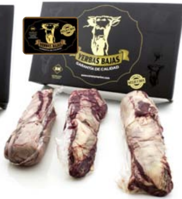
Entraña Añejo Yervas Bajas. 300 00332