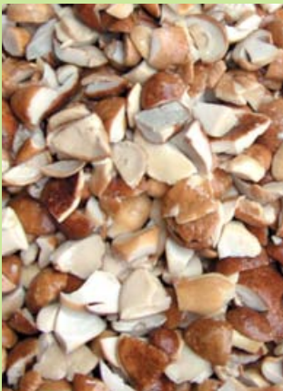
Boletus Edulis. 122 00165