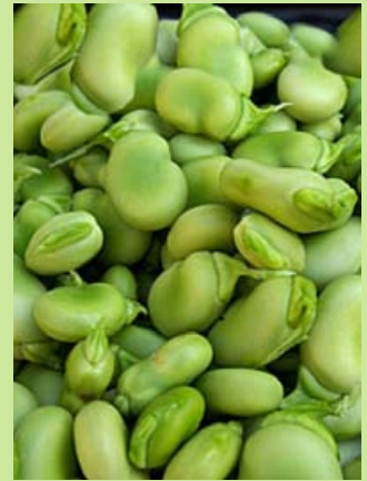
Habas Baby: 120 00110