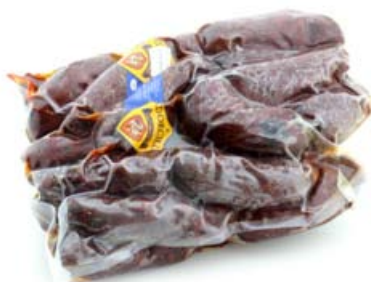
Morcilla Asturiana Ahumada. 240 00411 Chorizo Ahumado Extra Asturiano. 240 00410