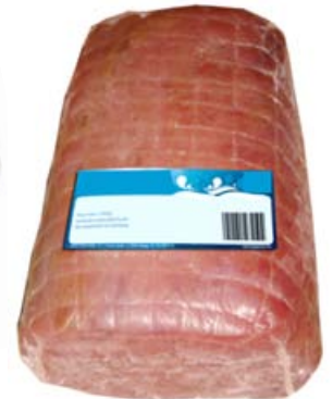
Atún Ahumado Lomo 1000/1500. 125 00934