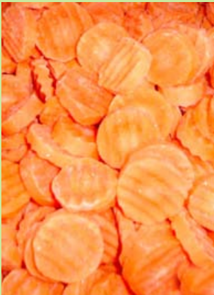
Zanahoria Rodaja. 120 00115