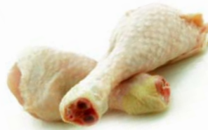
Jamoncito Pollo Fresco. 101 00166