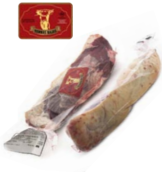
Redondo Vaca Gallega Yerbos Bajos 111 00407