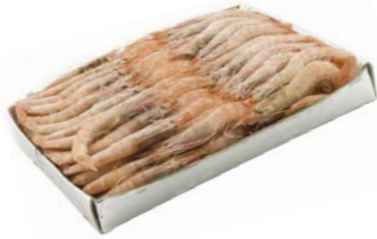
Gamba Grande Huelva/Marruecos