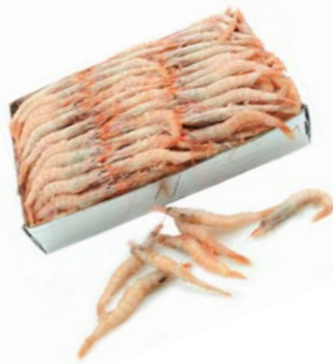
Gamba Mediana Huelva/Marruecos