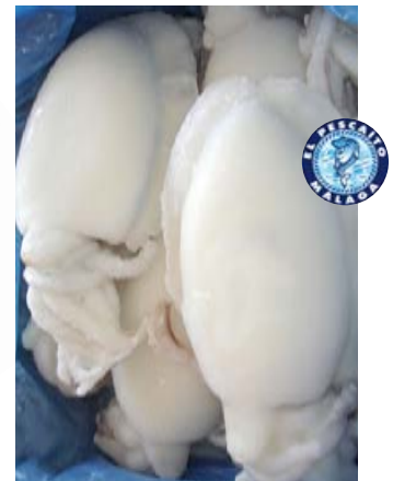
Choco Limpio G 'El Pescaíto'. 172 00185