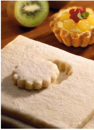
Masa Hojalde. 231 00629