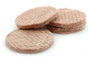
Hamburguesa Pollo. 232 00134