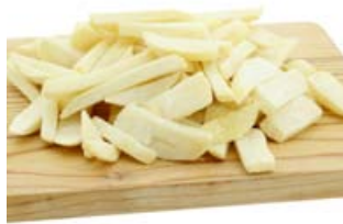
Patata 3/8. 234 00111 Patata 1/4. 234 00112 Steakhouse. 234 00115