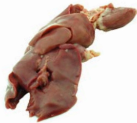
Higado Pollo Fresco. 101 00104