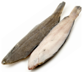
Lenguado Negro. 170 00259