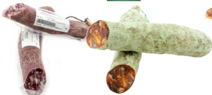
Salchichón 100% Ibérico Primera. 240 00842