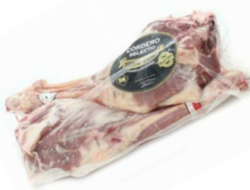
Pierna Cordero Lechal Yervas Bajas 304 00154