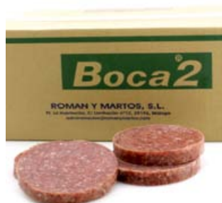
Hamburguesa Ternera Boca2 120 gr.: 230 00149 180 gr.: 230 00506