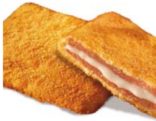
San Jacobo. 231 00125 Mini San Jacobo. 231 00244