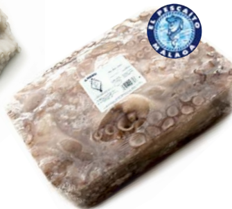
Pulpo Elaborado 'El Pescaíto'. 0 3-4 kg: 173 00255 00 4-6 kg: 173 00155