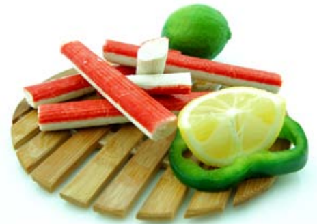
Bocas de Mar hostelería 205 00890