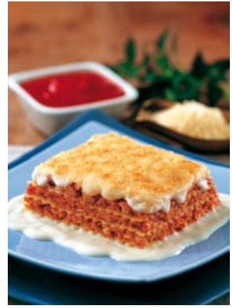
Lasaña Price 300gr Carne. 23100252. Vegetal. 23100624.