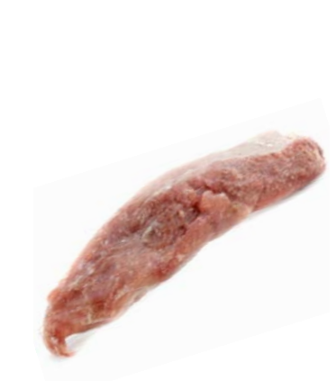
Solomillo Cerdo Seco Limpio. 302 00125