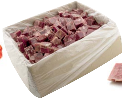
Ternera Trozo. 300 00407