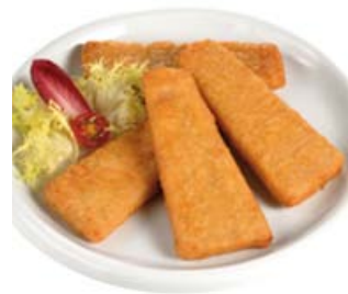
Porciones Merluza. 231 00628