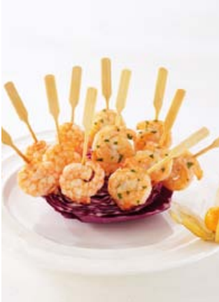
Piruleta Langostinos Marinada. 125 00902