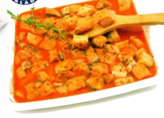
Cazón Adobo 'El Pescaito' 125 00890