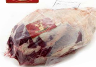
Babilla Vaca Gallega Yervas Bajas. 301 00534