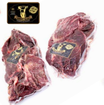
Carrillada Vaca Gallega Yervas Bajas 301 00148