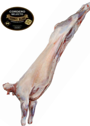
Cordero Recental Yervas Bajas 304 00162