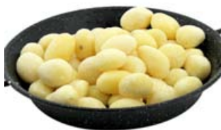
Patatas Parisinas Cocer: 234 00132 Patatas Parisinas Freir: 234 00100