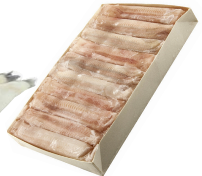
Lenguadina Fte. 170 00205