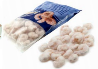
Gambas Peladas 10/30: 130 00104 30/50: 130 00201. 50/70: 130 00202 70/100: 130 00203