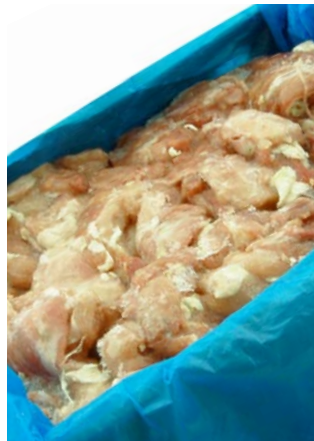
Churrasco Pollo Cong. 100 00205