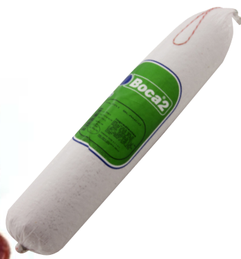
Salami Blanco Boca2. 240 00115