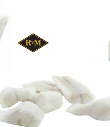
Rosada Fte. Cortado RyM. 151 00135