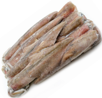
Calamar Nacional GG: 171 00178 G: 171 00179 · M: 171 00121 P: 171 00117 · 2P: 171 00448