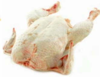
Pollo Gordo Fresco. 101 00211 1'2: 101 00212 · 1'3: 101 00213 1'4: 101 00214 1'1 Pollo Asador: 101 00311