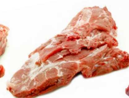
Cabezal Cerdo S/H. 112 00110