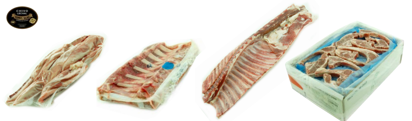
Costilla Chivo Lechal Yervas Bajas. 304 00701