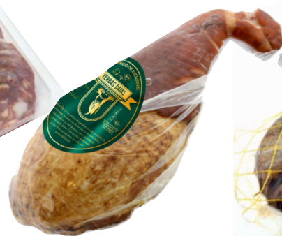
Paleta Ahumada Yerbas Bajas. 240 00222