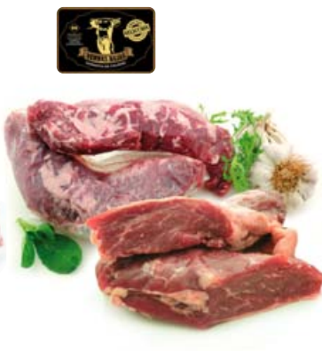
Solomillo 100% Ibérico Yervas Bajas. 303 00122