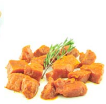
Pinchito Cerdo. 230 00280