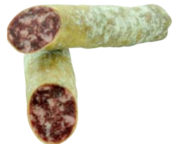
Salchichón 100% Ibérico Yervas Bajas. 240 00301