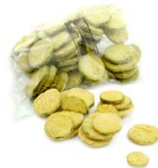
Calabacín Rebozado. 232 00171