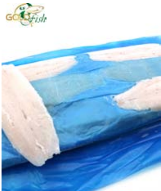
Panga Fte. 170/220 Gold Fish 205 00135