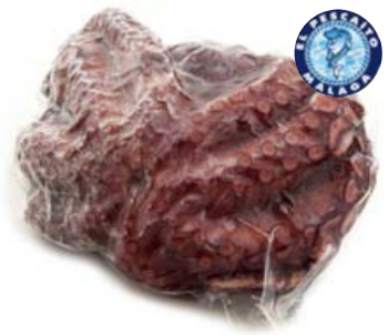
Pulpo Cocido Entero 'El Pescaíto'. 173 00373