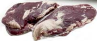
Vacío Yervas Bajas. 110 00783