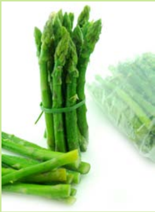
Espárgagos. 120 00118