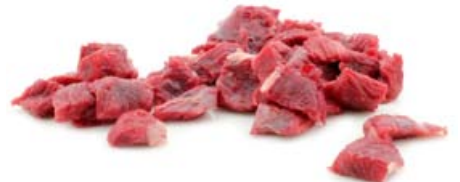
Tenera Trozo Extra. 110 00308