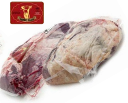
Tapa Vaca Gallega Yerbos Bajos. 111 00501