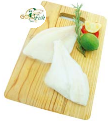
Limanda Fte. S/P Gold Fish. 205 00178