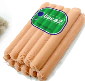
Salchicha Frankfurt Boca2. 240 00748