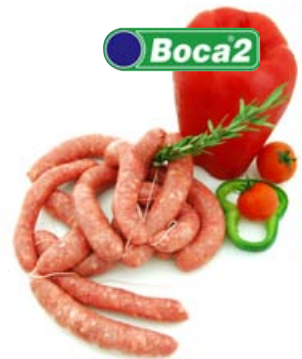
Salchicha Cerdo Blanca Boca2 113 00280