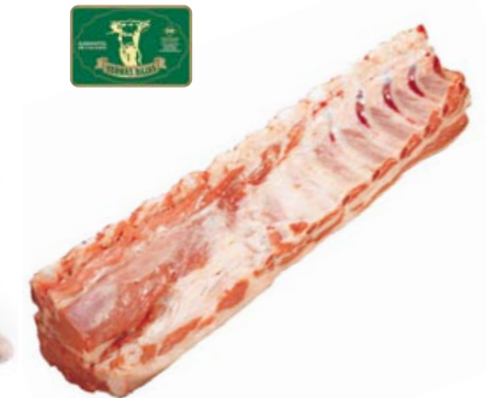
Lomo Ternera Blanca Yervas Bajas. 305 00155