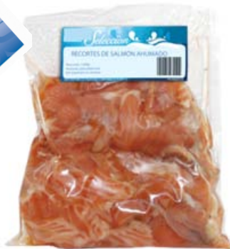
Salmón Ahumado recortes. Fr.: 125 00926. Cong.: 125 00352