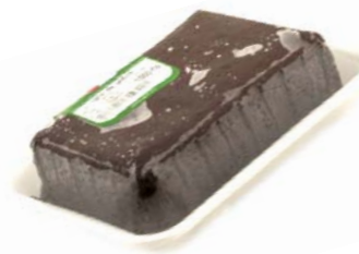
Torta Sangre Fresco. 101 00101