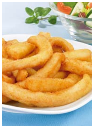
Rabas Empanadas Prielá. 231 00368. Price. 231 00168