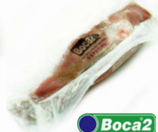
Cabezal Cerdo s/h Boca2. 302 00102