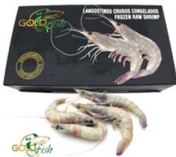
Langostino Estuche Gold Fish 30/40: 131 00204. 40/50: 131 00131 50/60: 131 00199. 60/70: 131 00196