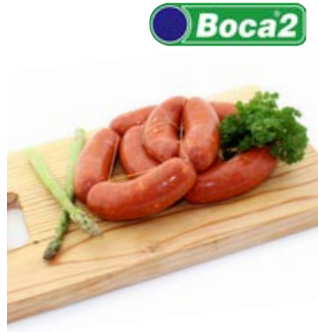
Chorizo Rosario Boca2 113 00154