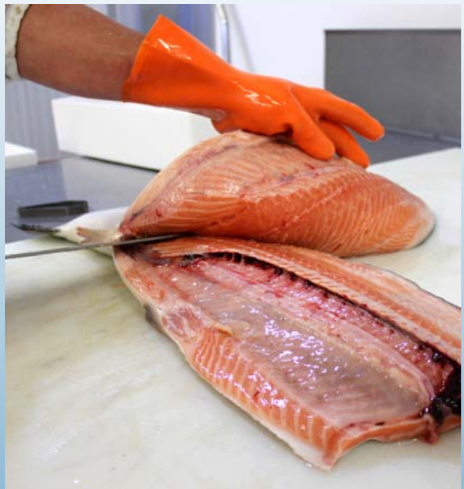
Elaboración salmón en filetes