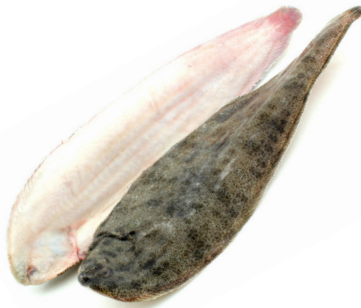
Lenguado Tigre GG+600: 170 00248 G 500/700: 170 00126 M 300/500: 170 00103 P 250/400: 170 00115