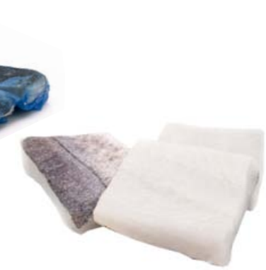
Merluza Centro Namibia 75/120. 150 00339. 120/140. 150 00332.