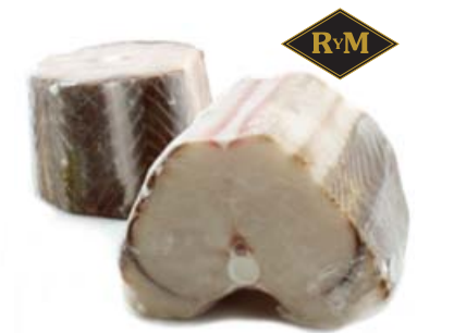
Cazón Centro RyM. 203 00 162