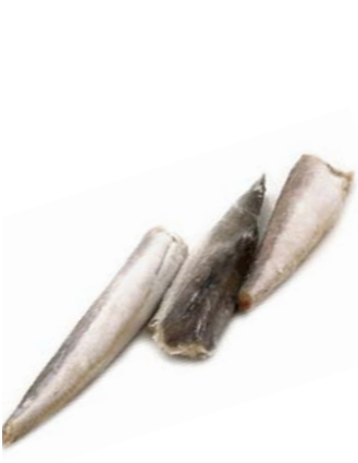
Merluza Tronquitos A Bordo. 150 00114