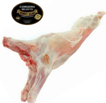
Cordero Lechal Canal Yervas Bajas 114 00600