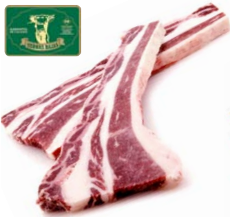
Churrasco Añejo Yervas Bajas. 300 00136