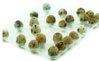
Huevos Codorniz. 250 00102