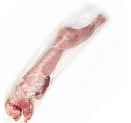
Conejo Nacional Cong. 100 00815