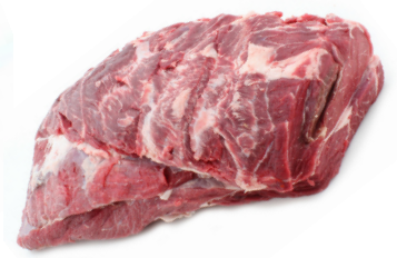
Lomo Aguja Añojo 110 00408