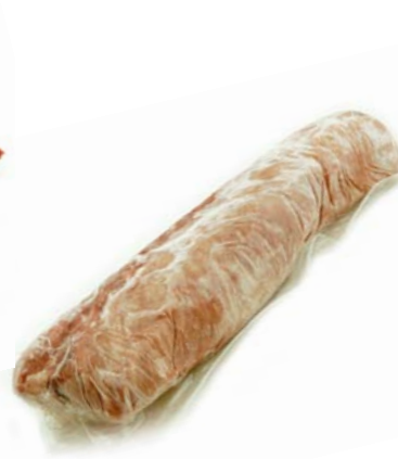
Cinta Lomo Cerdo Seca. 302 00116