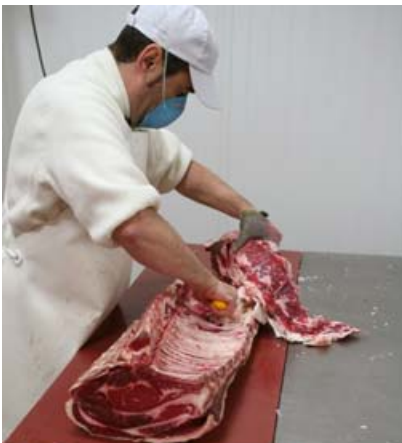
Solomillo Cerdo Boca2. 302 00124