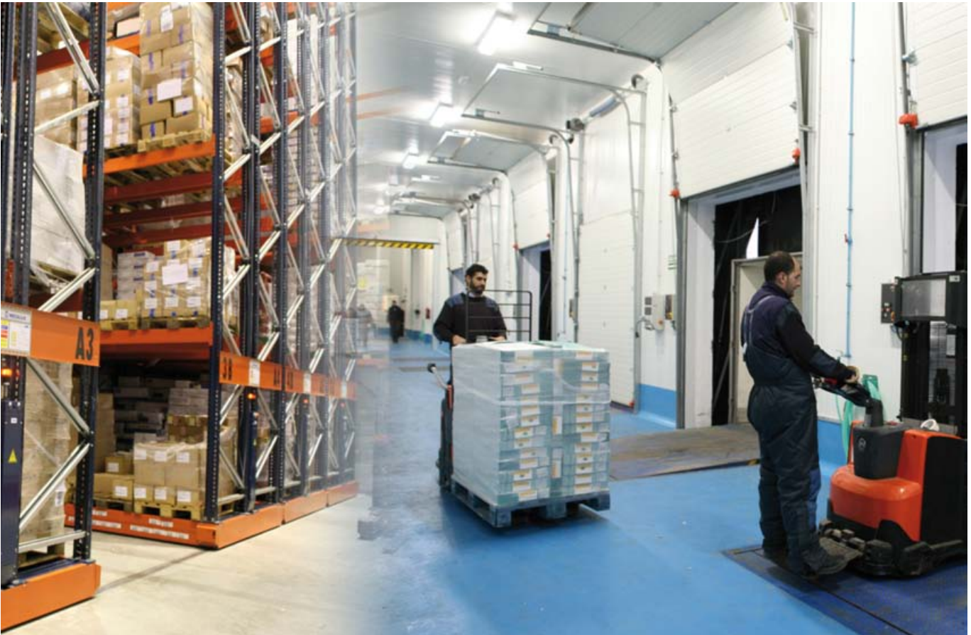
Capacidad de almacenaje de más de 1.600 toneladas