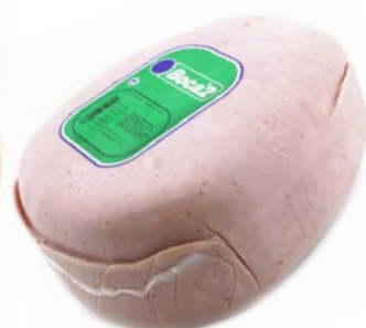
Jamón Cocido Boca2. 240 00117