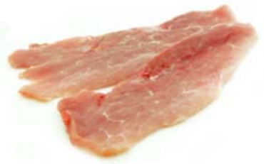
Cerdo Filete. 112 00204