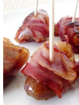
Dátiles con Bacon. 125 00182