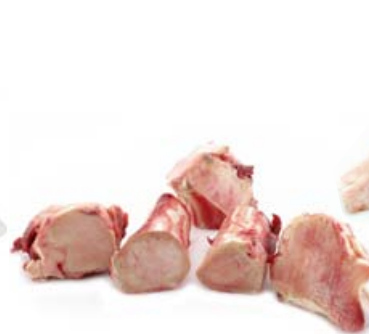
Huesos Ternera Tuétano Cortado. 300 00650