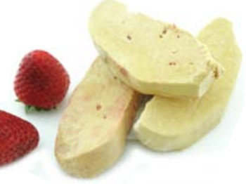
Foie Escalope Yervas Bajas. 125 00928