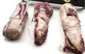
Entrañas Yervas Bajas. 110 00414