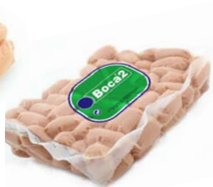
Salchicha Cocktail Boca2. 240 00764