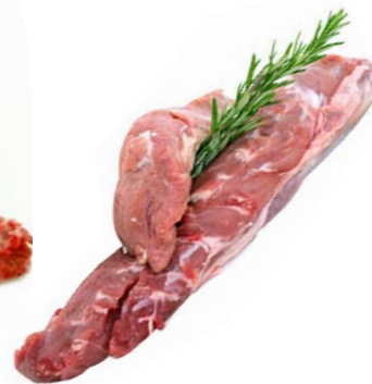
Solomillo Cerdo Limpio. 112 00100