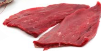
Tenera Filete Extra. 110 00312