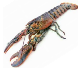
Bogavante Canadá. 132 00141