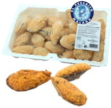
Mejillón Tigre Relleno 'El Pescaíto' 232 00187