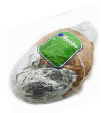
Jamón Asado al Horno Boca2. 240 00118