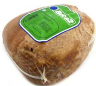
Pechuga Pavo al Horno Boca2. 240 00155