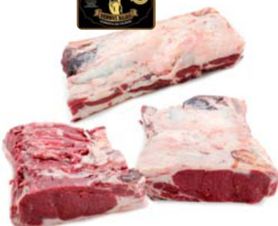
Entrecot Añojo Bajo Selección Yerbas Bajas. 110 00126