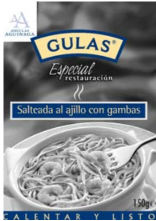
Gulas con Gambas 150gr. 205 00636 Gulas al ajillo con Gambas 150gr. 205 00635