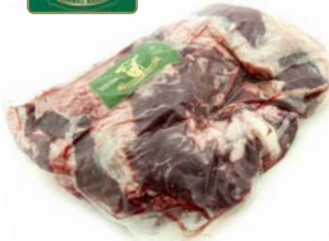
Cadera Añojo Yervas Bajas. 300 00610