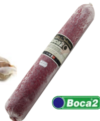
Salchichón Selección Boca2. 240 00104