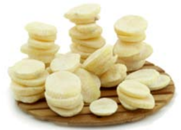
Patatas Dollar. 234 00119