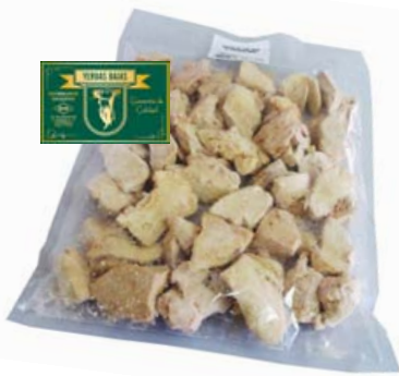
Foie Puntas Yervas Bajas. 125 00931