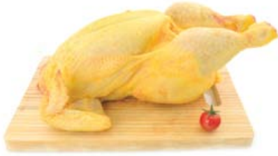
Pollo Campo Fresco. 101 00163