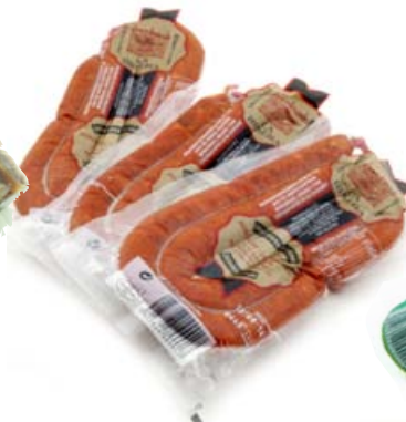
Chistorra de Burgos. 240 00127