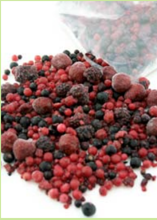
Frutas del Bosque. 120 00127