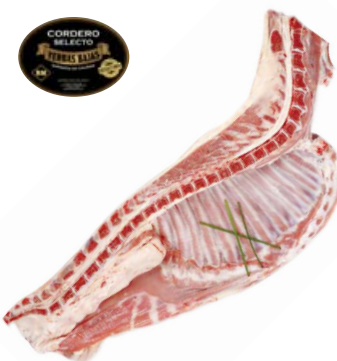
Carré Chivo Yervas Bajas 114 00104