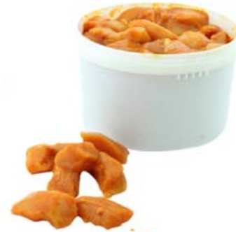
Pinchito Pollo. 230 00350