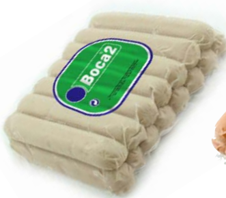
Salchicha Bradwurst Boca2. 240 00758