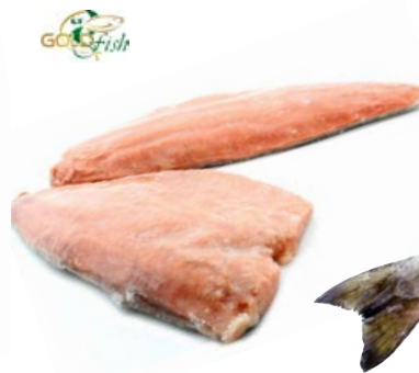
Salmón Fte. Gold Fish. 204 00123