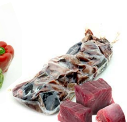
Atún Rojo Trozo. 201 00655