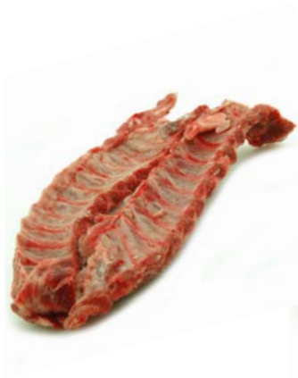
Costilla Corbata. 302 00120