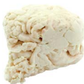
Manto Cordero, 'Crepineta'. 304 00311