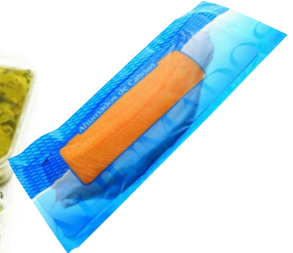
Salmón Ahumado Plancha p/c 1100/1500: 125 00924. 600 gr: 125 00651. 100 gr: 125 00152. Salmón Ahumado Plancha Entero 1100/1500: 125 00923