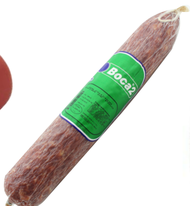
Salchichón Pavo Extra Boca2. 240 00154