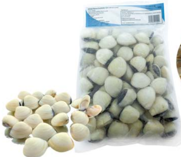
Almeja Blanca 60/80: 13300137