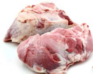
Tapa Ternera Blanca. 110 00753