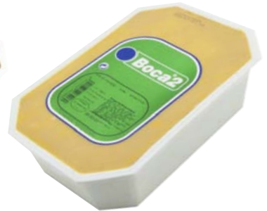
Mousse de Pato Boca2. 240 00111