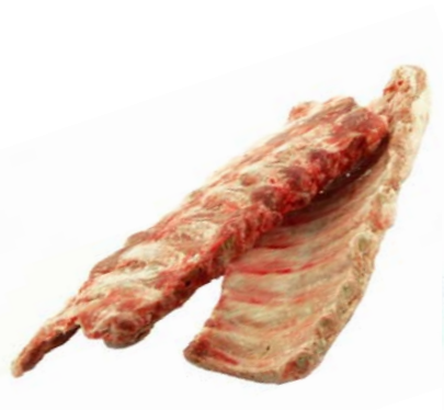
Costilla Corbata 100% Ibérica. 303 00352