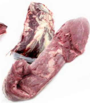
Solomillo Añojo +3kg Imp. 110 00116