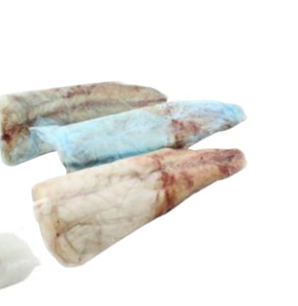
Rape Cola 1.000/2.000 Namibia A Bordo. 152 00146 Rape Cola RyM. 152 00147