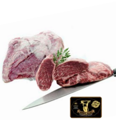
Presa 100% Ibérica Selección Yervas Bajas. 303 00112