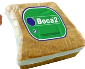
Bacon Loncheado Boca2. 240 00133