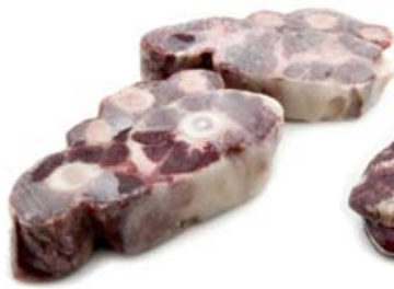
Rabo Añejo Cortado. 300 00331