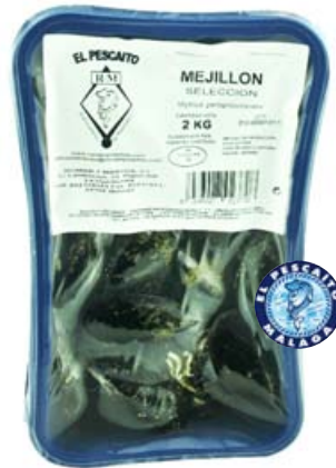
Mejillón fresco a/v 'El Pescaito'