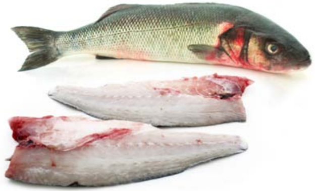
Lubina salvaje en filetes