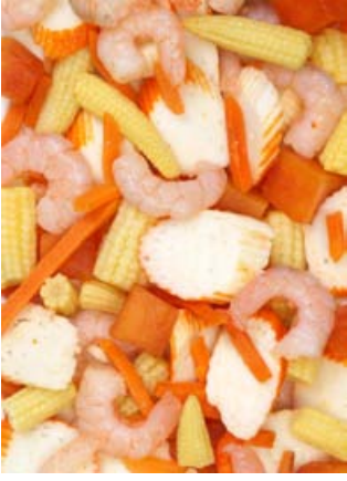
Ensalada Cangrejo. 120 00311