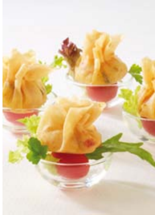
Saquito Queso Cabra y Verduras. 125 00906