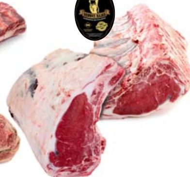
Chuletón Añojo 8 Cost. Selección Yerbas Bajas. 110 00101