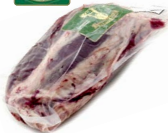
Jarrete Añojo Yervas Bajas. 300 00185