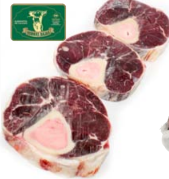
Osobuco Añejo Yervas Bajas 300 00169