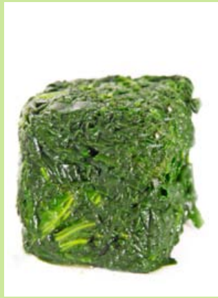
Espinacas. 120 00105