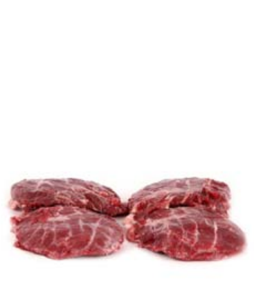
Carrillada Cerdo Limpia. 302 00250