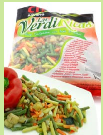
Salteado Campestre. 120 00128