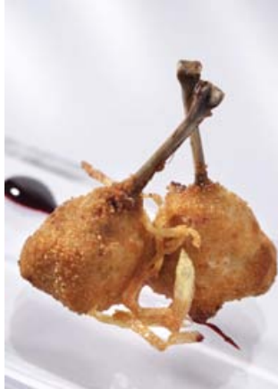
Muslitos Codorniz Villeroy. 125 00915