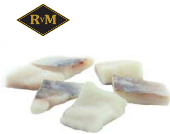
Bacalao Ventresca RyM. 200 00110