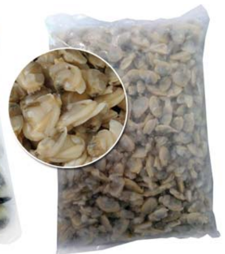
Almeja Carne: 13300188