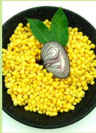
Maiz. 120 00116