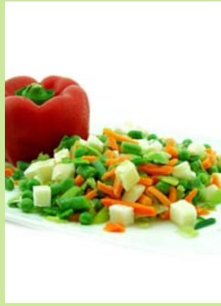
Menestra Común. 120 00117