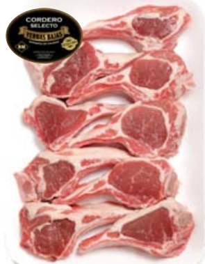
Chuleta Cordero Recental Yervas Bajas. 114 00755