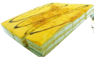
Tarta San Marcos. 238 00110 Tarta Tiramisú. 238 00114