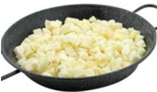
Patata Dado. 234 00231