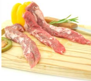
Solomillo Cordero. 304 00203