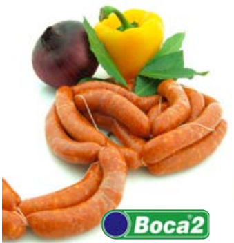
Salchicha Cerdo Roja Boca2 113 00281