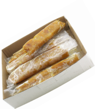
Pincho Pollo Palo, 40 uds. 230 00172