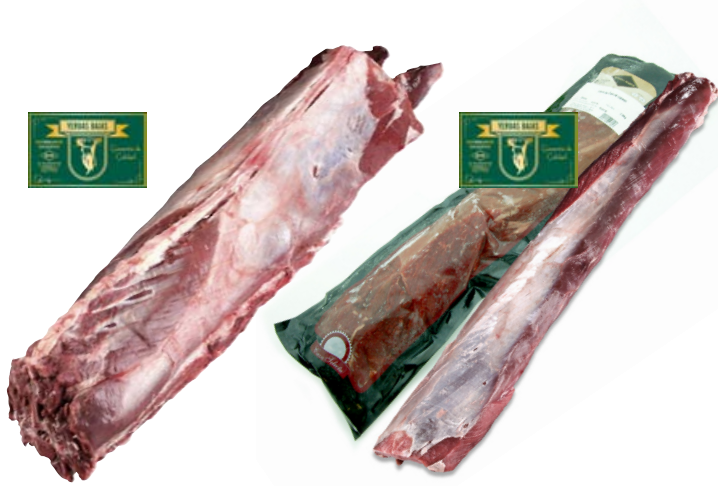
Chuletero Ciervo Yerbas Bajas. 125 00210