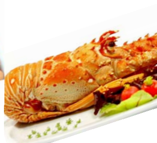
Langosta Cocida. 132 00161 Cocida y Cortada. 132 00162