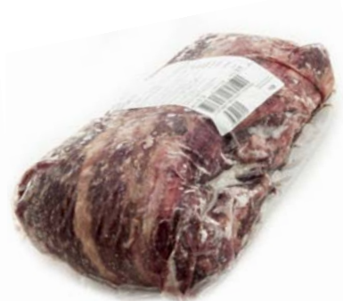
Solomillo Buey +3 Kg. Gourmet 301 00401