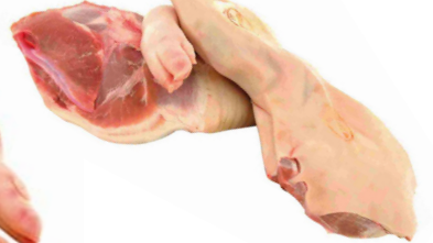
Paletilla Cochinillo Yervas Bajas 302 00181