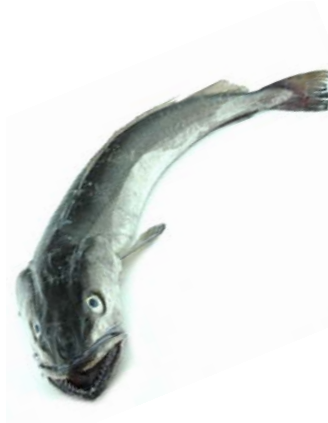
Merluza de Pincho