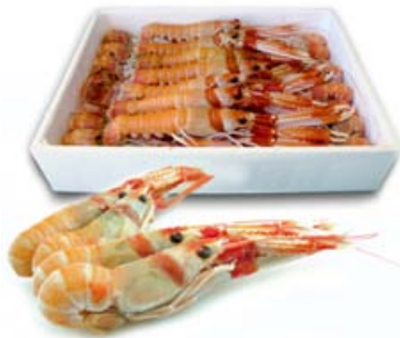
Cigala Nacional A Bordo 132 00381