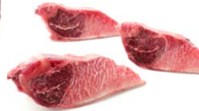
Atún Chuletas. 710 00147