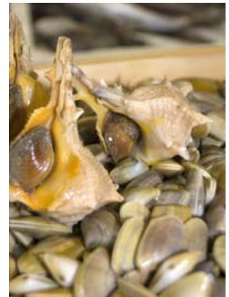
Búsanos y Coquinas