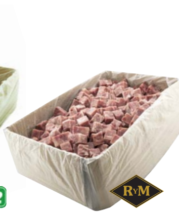
Magro Cerdo Elaborado RyM. 302 00603