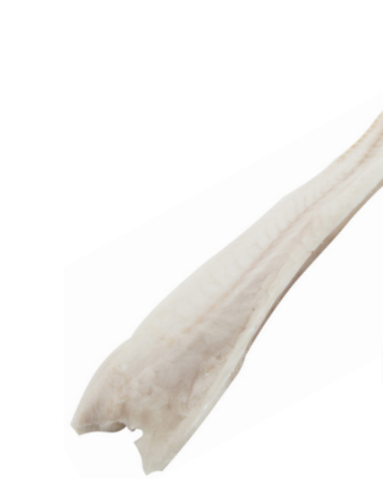
Rosada Fte. Armario 500-1.000. 151 00337