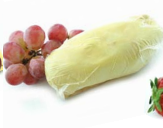
Foie Restauración Yervas Bajas. 125 00929