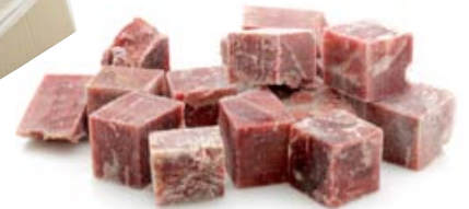
Ternera Trozo Elaborada. 300 00606