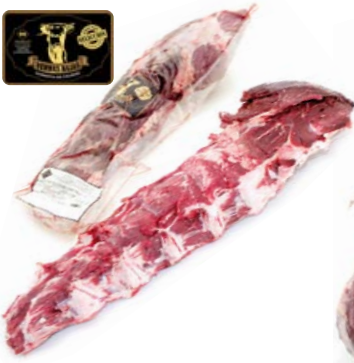
Solomillo Añojo Selección Yervas Bajas. 110 00903