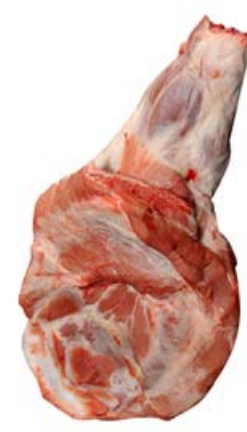
Paleta Cerdo c/Hueso. 112 00105