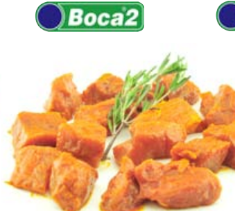
Pinchito Cerdo Boca2 113 00241