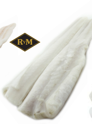
Rosada Fte. G Especial RyM. 151 00147