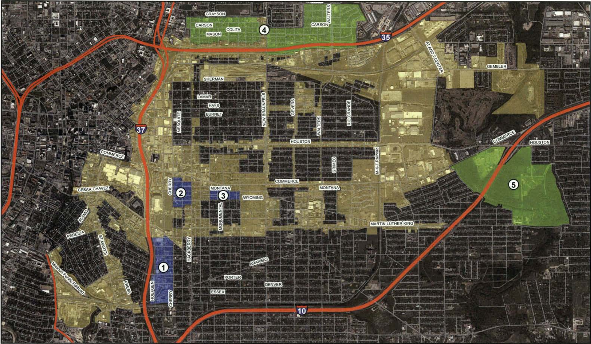
TIRZ 11 Proposed Boundary Amendments