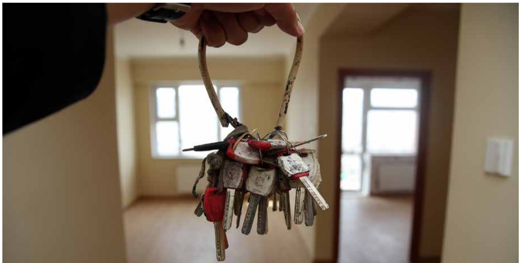
Монголбанкнаас зээлийн санхүүжилтийг нэмэгдүүлэх зорилгоор энэ сард багтан хамгийн багадаа 20 орчим тэрбум төгрөгийн дэмжлэг үзүүлэхээр төлөвлөж байна. Ингэснээр зээл гарахыг хүлээж буй иргэд шинэ онтой уралдан нүүдэл хийнэ гэсэн үг. >11