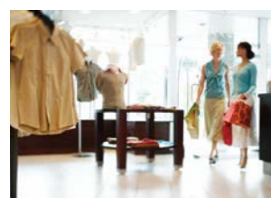
Bâtiments tertiaires Commerces, bureaux, banques

Des onduleurs facilement connectables en ajoutant une carte de communication Web/SNMP pour superviser l'état des onduleurs à distance dans l'environnement EcoStruxure™ pour faire de la maintenance préventive et corrective