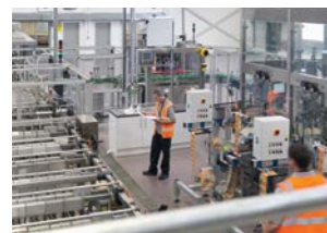
Industries Lignes de production, protection de la machine