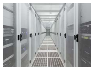
Salles informatiques et petits datacenters