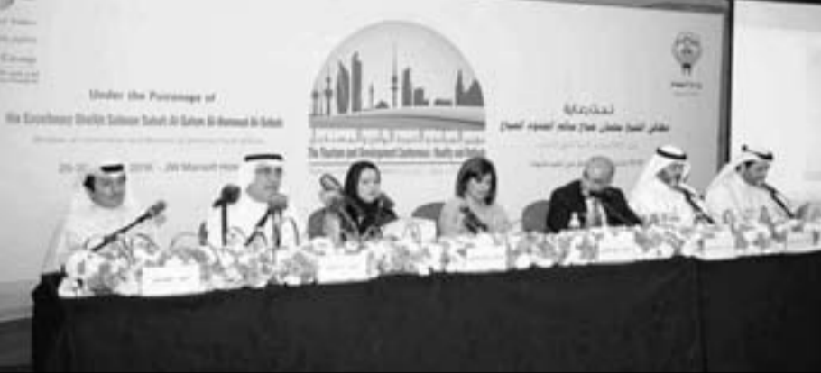
• المشاركون في اليوم الثاني للمؤتمر

وقال رئيس الإدارة العامة للطيران المدني، فواز عبدالعزيز الفرح، إن الكويت طوّرت الأطر التنظيمية للطيران، وذلك من خلال تطبيق سياسة «الأجواء المفتوحة» منذ عام 2006، مشيراً إلى أنه تم توقيع عدد كبير من الاتفاقيات الثنائية المتحررة بين الكويت ومجموعة من دول العالم، وتحديث عدد آخر من الاتفاقيات الثنائية القائمة.