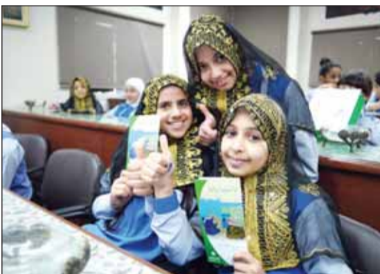
• تلميذات مدرسة أمامة بنت أبي العاص

شرح بعض الكلمات القديمة والعبادات والتقاليد التي كان يتحلّى بها الأجداد والآباء في الماضي على أعجاب الطالبات والهيمنة التدريسية والإدارية بالمدرسة. وفي ختام الزيارة، تقدمت إدارة مدرسة أمامة بنت أبي العاص بالشكر والتقدير إلى إدارة البنك على هذه الزيارة التي ساهمت في إضافة معلومات مهمة وشيقة لطالبات المدرسة عن التراث الكويتي القديم.