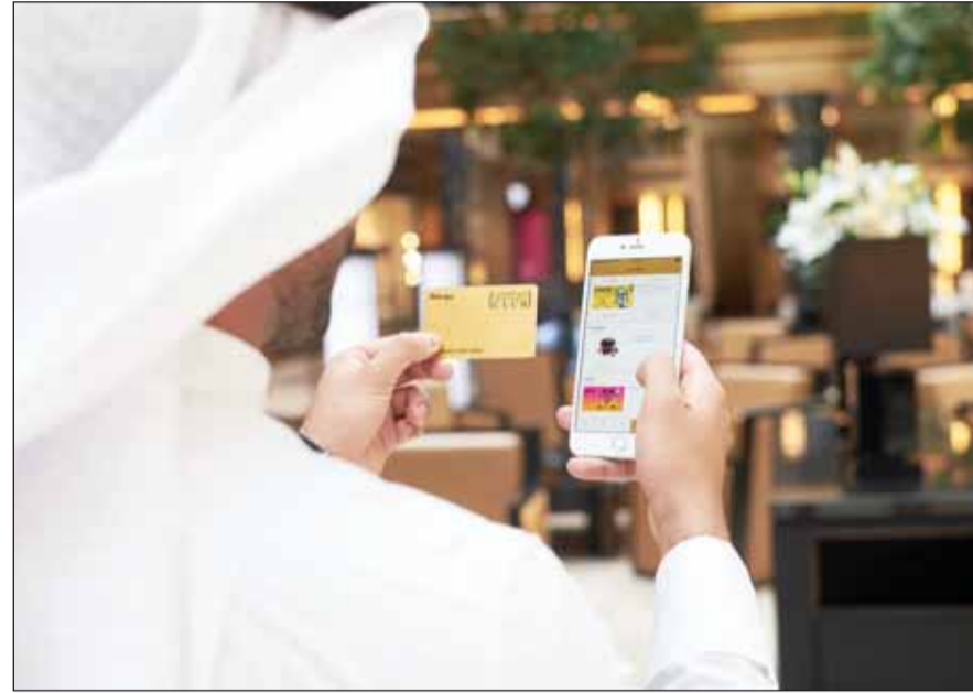
• «نادي الامتيازات» يمنح تجربة تسوق مميزة وفرصاً عديدة

تجدر الإشارة إلى أنه لدى شركة الشايح خطة لإطلاق برنامج «نادي الامتيازات» في دول أخرى في الشرق الأوسط مثل الإمارات العربية المتحدة والمملكة العربية السعودية والبحرين وسلطنة عمان وقطر، بحيث يحصل المتسوقون في تلك الدول على فرص عديدة للاستمتاع بمزايا ومكافآت نادي الامتيازات عند تسوقهم في محلات ومطاعم شركة الشايح.