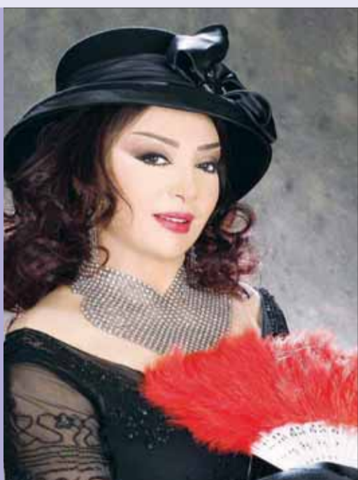
• نبيلة عبيد

أكدت نبيلة عبيد أنه لا داعي للاستعجال في أي شيء، فإذا لم يكن هناك عمل متميز ذو قيمة، ترى أنه سيسعدنا ويبهير الجماهير، فالأفضل الغياب والابتعاد والانسحاب حتى تأتي فرصة تقديم الأفضل.