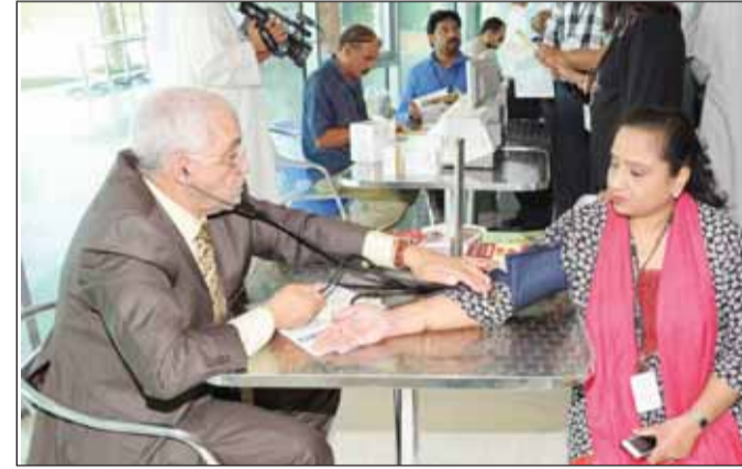
إجراء فحوصات في فعالية سابقة للجمعية (أرشيفية)

أعلنت جمعية القلب الكويتية أمس، عن فعاليتها لشهر أبريل، وتهدف إلى التواصل مع المواطنين والمقيمين وإجراء فحوصات الضغط والسكري والنكولسترول، وتسليط الضوء على أمراض القلب وعوامل الخطورة لها. وذكرت الجمعية أن فرقها ستتواجد خلال يومي 3 و4 أبريل في كلية الطب بالجابرية، ويوم 5 في إدارة تعزيز الصحة والصندوق الكويتي للتنمية الاقتصادية العربية، فيما ستتواجد يوم 7 بمدرسة نعيم بن مسعود في جليب الشيوخ، وفي 10 أبريل بكلية