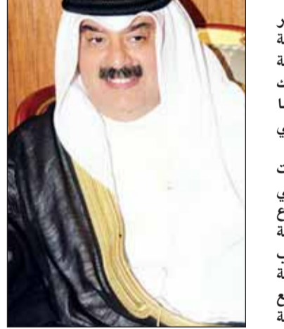
● خالد الجارالله

اعتبر نائب وزير الخارجية السفير خالد الجارالله أن القمة الخليجية الأميركية المقرر عقدها في العاصمة السعودية الرياض 21 المقبل، وبشارك فيها الرئيس الأميركي باراك أوباما تأتي استكمالاً لقمة كامب ديفيد، التي عقدت في الولايات المتحدة. وقال الجارالله في تصريحات صحافية على هامش مشاركته في ندوة أقامتها مؤسسة الباطين للإبداع الشعري أمس الأول إن هذه القمة ستبحث قضايا أهمها تحدي الإرهاب الذي يتعرض له المنطقة والعالم، خاصة ما يتصل بمواجهة داعش، والتنسيق مع الولايات المتحدة فيما يتعلق بمنظومة دفاعية متكاملة لدول مجلس التعاون، والتعاون العسكري بين دول الخليج، والولايات المتحدة، وأيضا ستكون هناك فرصة لبحث القضايا الإقليمية في سوريا، واليمن، والعلاقة الخليجية الإيرانية، والوضع في ليبيا والعراق، وهي قضايا ساخنة، ووضع تصورات لمعالجتها.