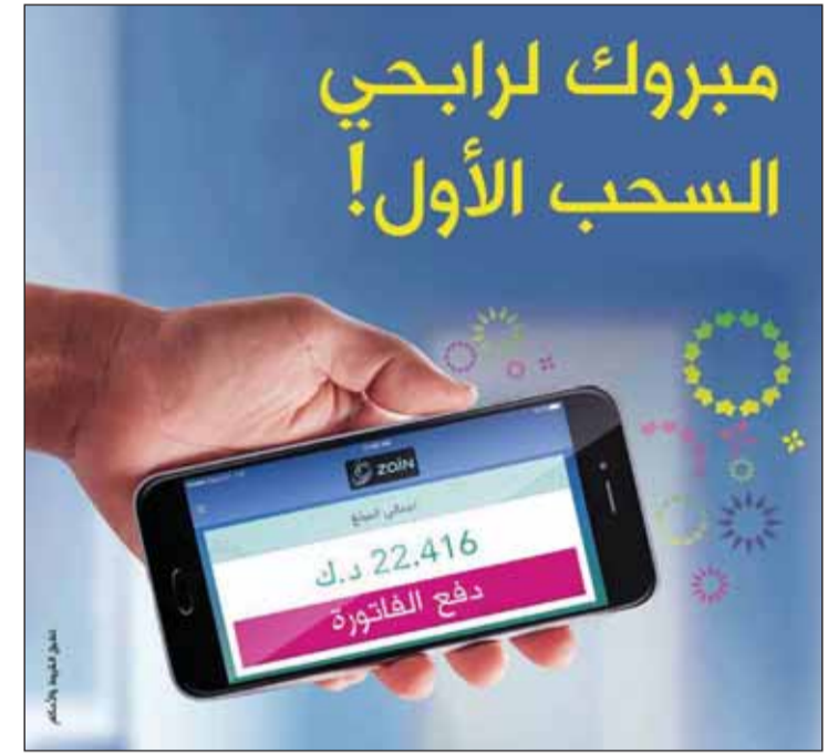
• ملصق الحملة