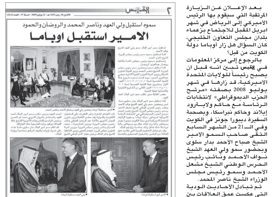
• الصفحة الثالثة من قبس

زاوية أسبوعية نطل منها على القراء، نسترجع فيها أبرز الأحداث التي عاصرتها قبس وأقرت لها صفحات طيلة 41 سنة