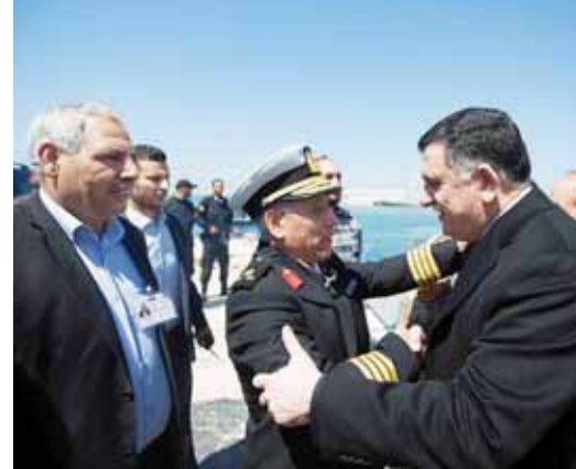
فايز سراج يصفاح عددا من المسؤولين بعد وصوله إلى طرابلس بحراً

في خطوة جريئة محفوفة بالمخاطر، وصلت حكومة الوفاق الوطني الليبي برئاسة رئيس المجلس الرئاسي فايز السراج إلى قاعدة أبوسنة البحرية في طرابلس قادمة عبر البحر من تونس، بعد إغلاق الحكومة، التي تدير العاصمة مع «فجر ليبيا» الإسلامية، مطار معيتيقة الوحيد لمنع السراج وحكومته من الدخول ومباشرة أعمالهم. وفيما لم يعرف بعد، المقر الذي ستخذه حكومة الوفاق، قالت إنها تفاوض على خطة أمنية بالتعاون مع الميليشيات الموجودة. وكان عضو بالمؤتمر الوطني، غير المعترف به دولياً، هدد باستقبال السراج ووزرائه بالسلاح واعتقالهم، فيما رفض رئيس حكومة بنغازي عبدالله الخني تسليم مهام حكومته إلى حكومة الوفاق ما لم تزل ثقة برلمان طبرق المعترف به دولياً. إلى ذلك، دعا موفد الأمم المتحدة مارتن كويلي إلى «انتقال سلمي ومنظم للسلطات»، وحذرت إيطاليا من إمكان تخلي المجتمع الدولي عن المساعي السياسية لإحلال الاستقرار في ليبيا في حال عدم تولي حكومة الوفاق مهامها من طرابلس. (طرابلس - أ ف ب، رويترز)