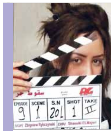
• .. وسقوط حر

مسلسل «شهادة ميلاد» من تأليف عمرو سمير عاطف وإخراج أحمد مدحت، وتدور أحداثه في إطار تشويقي غامض حول جريمة قتل فنانة مشهورة في ظروف غامضة.