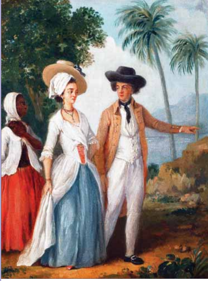
لوحة للفنان أوغستينو بروناس

بغض النظر عن عنف الحملة الشرسة التي يحملها دبشي على كتاب من نوع آذار نفيسي أو فؤاد عجمي أو سلمان رشدي، فإن ما يقوله يلقي ظلاً على مساحة أخرى من أدوار المثقف الحالي في عصر العولمة والحرب على الإرهاب. فالنمط الإمبراطوري المتوغل، والقلق في دوائر عدة منذ أحداث الحادي عشر من سبتمبر، أوجدا طلباً عالياً على الكتابات القادمة من العالم الإسلامي، ومنظقتنا العربية على وجه الخصوص. تنامت مشاريع الترجمة، تحت غطاء أدبي، لكن ليس لاعتبارات أدبية نقية، وصار جزء من قيمة الجوائز العربية في مجال الرواية مثلاً هو ترجمة الأعمال الفائزة، وهو ما حدا إلى انتشار «موديل» للكتابة يتناول القضايا التي يحبها المترجمون. تبرز هذه الأعمال