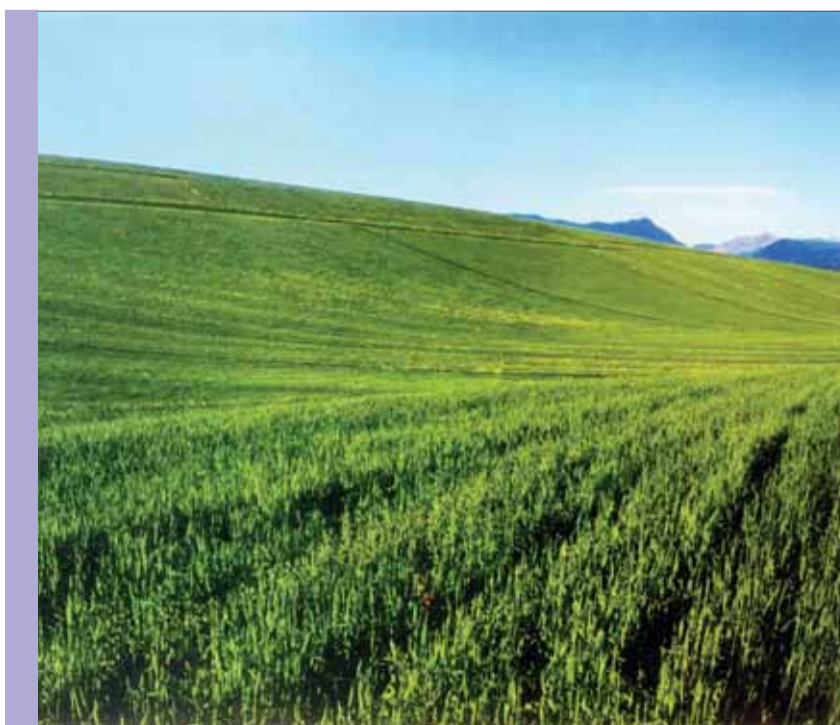
• مزارع الرز رشتي بين أدريجان وتيريز في مدينة رشت

احتل الرز (العيش) مكانته في بيوت المواطنين الكويتيين، فقبرها وغنيها، فهو رخيص وفي متناول عامة الناس، وفي جميع الفصول، ويعتبر الغذاء الأول، ويتفنن الكويتيون في تلوينه، نارة بالزعفران، ونارة بالكركم، ونارة بالدبس أو السكر، وجاء في الأمثال: «عندنا عيش وعندكم عيش هالعزيمة على ويش»، ويقال: «مجايل جيش ولا مجايل عيش»، وعرف الكويتي الرز بأنواعه المتعددة، المشهور منه عيش عنبر العراقي، سمي بهذا الاسم لرائحته الزكية، وعيش رشتي الأبيض،