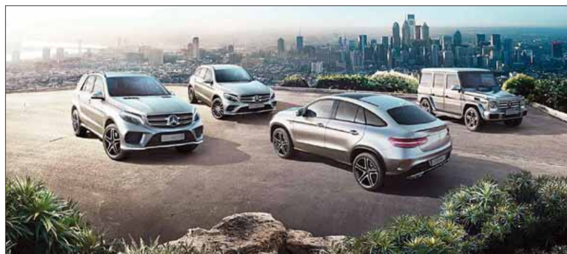
• الطيف الجديد من سيارات الدفع الرباعي

المباشر، لتكتسب جميع الطرازات في هذه الفئة الآن قوة أكبر حتى 16 في المائة، مع انخفاض معدل استهلاك الوقود حتى 17 في المائة. بتصميم متجدد وراحة مطلقة للقيادة كل يوم، مع قدرات جديدة على الطرقات الوعرة، تسافر سيارة مرسيدس - بنز GLA بين عوالم