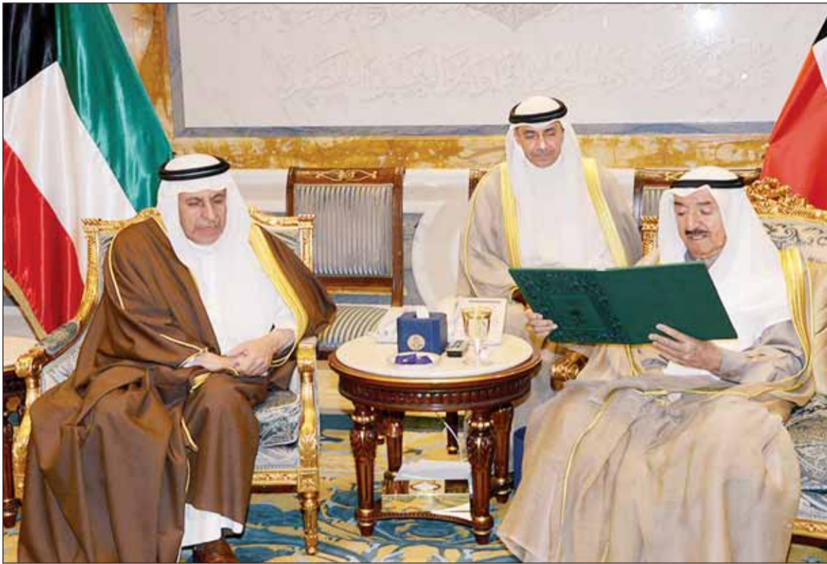
الأمير متمسلاً دعوة خادم الحرمين من الفايوز

ودعا الغانم إلى انتقال التحدي من معالجة العجز المرحلي في الميزانية إلى رؤية تنموية لهيكلة الناتج المحلي، مؤكداً أن القيمة الحقيقية للوثيقة تكمن في كونها تعبيراً حكومياً رسمياً عن الالتزام بالإصلاح. وأشار إلى أنه من الضروري أن يتواءم الإصلاح الاقتصادي مع الإصلاح المالي، لوضع حد للمغامرات الخطرة، بالاعتماد المطلق على النفط.