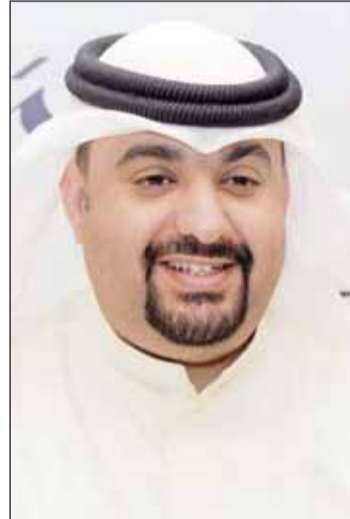
• طلال البحر

ولدى مجموعة بنك الكويت الوطني أوسع شبكة فروع محلية ودولية تغطي أربع قارات حول العالم، وتنتشر في الولايات المتحدة الأميركية وأوروبا ودول الخليج ومنطقة الشرق الأوسط والصين وسنغافورة.