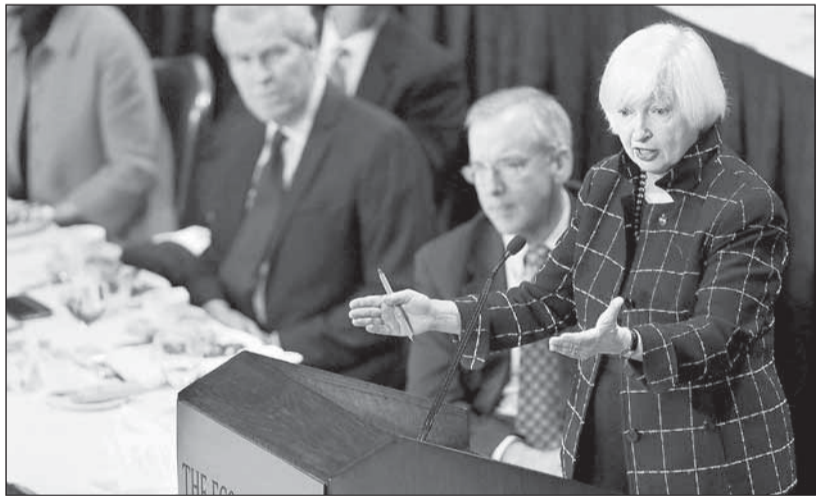
تصريحات بيلين تخفف سعر الدولار والذهب وترفع الأسهم والنفط

العام مما أدى إلى هبوط العملة الأميركية أكثر من واحد في المئة في الأربع والعشرين ساعة الماضية. وارتفع الدولار إلى أعلى مستوى في أسبوعين أمام سلة من العملات الكبرى في بداية الأسبوع بدعم من سلسلة من التصريحات التي تنبئ برفع أسعار الفائدة، مما أعطى المستثمرين الانطباع بأن أسعار الفائدة الأميركية قد ترتفع مرتين هذا العام وأن الزيادة الأولى ستكون في أبريل. وأدت تصريحات بيلين إلى انخفاض مؤشر الدولار 0.8 في المئة إلى أدنى مستوى في تسعة أيام عند 112.135 بنا حتى رغم نشر بيانات يابانية تصب في مصلحة التوقعات بحاجة طوكيو إلى مزيد من الحوافز لتجنب حدوث كساد جديد. كما انخفض الدولار أمام اليورو الذي بلغ أعلى مستوى في نحو أسبوعين عند 1.1331 دولار. كما هبط الذهب امس مع اتجاه المستثمرين لجني بعض أرباح اليوم السابق الذي شهد ارتفاع المعدن الأصفر 1.7 في المئة في أعقاب التصريحات الحذرة لبيلين.