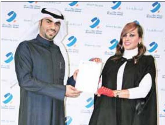
• حفلة الترقية والعي دشتي

أعلن بنك برقان عن رعايته الاستراتيجية للمشروع الوطني «نويت ابني الكويت» الذي يعد من المبادرات الوطنية التي أطلقها الاتحاد الكويتي التكنولوجي بقيادة أعضائه المتطوعين من فريق الإرشاد الأكاديمي الوطني المعتمد من وزارة الشؤون الاجتماعية والعمل ووزارة الدولة لشؤون الشباب.