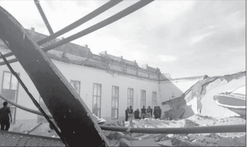
سقف المسجد عقب انهياره (الأطفاء)

من جانب آخر، تمكن رجال الإطفاء من انقاذ طفل وخادمة حاصرتهما النيران داخل أحد المنازل في منطقة صباح الناصر أمس، ونجحوا في إخماد الحريق بلا إصابات.