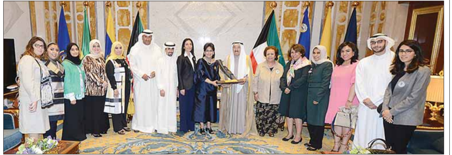
● الأمير مع وفد الجمعية الكويتية لاختلافات التعلم (كالد)

استقبل سمو أمير البلاد في قصر بيان أمس سمو ولي العهد الشيخ نواف الأحمد، ورئيس مجلس الأمة مرزوق الغانم، ورئيس مجلس الوزراء سمو الشيخ جابر المبارك، والنائب الأول لرئيس مجلس الوزراء وزير الخارجية الشيخ صباح الخالد الحمد، واستقبل أيضاً كوثر الجوعان وأنيسة جعفر وليلي العثمان وود سهام القبند، حيث قدم سمو «وثيقة عهد ووفاء من معهد المرأة للتنمية والسلام». كما استقبل سموه رئيسة الجمعية الكويتية لاختلافات التعلم (كالد) أمال السابر ورئيسة لجنة علمني صح هنادي الدعج وأعضاء اللجنة الذين قدموا لسموه الوثيقة الوطنية للخدمات التعليمية المتكاملة لذوي الإعاقة التعليمية.