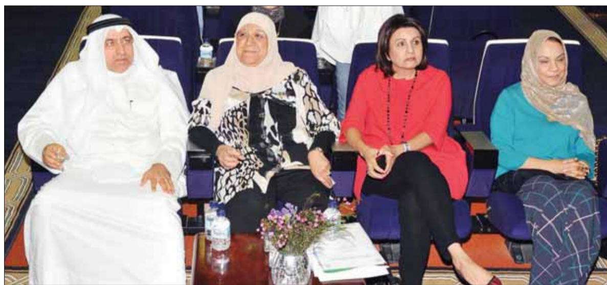
تصوير أحمد هواس