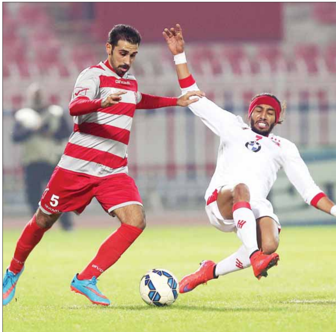
(الأزرق دوت كوم)