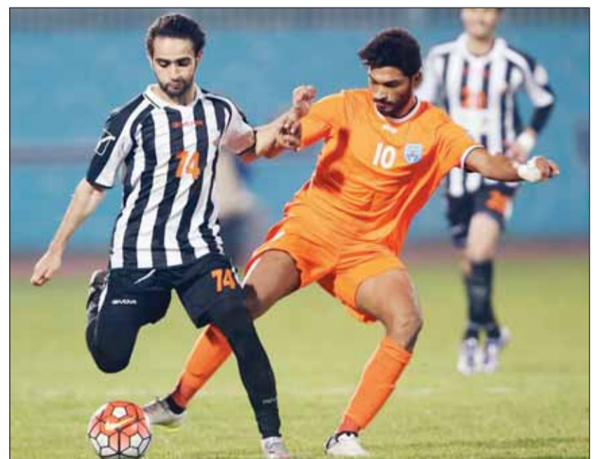
(الأزرق دوت كوم)