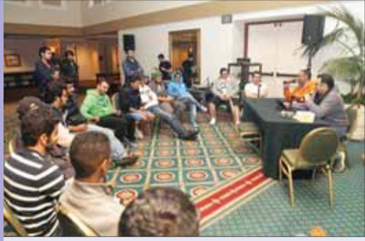
• من برنامج «الديوانية»