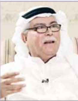
• زهير الدجيلي

تقيم جمعية الصدقة الكويتية العراقية في الساعة السابعة من مساء يوم الثلاثاء المقبل أمسية لتأبين للشاعر الراحل زهير الدجيلي في مقر جمعية الخريجين، تتضمن الأمسية عدة فعاليات من بينها شهادات من بعض أصدقاء الراحل وزملائه والفنانين والإعلاميين الذين عملوا معه، إلى جانب معزوفات من بعض أعماله الغنائية التي شدا بها كبار مطربي العراق، وقد وجهت الدعوة لعدد من الشخصيات الكويتية والعراقية والعربية والفنانين وأصدقاء الراحل لحضور الأمسية.