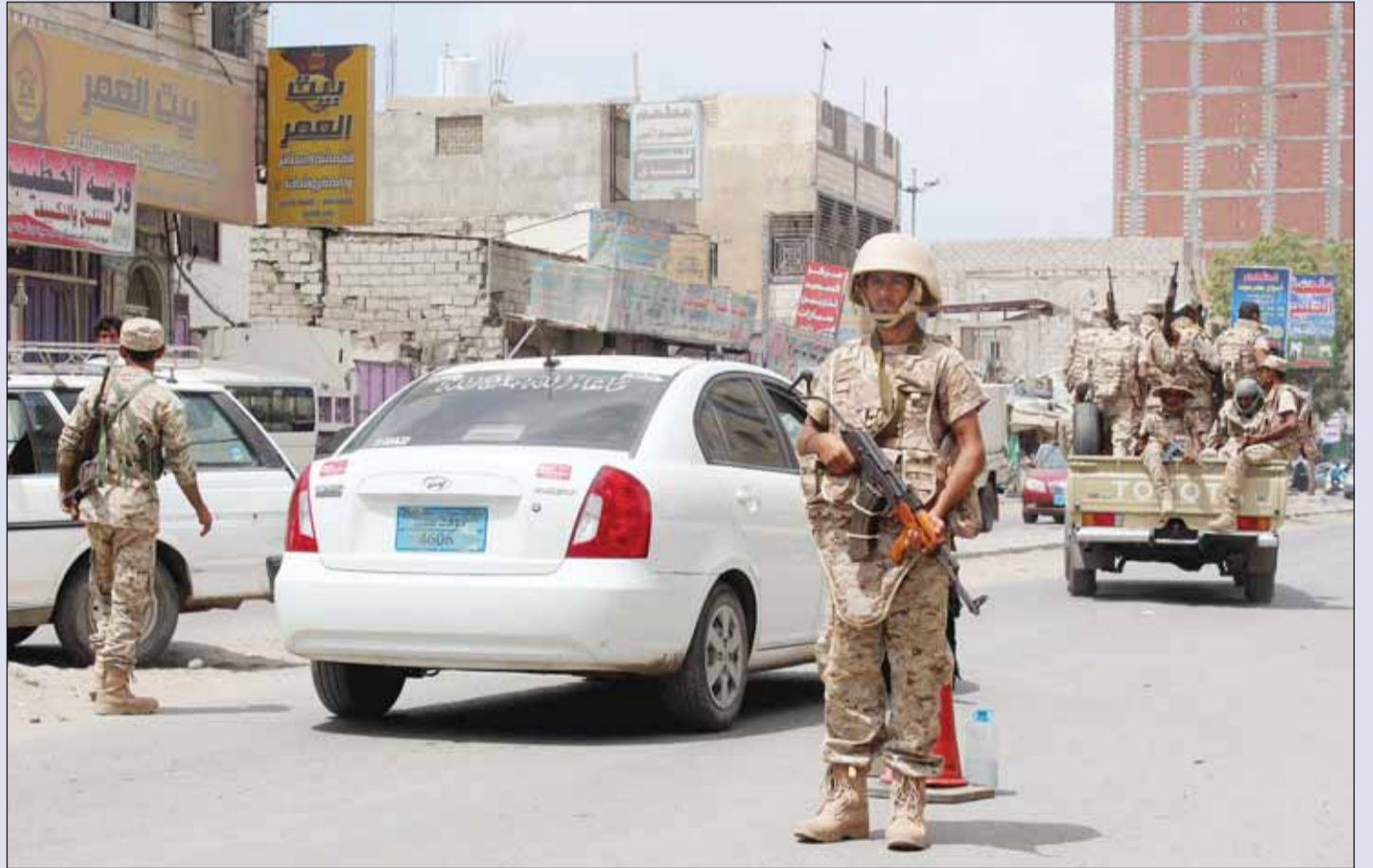
عناصر من الجيش اليمني تنتشر في مديرية المنصورة في عدن

أخرون بالفرار. وقال نزار أنور المتحدث باسم المجلس المحلي إن القوة الأمنية المكلفة بتأمين مديرية المنصورة سيطرت على مبنى السجن المركزي وعلى مداخل ومخارج المديرية وخط التسعين، ما يعني أنها باتت مسيطرة على المنصورة بشكل شبه كامل. وشرقاً، قال سكان في زنجبار كبرى مدن محافظة أبين إنهم راوا عناصر من القاعدة يفرغون المقرات الحكومية من الأسلحة وينتجوهون بها إلى ضواحي المدينة بعد قصف جوي للتحالف.