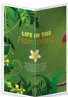
Pliage en V