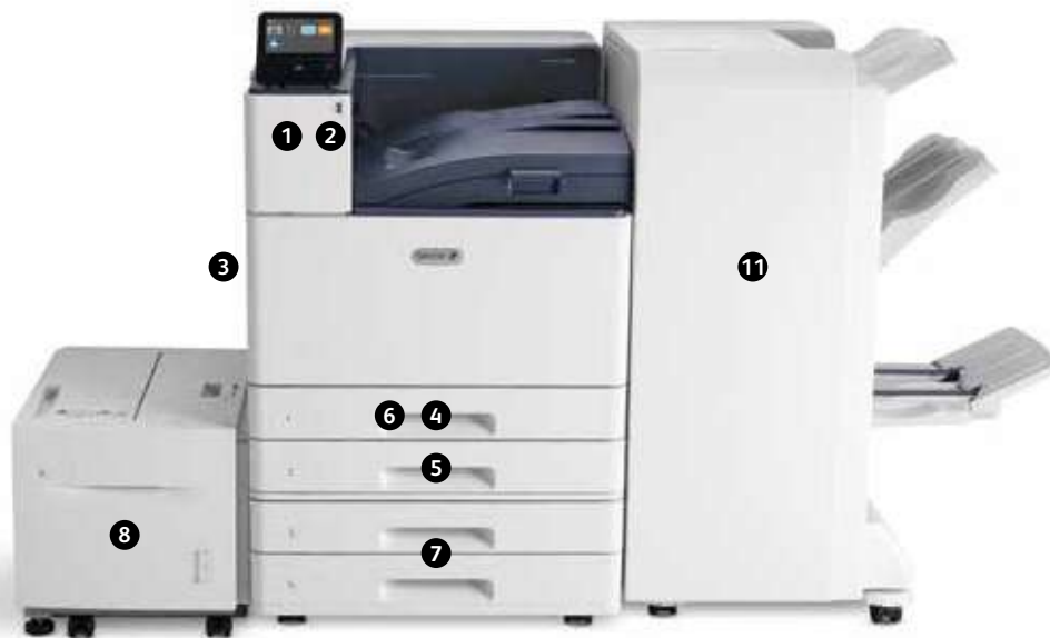
Imprimante couleur Xerox® VersaLink® C9000 Impression. Connectivité mobile.