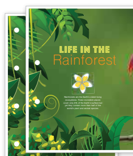
Perforation 2/4 trous