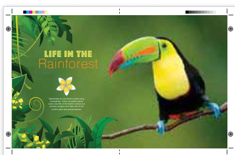
Sortie grand format pour fonds perdus A3

Avec la presse couleur Xerox® VersaLink® C9000, vous pouvez réaliser des tirages sur un large éventail de supports afin de reproduire l'intention du concepteur.