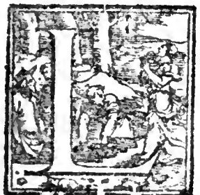
a Cuius dicere facere est. b O sterilis. c Per totum mundum, non in Iudæa tantum. d Id est ec. lesia per tabernaculum Moyū figurat. e Rubricatas. i. martyres, & hiacinti- nas. contemplantiuos.

B L auda steri- lis. Ha- ctenus d̄ natiuita te passione, resurre ctione, nunc de Gē tium & Iudæorum vocatione. Sterilis Gentilitas: quæ tūc filios non pariebat Deo, quia nec legē nec prophetas habe bat, nunc autē plu- res generat quam synagoga, quæ se Deum verum ha- bere putat. Vel ec- clesia, quæ in Iudæis deserta erat: quia ad ueniente dōmino filio ei nō pariebat, vt hoc referamus ad ecclesiam tam de Iudæis quā de Gentilibus congregatam.