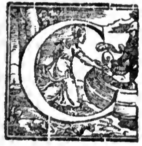
corde ad templum, ad sinagogam conueniendo, legem Dei legendo.

L ama. Domini ad prophetas, vel ad apostolos: finito priorica. in quo pax iustis, & nulla requies nunciatur impijs. Augustinus. Si cui forte displiceo, consideret periculum meum & audiatur Deum comminantem. Si non annunciaueris iniquo iniquitatem suam sanguinẽ eius de manu tua requiram. Et iterum, clama ne cesses &c. Sa- tius est fratres hic sustinere paruam amaritudinem, & post ea ad æternam beatitudinem peruenire, quam hic habere falsum gaudium & illic sine fine supplicium.