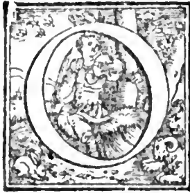
† Fide. a Humana sapientia emittit auro & argento. b Argentum vestrum te probum est.

te. Venite emite absq, argento & absque ulla a Terrena. b In principio erat verbum, & huiusmodi. c Simplicium doctrinam. vnde: Verbum caro factum est. d Ō Seribæ & Pharisei, hæretici & philosophi.