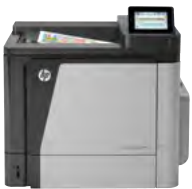
HP Color LaserJet Enterprise M651dn