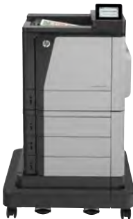
HP Color LaserJet Enterprise M651xh