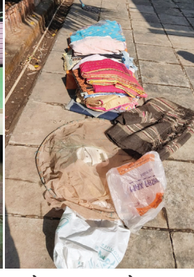
होता. त्या घटनेला आता ५६० दिवस झाले तरी बांधला नाही. पान ५ वर

पुढील उधाण होळीला पुढेच होळीचे उधाण या पेशा दीड पट मोठे आहे. पाणी नेमके रात्री जास्त येते. किमान ४०० एकर जमीन जी संपादनमध्ये नाही ती देखील नापिक होणार आहे. महिला वर्ग संताप झाल्या आहेत. प्रशासनाच्या बैठकांवर जनतेचा विश्वास राहिलेला नाही कधीही कायदा सुव्यवस्था कधीही धोक्यात येऊ शकते. असा इशाराही भगत यांनी दिला आहे.