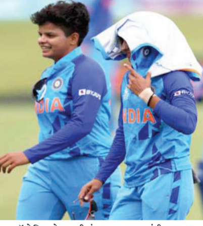
ऑस्ट्रेलियाने न्यूझीलंडचा १७ धावांनी पराभव केला होता. दुसऱ्या सामन्यात बांगलादेशचा ८ गडी राखून पराभव केला. श्रीलंकेच्या संघाचा १० गडी राखून धुव्या उडवला. त्यानंतर दक्षिण आफ्रिकेचा ६ गडी राखून पराभव करून उपांत्य

भारताने पहिल्या सामन्यात पाकिस्तानचा ७ विकेटने पराभव केला होता. वेस्ट इंडिजचा ६ गडी राखून पराभव केला होता, पण तिसऱ्या सामन्यात इंग्लंडने त्यांचा ११ धावांनी पराभव केला. यानंतर, शेवटच्या साखळी सामन्यात, संघाने डकवर्थ-लुईस पद्धतीनुसार आयर्लंडचा ५ धावांनी पराभव केला. ऑस्ट्रेलिया हा स्पर्धेतील अ गटातील पहिला संघ उरला आहे, ज्याने त्यांचे चारही साखळी सामने जिंकले आहेत. ब गटात इंग्लंडने हा पारक्रम केला. पहिल्या सामन्यात