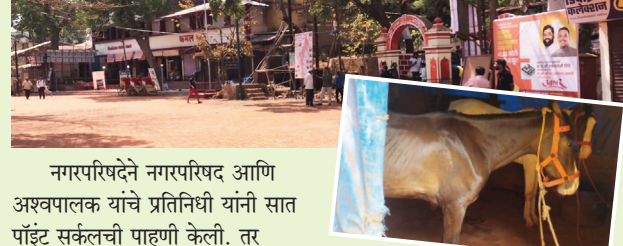
नगरपरिषदेने नगरपरिषद आणि अश्वपालक यांचे प्रतिनिधी यांनी सात पॉइंट सर्कलची पाहणी केली. तर या संपामुळे माथेरानमध्ये आलेल्या पर्यटकांचे मोठे हाल होत असून कुटुंबासह पायपीट करणाऱ्या पर्यटकांचे हाल होत आहेत. पर्यटकांचा वाहतुकीचा पर्याय असलेल्या घोड्यांना नव्याने बनविण्यात आलेल्या आणि येत असलेल्या पर्यावरण

। नेरळ । प्रतिनिधी । माथेरान येथे सुरु असलेले अश्वपालक यांचे गेल्या दोन दिवसांपासून सुरु असलेले आंदोलन बुधवारी तिसऱ्या दिवशी देखील सुरुच आहे. यामुळे नेहमी घोड्यांच्या टापांच्या आवाजाने भरून जाणाऱ्या माथेरानमध्ये सन्नाटा पसरला असल्याचे जाणवत आहे. नगरपरिषदेने नगरपरिषद आणि अश्वपालक यांचे प्रतिनिधी यांनी सात पॉइंट सर्कलची पाहणी केली. तर या संपामुळे माथेरानमध्ये आलेल्या पर्यटकांचे मोठे हाल होत असून कुटुंबासह पायपीट करणाऱ्या पर्यटकांचे हाल होत आहेत. पर्यटकांचा वाहतुकीचा पर्याय असलेल्या घोड्यांना नव्याने बनविण्यात आलेल्या आणि येत असलेल्या पर्यावरण पान ५ वर