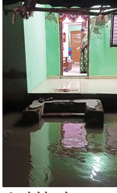
सुचित केलेले आहे.