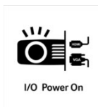
I/O Power On

Mit der HDMI Power On Funktion ist der Projektor in der Lage sich automatisch einzuschalten, sobald der Projektor ein Signal per HDMI oder VGA zugespielt bekommt. Sie brauchen den Projektor nicht mehr separat zu starten, sondern können einfach ihr Notebook, ihren Receiver oder die Spielekonsole einschalten und der Projektor schaltet sich automatisch ebenfalls ein.