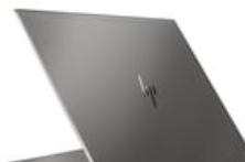
Nach links hinten zeigend