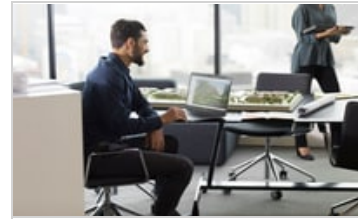
HP ZBook Studio x360 G5 Convertible Workstation, HP ZBook Studio G5 Mobile Workstation