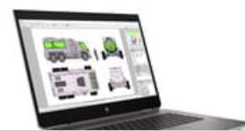
Nach rechts zeigend

54x 41 (jpg) 54x 41 (png) 100x 70 (jpg) 96x 72 (jpg) 96x 72 (png) 99x 74 (png) 153x 115 (png) 180x 135 (png) 240x 180 (jpg) 240x 180 (png) 247x 185 (png) 170x 190 (jpg) 257x 193 (png) 320x 240 (jpg) 320x 240 (png) 474x 356 (png) 513x 385 (png) 400x 400 (jpg) 400x 400 (png) 573x 430 (png) 800x 600 (png) 1500x 1126 (jpg) 1659x 1246 (png) 3756x 2350 (png) 3750x 2412 (jpg)