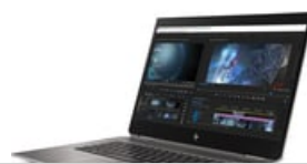
Nach links zeigend

320x 240 (jpg) 320x 240 (jpg) 320x 240 (png) 320x 240 (png) 474x 356 (png) 474x 356 (png) 513x 385 (png) 513x 385 (png) 400x 400 (jpg) 400x 400 (jpg) 400x 400 (png) 400x 400 (png) 573x 430 (png) 573x 430 (png) 800x 600 (png) 800x 600 (png) 1500x 1126 (jpg) 1500x 1173 (jpg) 1659x 1246 (png) 1659x 1246 (png) 3583x 2342 (png) 3756x 2350 (png) 3597x 2386 (jpg) 3750x 2412 (jpg)