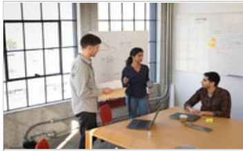
HP ZBook Studio x360 G5 Convertible Workstation, HP ZBook Studio G5 Mobile Workstation