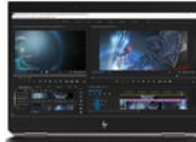
Zur Mitte zeigend

54x 41 (jpg) 54x 41 (png) 100x 70 (jpg) 96x 72 (jpg) 96x 72 (png) 99x 74 (png) 153x 115 (png) 180x 135 (png) 240x 180 (jpg) 240x 180 (png) 247x 185 (png) 170x 190 (jpg) 257x 193 (png) 320x 240 (jpg) 320x 240 (png) 474x 356 (png) 513x 385 (png) 400x 400 (jpg) 400x 400 (png) 573x 430 (png) 800x 600 (png) 1659x 1246 (png) 1500x 1481 (jpg) 2850x 2280 (jpg) 2846x 2292 (png)