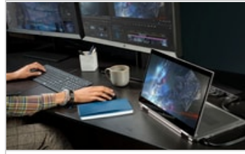
HP ZBook Studio x360 G5 Convertible Workstation, HP DreamColor Z27x G2 Studio Display