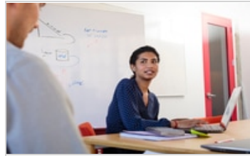
HP ZBook Studio x360 G5 Convertible Workstation, HP ZBook Studio G5 Mobile Workstation