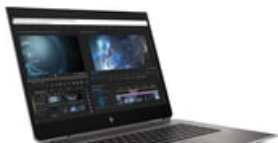
Nach rechts zeigend