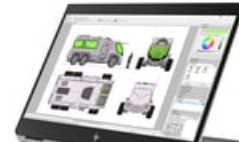
Nach links zeigend

54x 41 (jpg) 54x 41 (png) 100x 70 (jpg) 96x 72 (jpg) 96x 72 (png) 99x 74 (png) 153x 115 (png) 180x 135 (png) 240x 180 (jpg) 240x 180 (png) 247x 185 (png) 170x 190 (jpg) 257x 193 (png) 320x 240 (jpg) 320x 240 (png) 474x 356 (png) 513x 385 (png) 400x 400 (jpg) 400x 400 (png) 573x 430 (png) 800x 600 (png) 1659x 1246 (png) 1500x 1481 (jpg) 2852x 2271 (png) 2850x 2280 (jpg)