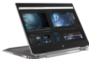
Nach links zeigender Bildschirm, Mitte