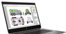
Nach rechts zeigend