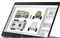
Nach links zeigend

54x 41 (jpg) 54x 41 (jpg) 54x 41 (png) 54x 41 (png) 100x 70 (jpg) 100x 70 (jpg) 96x 72 (jpg) 96x 72 (jpg) 96x 72 (png) 96x 72 (png) 99x 74 (png) 99x 74 (png) 153x 115 (png) 153x 115 (png) 180x 135 (png) 180x 135 (png) 240x 180 (jpg) 240x 180 (jpg) 240x 180 (png) 240x 180 (png) 247x 185 (png) 247x 185 (png) 170x 190 (jpg) 170x 190 (jpg) 257x 193 (png) 257x 193 (png)