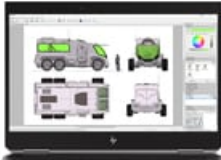
Zur Mitte zeigend

54x 41 (jpg) 54x 41 (png) 100x 70 (jpg) 96x 72 (jpg) 96x 72 (png) 99x 74 (png) 153x 115 (png) 180x 135 (png) 240x 180 (jpg) 240x 180 (png) 247x 185 (png) 170x 190 (jpg) 257x 193 (png) 320x 240 (jpg) 320x 240 (png) 474x 356 (png) 513x 385 (png) 400x 400 (jpg) 400x 400 (png) 573x 430 (png) 800x 600 (png) 1659x 1246 (png) 1500x 1481 (jpg) 2850x 2280 (jpg) 2846x 2292 (png)