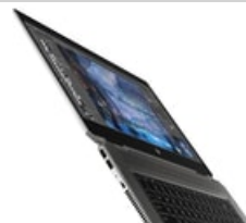
Nach links zeigend, horizontal