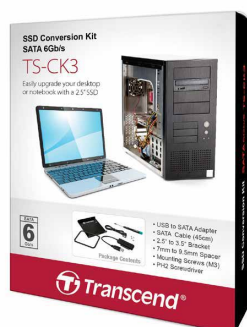
Information sur la commande TS-CK3