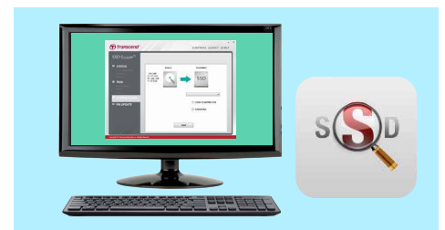
Logiciel SSD Scope pour le clone du système