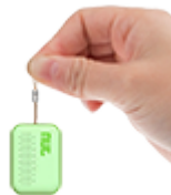
Поисковые брелки и GPS-трекеры