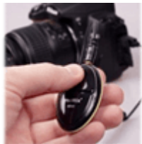
Пульты ДУ и пусковые тросики