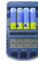
Зарядные устройства AA, AAA, ...