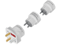
Двойники, тройники, переходники в розетку