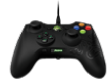
Геймпады, джойстики, рули