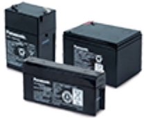
Аккумуляторы свинцово-кислотные (AGM, VLRA, SLA)