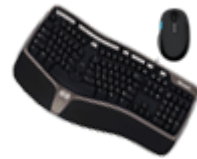
Клавиатуры и комплекты