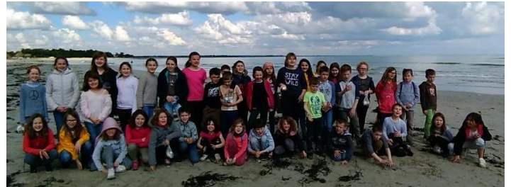
Les enfants de St Joseph sur la plage de l'Île TUDY.

Uniquement sur Rendez-Vous : Lundi matin / Nocturne Vendredi