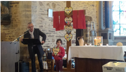
La célébration des enfants de l'école « St Joseph » en l'église de St-Thurial.

Après ce temps de méditation, une opération « Bol de Riz » a rassemblé les enfants (des C.P. au C.M.2) à l'école. Cette année, les enfants de l'école « St Joseph » vont se mobiliser en faveur de l'association « Les étoiles de Titouan » de St-Thurial.