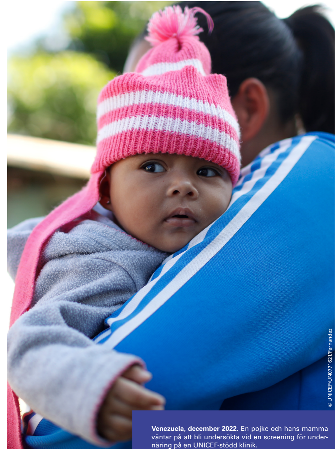
Venezuela, december 2022. En pojke och hans mamma väntar på att bli undersökta vid en screening för undernäring på en UNICEF-stödd klinik.

Barn som lever i konfliktområden är under attack i en alarmerande omfattning. På senare år har vi sett att barns utsatthet för allvarliga kränkningar förvärrats.