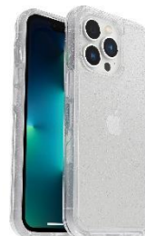
Stardust 77-84301 840104273708