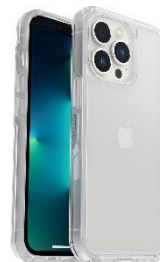
Clear 77-84288 840104273579