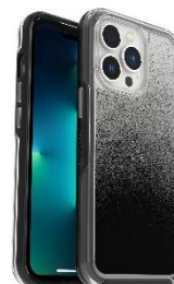
Ombre Spray 77-84295 840104273647