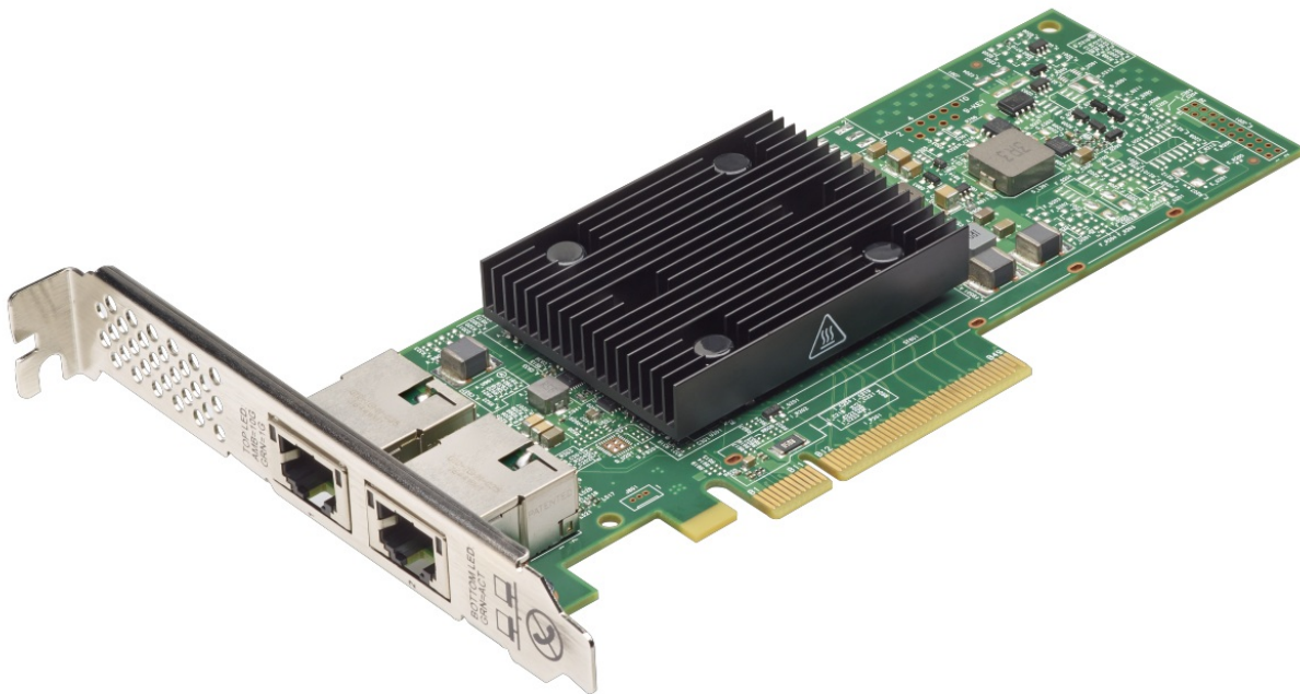
Figure 1. ThinkSystem Broadcom 57416 10GBASE-T 2-Port PCIe Ethernet Adapter

The following figure shows the ThinkSystem Broadcom 57416 10GBASE-T 2-Port PCIe Ethernet Adapter.