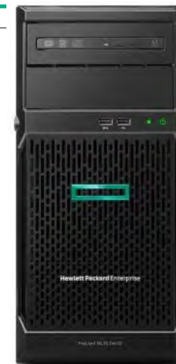
Casos de uso PYME