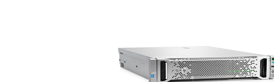
ProLiant DL180 Gen9