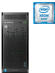
ProLiant ML110 Gen9