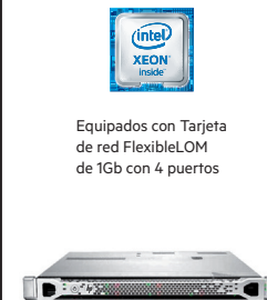
ProLiant DL360p Gen8

Equipados con Tarjeta de red FlexibleLOM de 1Gb con 4 puertos