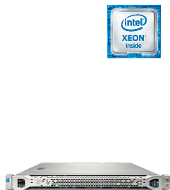
ProLiant DL160 Gen9