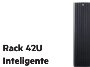
Rack 42U Inteligente