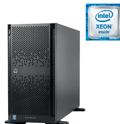
ProLiant ML350 Gen9