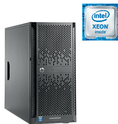
ProLiant ML150 Gen9