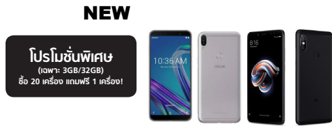
ZenFone Max Pro M1 (3GB / 32GB)

ASU-X00TD-4A072TH (Black) ASU-X00TD-4H071TH (Silver)