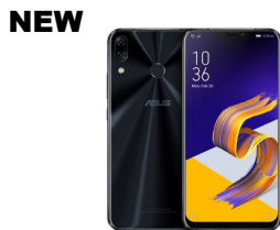
Zenfone 5z ZS620KL

ASU-Z01RD-2A095TH (Midnight Blue) ASU-Z01RD-2H096TH (Metro Silver)