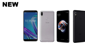
ZenFone Max Pro M1 (4GB / 64GB)

ASU-X00TD-4A072TH (Black) ASU-X00TD-4H071TH (Silver)