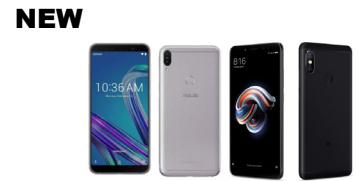
ZenFone Max Pro M1 (6GB / 64GB)

ASU-X00TD-4A089TH (Black) ASU-X00TD-4H090TH (Silver)