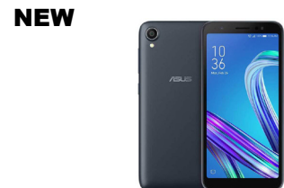
Zenfone Live L1 ZA550KL

ASU-X00QD-1A025TH (Midnight Blue) ASU-X00QD-1H026TH (Metro Silver)