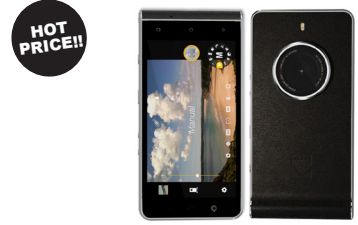
KODAK Phone KDK-EKTRA (Black)