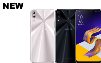
ZenFone 5 ZE620KL

ASU-Z01RD-2A095TH (Midnight Blue) ASU-Z01RD-2H096TH (Metro Silver)