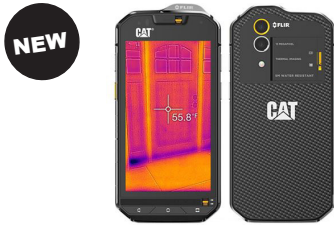
CAT Phone CAT-S60 (Black)