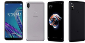
ZenFone Max Pro M1 (6GB / 64GB)

ASU-X00TD-4A092TH (Black) ASU-X00TD-4H091TH (Silver)