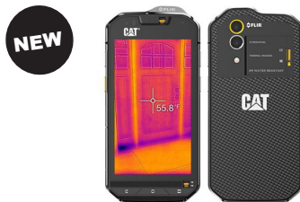
CAT Phone CAT-S60 (Black)