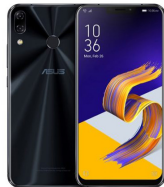
Zenfone 5z ZS620KL

ASU-Z01RD-2A095TH (Midnight Blue) ASU-Z01RD-2H096TH (Metro Silver)