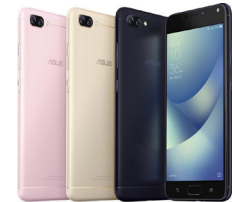
ZenFone 4 Max ZC520KL (3G/32G)

ASU-X00ID-4A031TH (Black) ASU-X00ID-4I033TH (Pink)