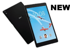
TAB4 Ess TB-7304F