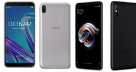
ZenFone Max Pro M1 (3GB / 32GB)

ASU-X00TD-4A072TH (Black) ASU-X00TD-4H071TH (Silver)