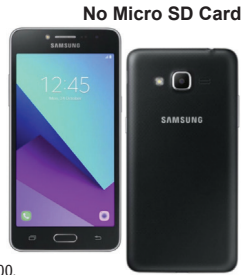
No Micro SD Card