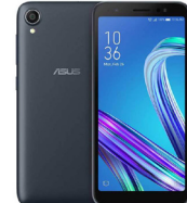
Zenfone Live L1 ZA550KL