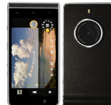
KODAK Phone KDK-EKTRA (Black)