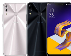
ZenFone 5 ZE620KL

ASU-X00QD-1A025TH (Midnight Blue) ASU-X00QD-1H026TH (Metro Silver)