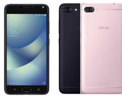
Zenfone 4 Max Pro ZC554KL

ASU-X018D-4A082TH (Black) ASU-X018D-4G083TH (Gold) ASU-X018D-4D084TH (Silver)