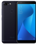
ZenFone Max Plus (M1) ZB570TL

ASU-X018D-4A082TH (Black) ASU-X018D-4G083TH (Gold) ASU-X018D-4D084TH (Silver)