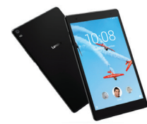
TAB E7 TB-7104I