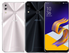
ZenFone 5 ZE620KL