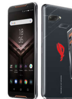
ROG Phone ZS600KL