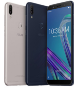
ZenFone Max Pro M1 (3GB / 32GB)