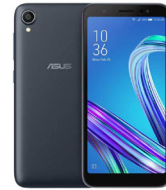
Zenfone Live L1 ZA550KL

ASU-X017DA-5A106TH (Black) ASU-X017DA-5B107TH (White) ASU-X017DA-5C108TH (Red)