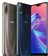
Zenfone Max Pro M2 (ZB631KL) (6GB / 64GB)

ASU-X01BDA-4D039G1 (Midnight Blue) ASU-X01BDA-4J040G1 (Cosmic Titanium)