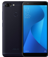
ZenFone Max Plus (M1) ZB570TL

ASU-X018D-4A082TH (Black) ASU-X018D-4G083TH (Gold)