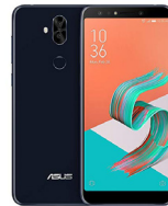
Zenfone 5Q ZC600KL

ASU-X017DA-5A106TH (Black) ASU-X017DA-5B107TH (White) ASU-X017DA-5C108TH (Red)