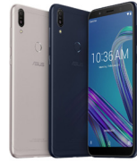
ZenFone Max Pro M1 (4GB / 64GB)

ASU-X00TD-4A089TH (Black) ASU-X00TD-4H090TH (Silver)