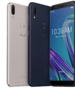
ZenFone Max Pro M1 (6GB / 64GB)

ASU-X00TD-4A089TH (Black) ASU-X00TD-4H090TH (Silver)