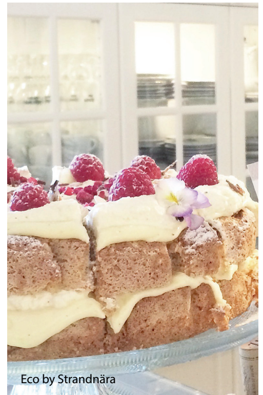
Eco by Strandnära