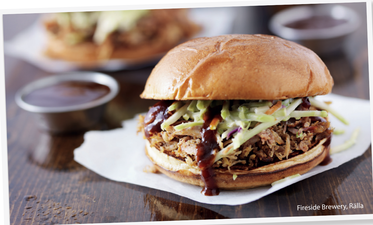
Fireside Brewery, Rälla