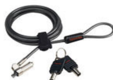
Cable de seguridad ultrafino con candado (PA5288U-1KCL)