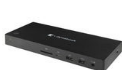
Docking USB-C de dynabook (PA5356E-1PRP)