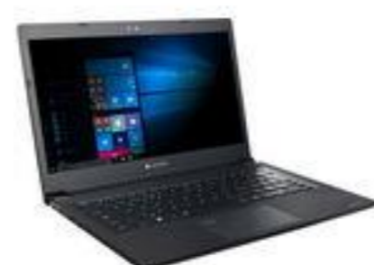
Filtro de privacidad (adhesivo) (PX1908E-2NAC)