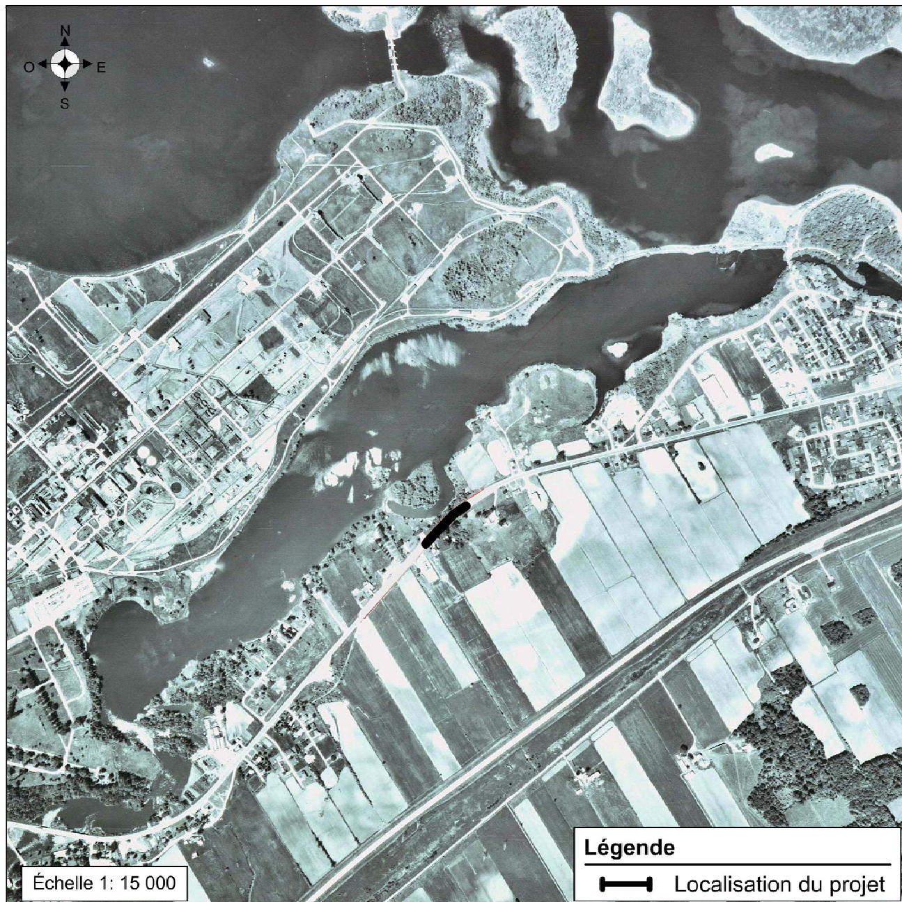
Figure 3 Localisation sur photo aérienne du projet n° 154-07-0307 (Ministère de l'Énergie et des Ressources du Québec, Q.83307-25 1983)