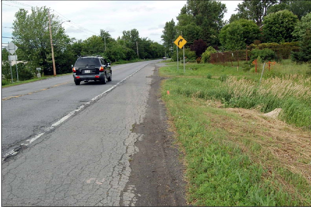
Photo 1 Projet n° 154-07-0307, environnement du secteur 1, vers l'est (PATR08N04-035)