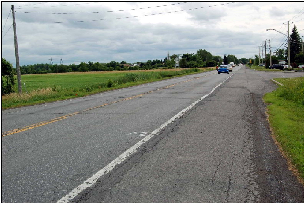
Photo 2 Projet n° 154-07-0307, environnement du secteur 1, vers l'ouest (PATR08N04-034)