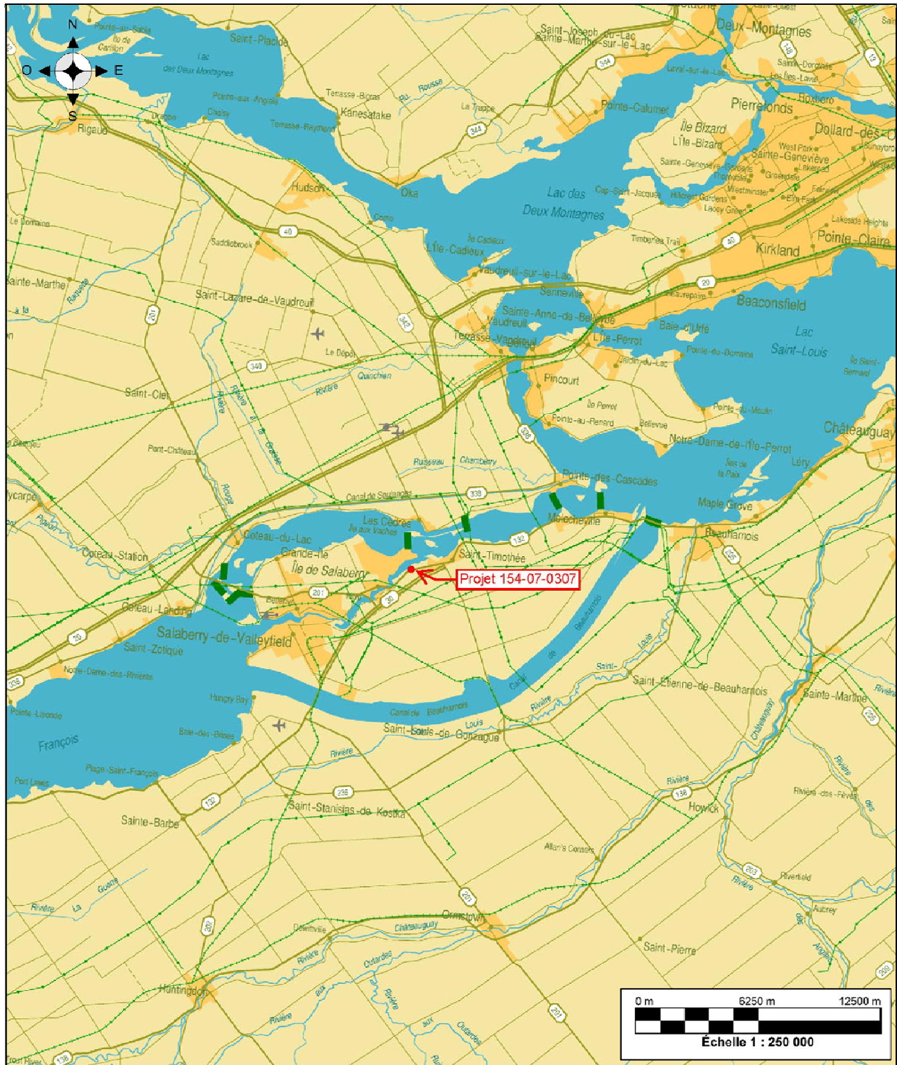
Figure 1 Localisation générale du projet d'aménagement routier inventorié