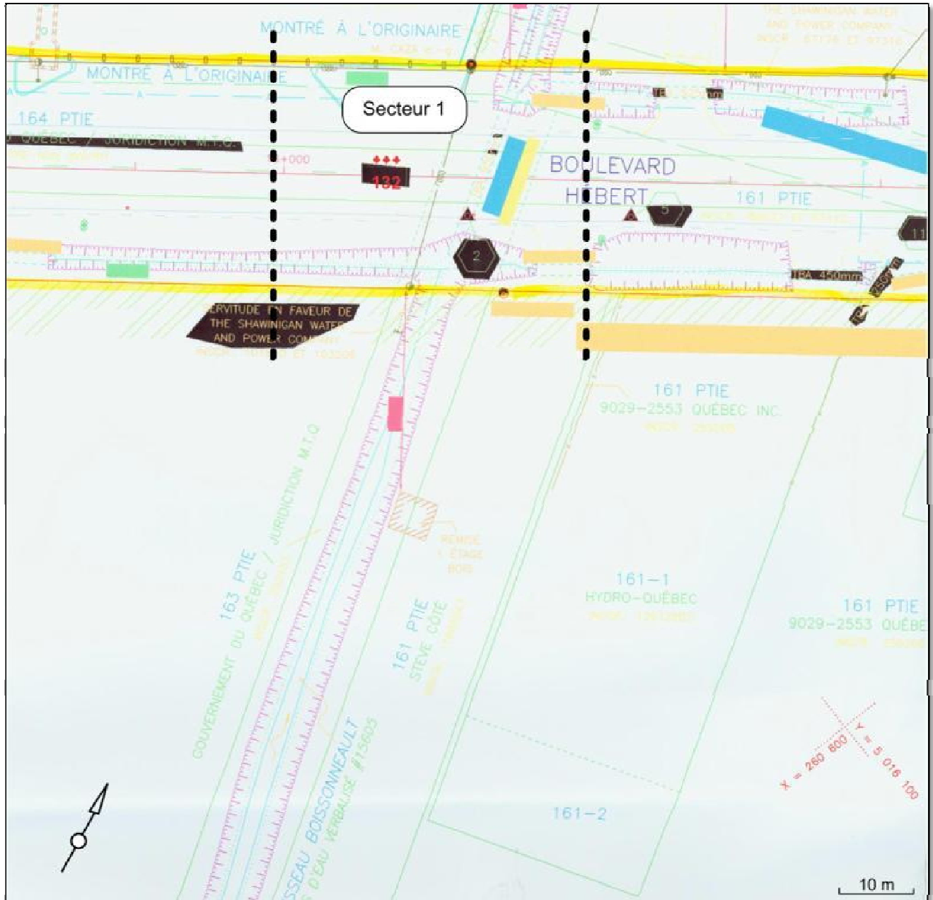
Figure 4 Localisation du secteur d'inventaire 1 du projet n° 154-07-0307 (MTQ)