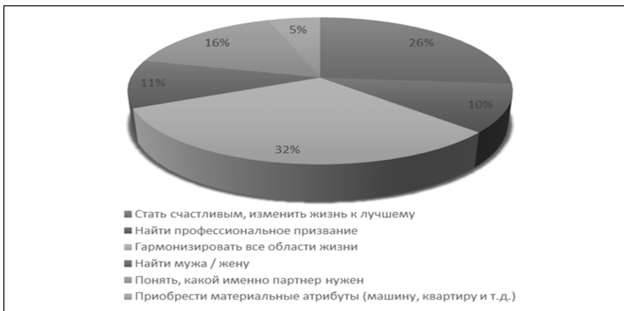
Рисунок 1 – Ценностные ориентации на физическом этапе развития личности (24-26, 36-38)

Респонденты, находящиеся на физическом этапе развития личности (24-26, 36-38) составили 31 человек, они продемонстрировали следующий результат, представленный на рисунке 1.