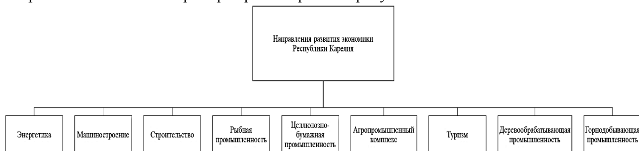
Рис. 1 – Направления развития экономических отраслей Республики Карелия

В Республике Карелия экономика развивается во множестве разнообразных направлений. Многие из примеров рассмотрены на рисунке 1.