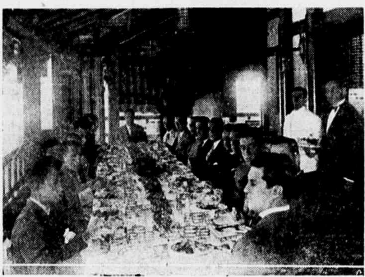
Um aspecto do almoço de hoje no Lido