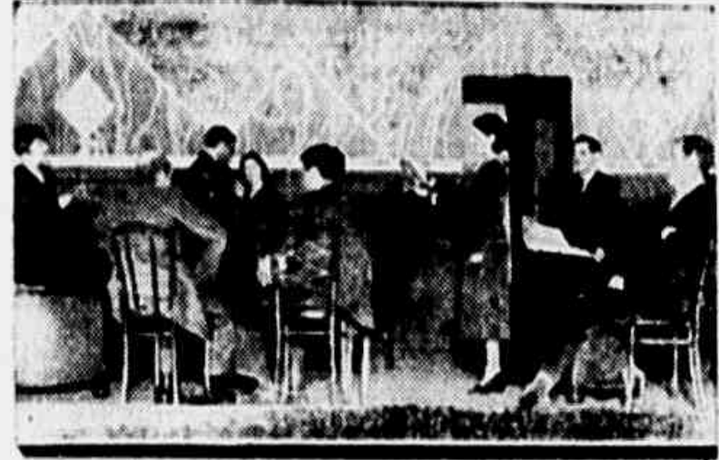
Um ensaio de uma cena da comedia "O outro homem"

IMPRESSÕES DE PROCOPIO FERREIRA SOBRE A COMEDIA "O OUTRO HOMEM"