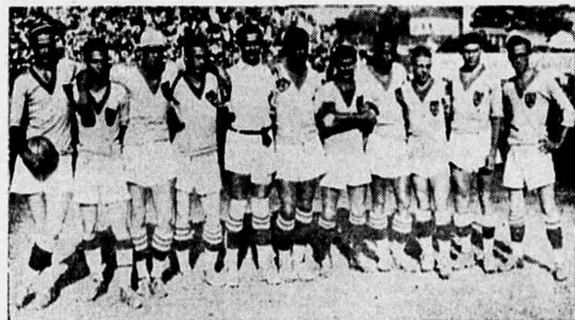
A turma carioca que está chamada, para o treino de amanhã.