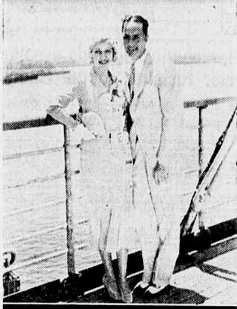
Carole Lombard e William Powell a bordo do navio que os levou a Hawaii, para as delicias da lua de mel.

Parece que as palavras conscienciosas do DIARIO DA NOITE sobre a melhor maneira de tornar aceitavel o film falado pelo publico, e o que será adotado em breve por todas as empresas.