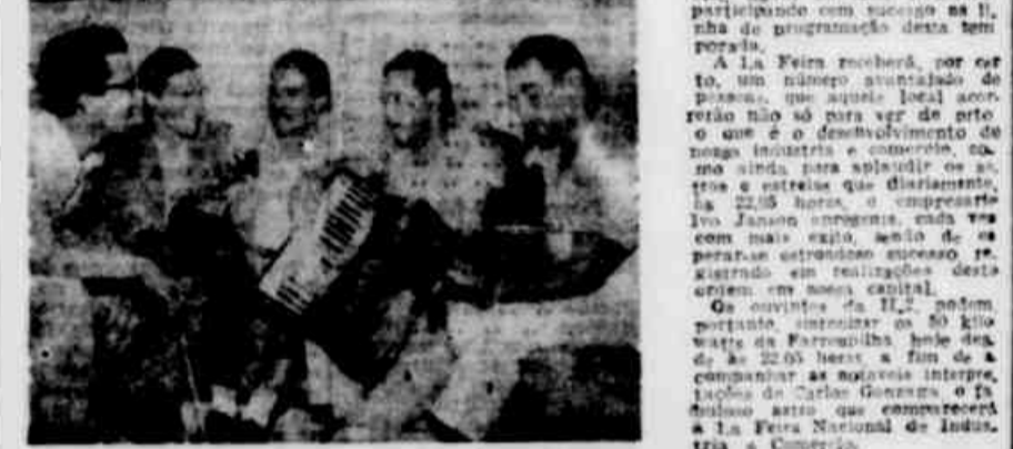
OS GAUDERIOS atua rdo, hoje, às 20,45 horas, em "Bulcão Farrapoilha"...