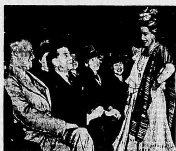
A EXPOSIÇÃO LATINO-AMERICANA DA CASA MAX...