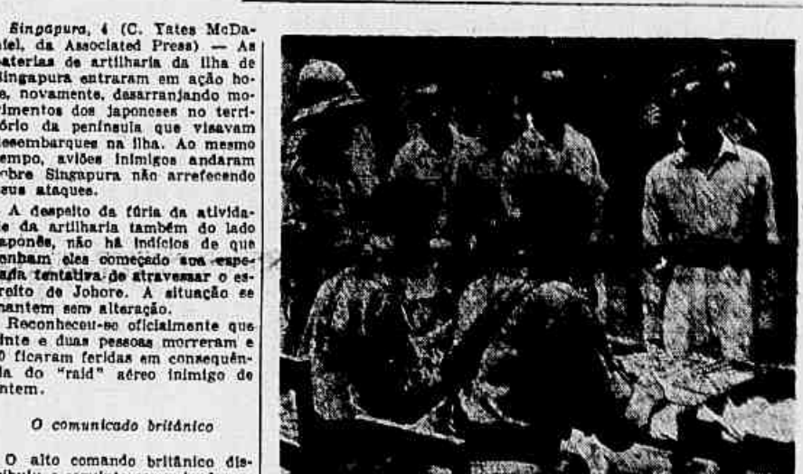
Um posto de recrutamento de nativos da Malásia, que em grande número foram incorporados às forças britânicas que defendem Singapura, integradas por ingleses, indianos, australianos e elementos procedentes de vários dos Domínios do Império.