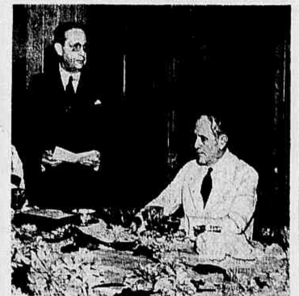
O sr. Caracelo Parra Perez no momento em que agradece a homenagem que lhe foi prestada

O sr. Oswaldo Aranha ofereceu, ontem, no Palácio Itamaraty, um jantar de despedida ao ministro das Relações Exteriores da Venezuela, sr. Caracelo Parra Perez, que veio representar seu país na III Reunião de Consulta recentemente aqui realizada. Compararam-se as agasas dos ministros diplomatas e altas autoridades.