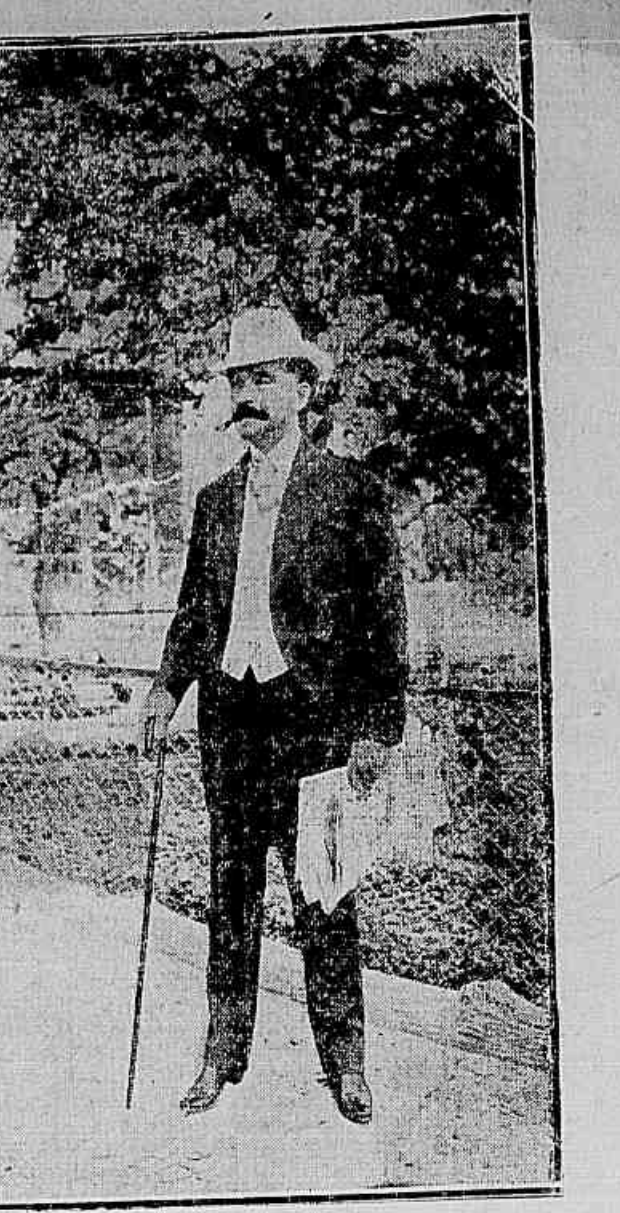
Ultimo retrato do Sr. Pinheiro Machado