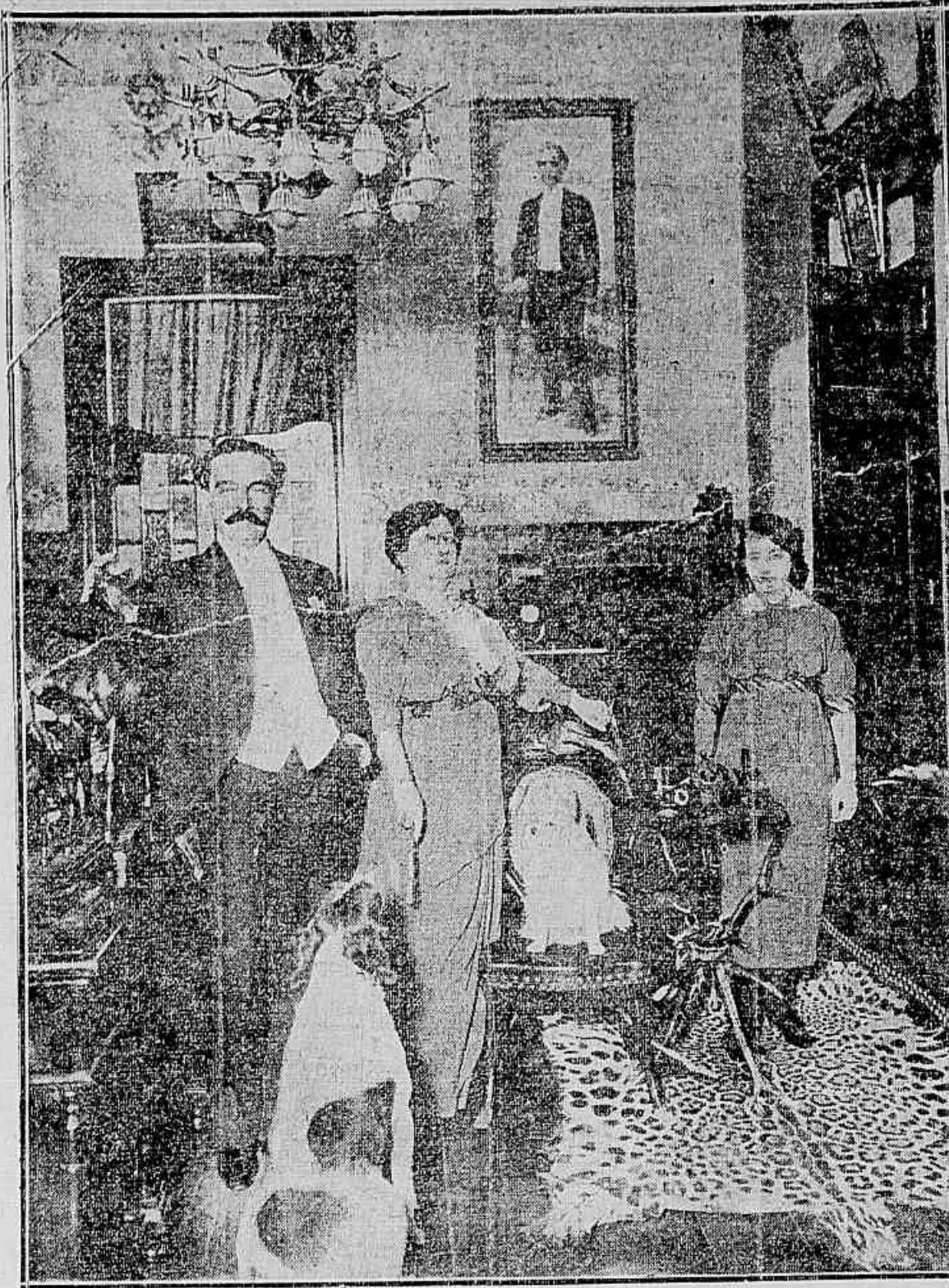
O Sr. Pinheiro Machado, senhora e uma sobrinha em sua residencia