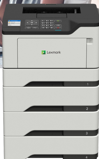
B2546dw avec bacs d'alimentation en option