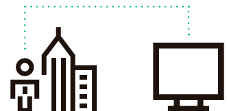
CAL de Servicio de escritorio remoto (RDS)

Único dispositivo con usuarios ilimitados