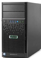
Proiant ML30 Gen9