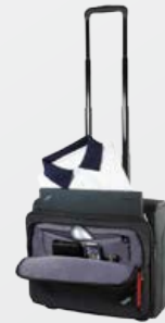
Valise à roulettes ThinkPad Radiant - Réf 78Y2375