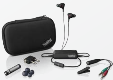
Écouteurs intra-auriculaires à filtrage de bruit pour ThinkPad® (0B47313)