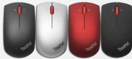
Souris sans fil ThinkPad Precision - Noir mat (0B47163)/Rouge vif (0B47165)/Argent (0B47167)/Noir brillant (0B47168)/Noir mat (0B47153)