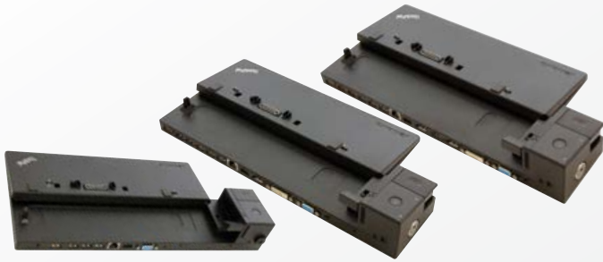
ThinkPad® Ultra Dock (40A20090XX), ThinkPad® Pro Dock (40A10065XX), ThinkPad® Dock (40A00065xx)